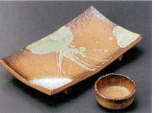
164-15-6F3 2,250円 1965136021 信楽風まな板皿 (22×13×3.3H) 164-16-6F3 610円 1965136022 信楽風千代口 (7φ×3.3H)