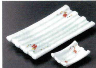
164-09-6F3 2,400円 1965136023 青白磁赤絵花焼物皿 (24.5×13.5×3.4H) 164-10-6F3 990円 1965136024 青白磁赤絵花長角千代口 (10×7×3H)