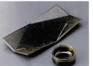
164-23-1B3 2,030円 2312164023 蒔絵四方上り焼き物皿 (23×10.5×2H) 164-24-1B3 670円 2312164024 蒔絵丸千代口 (6.5φ×3.3H)