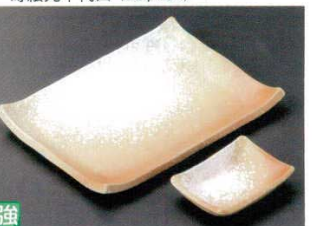
164-31-2A3 1,770円 2321164031 雪どけ焼物皿 (21.3×15.7×2.8H) 164-32-2A3 600円 2321164032 雪どけ千代口皿 (9.3×6.8×2.4H)