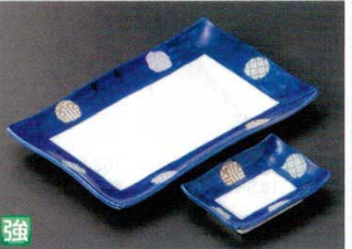
164-13-7C3 2,300円 1973136019 ダミ丸紋祥瑞8.0焼物皿 (21.7×13.7×2.4H) 164-14-7C3 700円 1973136020 ダミ丸紋祥瑞長角千代口 (10×7×2.5H)