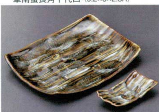
164-35-6A3 1,760円 2261514029 うのふ織部8.5長角皿 (23×17.3×3H) 164-36-6A3 580円 2261514027 うのふ織部3.5長角皿 (11×6×2.5H)