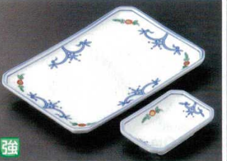
164-05-7F3 2,500円 2275163003 八祥四ツ切焼物皿 (21.4×14.4×2.4H) 164-06-7F3 950円 2275163004 八祥四ツ切千代口 (10.5×7×3.7H)