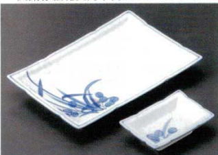
164-19-6F3 2,100円 2365164019 紅萩角測焼物皿 (22×14.7) 164-20-6F3 750円 2365164020 紅萩角測長千代口 (10.2×7)