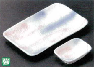
164-03-6A3 2,530円 2261519013 茜石焼長角焼物皿 (21×13×2.5H) 164-04-6A3 1,030円 2261519015 茜撫角小皿 (9×6.5×2.5H)