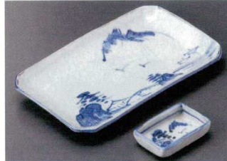
164-01-1B3 2,860円 1912137021 古染山水長角皿 (23.8×14.2×2.3H) 164-02-1B3 790円 1912137022 古染山水角千代口 (8×5.4×2H)

和食器 焼皿和皿大皿盛鉢 漆器 井 茶碗 急須 茶器 和陶 耐熱 陶古瓶 洋器 中華食器 カラス 金漆 茶道具 漆器 木竹製品 神 仏具