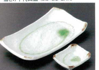
164-40-2C3 1,650円 1923137015 鳴門貫入焼物皿 (25×14×4H) 164-41-2C3 500円 2223163031 鳴門貫入角千代口 (9.5×8×3H)