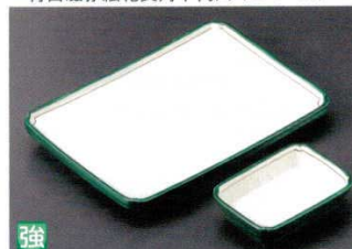
164-17-2A3 2,150円 2321164017 グリーン交趾8.0焼物皿 (20.4×14.2×2.4H) 164-18-2A3 760円 2321164018 グリーン交趾千代口 (9.7×6.9×2.9H)