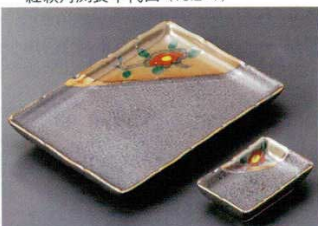
164-27-2A3 1,850円 1921137007 華南蛭8.0焼物皿 (20.7×14.8×3.2H) 164-28-2A3 700円 1921137008 華南蛭長角千代口 (9.2×6×2.8H)