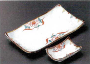
164-11-6F3 2,300円 1965136027 測錆赤絵花焼物皿 (23.8×13×3.2H) 164-12-6F3 1,050円 1965136028 測錆赤絵花長角千代口 (10×6.8×3H)