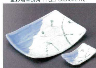
164-33-6A3 1,760円 2261495079 清流織部ちらし8.5長角皿 (23×17.5×3H) 164-34-6A3 580円 2261495077 清流織部ちらし3.5長角皿 (11×6×2.5H)