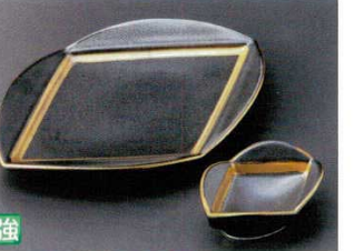
164-07-2A3 2,430円 2321164007 結晶菱形焼物皿 (22.5×15.7×2.8H) 164-08-2A3 1,030円 2321164008 結晶菱形千代口 (9.5×7×3.6H)