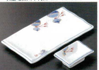
164-29-4B3 1,850円 1942137001 染錦ひさご焼物皿 (24.5×13.5×2.2H) 164-30-4B3 850円 1942137002 染錦ひさご角千代口 (9.5×6.5×3.3H)