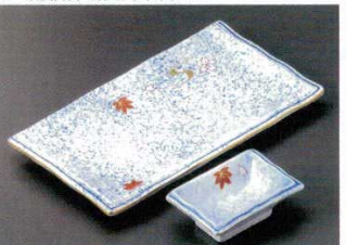
164-21-4B3 2,050円 1942136031 吹墨竜田川焼物皿 (24.5×13.5×2.2H) 164-22-4B3 900円 1942136032 吹墨竜田川千代口 (9.8×6.5×3.5H)