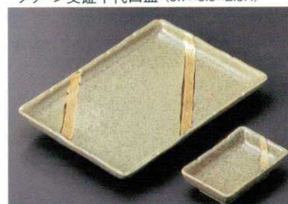
164-25-2A3 1,980円 1921136033 金彩若草8.0焼物皿 (20.9×14.7×3H) 164-26-2A3 750円 1921136034 金彩若草長角千代口 (9.2×6×2.7H)