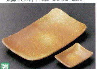
164-37-1A3 1,750円 2311164037 赤藤8.0焼物皿 (23.2×14×2.9H) 164-38-1A3 1,280円 2311164038 赤藤7.0焼物皿 (19.4×12.5×2.6H) 164-39-1A3 570円 2311164039 赤藤長角千代口 (9.2×6.9×2.3H)