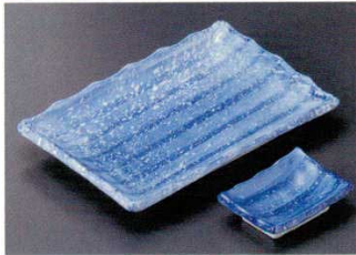
166-01-6F3 1,100円 1965138001 波型焼物皿 (21.5×14.5×3.3H) 166-02-6F3 380円 1965138002 波型角千代口 (9×6.5×2.8H)

和洋食器 焼物皿 酒器 茶器 和陶 急須 耐熱 洋食器 中華食器 ガラス 茶道具 雑器 木竹製品 神仏具