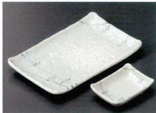
166-25-3A3 800円 2131180032 花かすみ7.0長角皿 (20.3×13×2H) 166-26-3A3 300円 2131180033 花かすみ長角小皿 (9.5×6.5×2.5H)