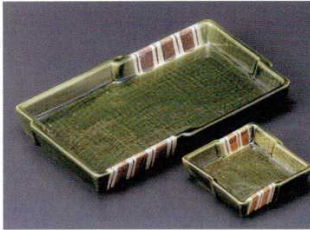
166-03-6H3 1,100円 2266164029 織部十草切立焼物皿 (22×13×2.5H) 166-04-6H3 520円 2266164030 織部十草切立千代口 (8.2φ×2.2H)