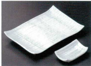
166-17-6A3 900円 2261164041 青磁すだれ 7.0長角皿 (20.5×14×3H) 166-18-6A3 300円 2261164042 青磁すだれ 長角小皿 (9×6×2.5H)