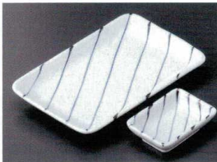
166-21-2B3 830円 2322166021 ストライプ7.0浜付長角皿 (20.7×13.2×2.5H) 80入 166-22-2B3 330円 2322166022 ストライプ長角小皿 (9.3×6.4×2.6H) 200入