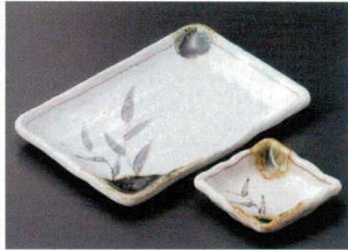
166-07-4A3 1,100円 1941139043 志野織部芦7.0長角皿 (20×14×2H) 166-08-4A3 440円 1941139045 志野織部芦角小皿 (8.3×8.3×2.4H)