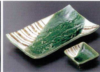
166-15-1H3 1,000円 2216164017 織部トクサ焼物皿 (22.4×13.1×3.5H) 60入 166-16-1H3 380円 2216164018 織部トクサ千代口 (7×7×2.8H) 120入