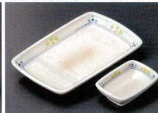
166-39-4A3 730円 1941138015 萩風梅7.0長角皿 (19×12×2.5H) 166-40-4A3 250円 1941138016 萩風梅長角小皿 (8.8×6.1×2.5H)