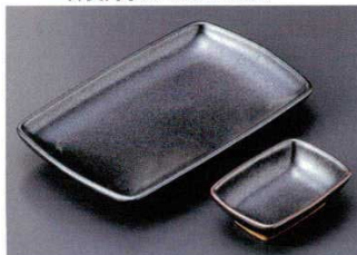
166-35-4A3 750円 2241165011 鉄砂釉7.0長角皿 (19.2×12×2.5H) 166-36-4A3 290円 2241165012 鉄砂釉長角小皿 (9×6.4×2.5H)