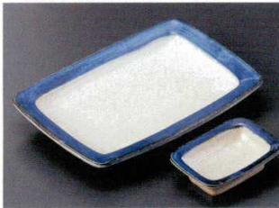
166-11-6B3 1,050円 1962139046 黄瀬戸ナ子角皿(大) (22.5×15×3.5H) 166-12-6B3 830円 1962139047 黄瀬戸ナ子角皿(中) (21×14.5×3.3H) 166-13-6B3 640円 1962139048 黄瀬戸ナ子角皿(小) (19×13×2.8H) 166-14-6B3 320円 1962139049 黄瀬戸ナ子角小皿 (9.5×6.5×2.5H)