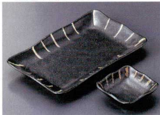
166-09-6H3 1,100円 2266164033 黒十草角焼物皿 (21.5×13×3H) 166-10-6H3 490円 2266164034 黒十草角千代口 (8φ×3.5H)