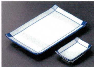
166-27-4A3 800円 1941138017 一升7.0長角皿 (20.2×12.8×2.6H) 166-28-4A3 300円 1941138018 一升長角小皿 (9.2×6×2.5H)