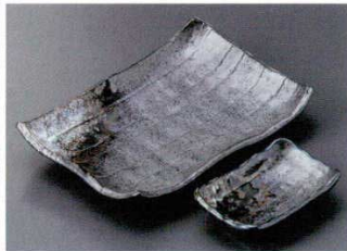
166-33-6E3 750円 2264165005 南蛮白雪淵波焼物皿 (20.5×14.5×3.5H) 166-34-6E3 380円 2264165006 南蛮白雪角千代口 (10.7×7.2×3.2H)