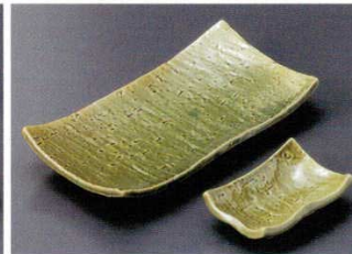
166-31-6A3 750円 1961138030 オリベ(浜付)長角焼物皿 (19×10.5×3.5H) 166-32-6A3 370円 1961138031 オリベ(浜付)長角小皿 (9×6.5×3H)