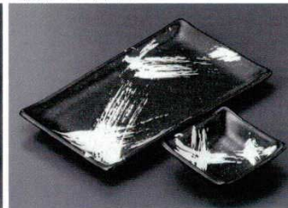
166-23-6E3 800円 2364166023 粉引黒刷毛目焼物皿 (22×13×2.2H) 166-24-6E3 320円 2364166024 黒白刷毛目角千代口 (8.8×8.8×3.5H) 200入