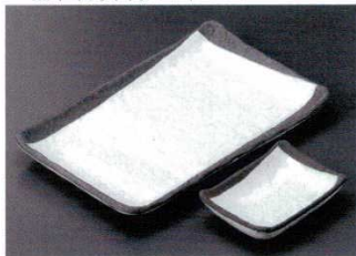
166-19-2B3 880円 2322166019 桃山(石目)7.0長角焼物皿 (20.5×13×2.2H) 80入 166-20-2B3 380円 2322166020 桃山(石目)長角小皿 (9×6.5×2.3H) 200入