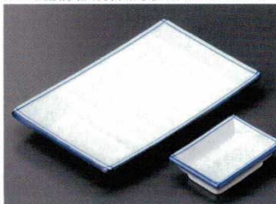
166-37-3A3 750円 1931138019 布目7.0長角皿 (20.3×12×2.2H) 166-38-3A3 270円 1931138020 布目長角小皿 (8.8×6×2.5H)