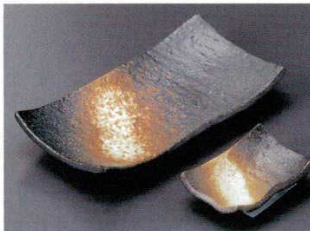
166-29-6A3 790円 2161181005 いぶし備前(浜付)長角焼物皿 (19×10.5×3.5H) 166-30-6A3 400円 2161181006 いぶし備前(浜付)長角小皿 (9×6.5×2.5H)