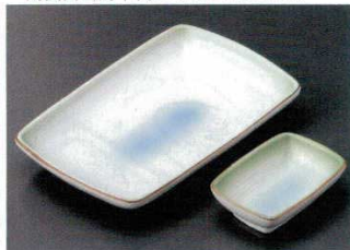
166-41-4A3 700円 2241165013 若草7.0長角皿 (19.3×12.3×2.5H) 166-42-4A3 270円 2241165014 若草長角小皿 (9×6.5×2.7H)