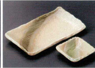
166-05-6H3 1,100円 2366166005 潤厚四角千筋利久焼物皿 (22×13×2.5H) 166-06-6H3 520円 2366166006 潤厚四角千筋利久小付 (9×9×3H)