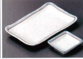
167-05-4A3 670円 2141180040 淵ゴス布目7.0長角皿 (20.2×13×2.7H) 167-06-4A3 300円 2141180041 淵ゴス布目小皿 (8.5×7.6×2.5H)