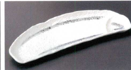
167-25-2B3 830円 2022158014 オフケ仕切付多用皿 (31.3×12×2.2H)