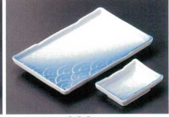
167-07-4A3 660円 1941138023 吹さざ波7.0長角皿 (19.3×12.3×2.5H) 167-08-4A3 230円 1941138025 吹さざ波長角小皿 (9×6.2×2.7H)