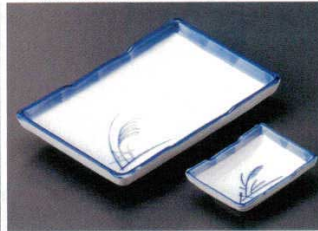
167-11-6A3 550円 2161181011 芦画5.5長角皿 (17×11×3H) 167-12-6A3 220円 2161181012 芦画長角小皿 (8×5.5×2.5H)