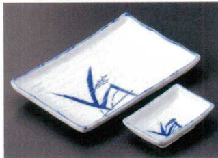
167-09-4A3 570円 1941138036 青地芦7.0長角皿 (20×13.2×3H) 167-10-4A3 230円 1941138037 青地芦長角小皿 (8.3×5.5×2.7H)