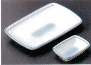
167-01-6A3 700円 1961134012 マット吹6.5長角皿 (19×12×2.5H) 167-02-6A3 240円 1961137028 マット吹長角小皿 (9×6×2.5H)