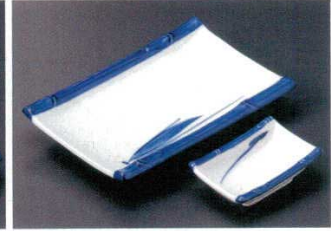
167-15-2A3 400円 1921138040 横節竹・笹6.0長角皿 (17×11.5×3.3H) 167-16-2A3 140円 1921138041 横節竹千代口皿 (8.4×5.7×2.6H)