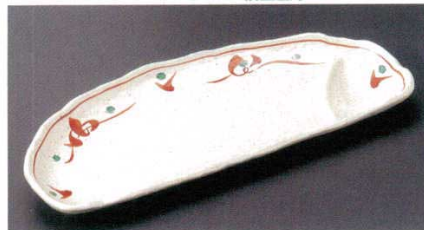
167-21-5E3 1,300円 2254166009 粉引赤絵半月仕切皿 (28×12×2.7H)