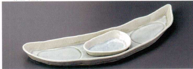
167-17-6F3 2,100円 2365167017 ビード口枝豆型多用皿 (43×11.3×2.5H) 167-18-6F3 600円 2365167018 ビード口枝豆型小皿 (12.7×8.5×2H)