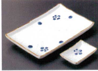
167-03-4A3 680円 1941138021 志野梅7.0長角皿 (19.8×12.9×2.7H) 167-04-4A3 280円 1941138022 志野梅長角小皿 (8.3×5.5×2.7H)