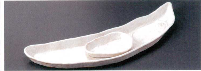
167-19-6F3 2,100円 2165181027 紅桜枝豆型皿多用皿 (43×11.3×2.5H) 167-20-6F3 600円 2165181028 紅桜枝豆型小皿多用皿 (12.7×8.5×2H)