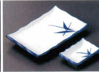
167-13-2A3 430円 1921138038 上布目芦6.0長角皿 (17.3×11.3×2.7H) 167-14-2A3 150円 1921138039 上布目芦千代口皿 (8.6×6.1×2.2H)