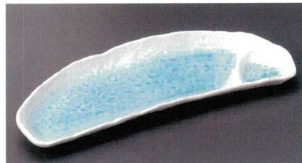
167-24-2B3 860円 2222166015 白流水仕切付多用皿 (32×12.2×2.3H)