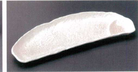
167-23-2B3 860円 2222166014 桜志野仕切付多用皿 (30.6×12×2.2H)