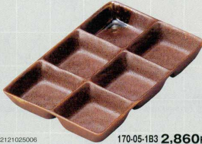
170-05-1B3 2,860円 2312170005 信楽六品仕切皿 (24.6×16.6×3.2H)