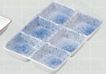
170-03-1B3 3,400円 2212168006 吹墨六品盛 (24.4×16.4×3H)