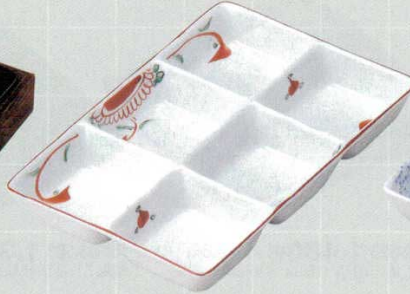
170-02-1B3 4,300円 2212168007 赤絵六品盛 (24.4×16.4×3H)