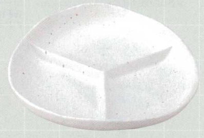
170-15-4E3 1,980円 2044171008 白釉おにぎり型三ツ切皿 (25.4×25.4×3.5H)