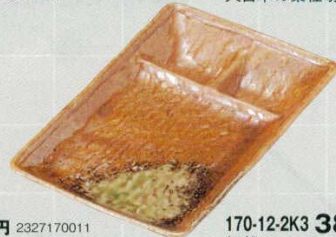
170-12-2K3 380円 2327170012 伊賀トンカツ皿 (21.2×13.5×3H)