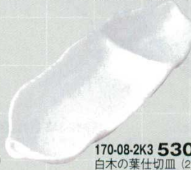
170-08-2K3 530円 2327170008 白木の葉仕切皿 (27×9.7×4H)