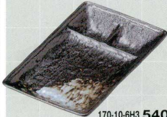
170-10-6H3 540円 2166182018 黒マット仕切皿 (21×13×3H)