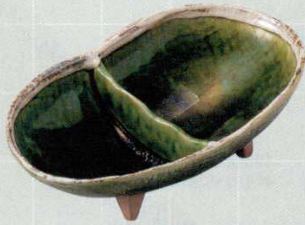
170-04-2A3 3,200円 2121025006 織部測志野仕切り鉢(大) (21.5×12.8×5.8H)