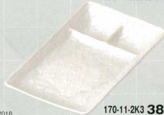
170-11-2K3 380円 2327170011 クリームトンカツ皿 (21.2×13.5×3H)