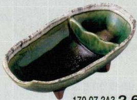
170-07-2A3 2,650円 2121027009 織部測志野仕切り鉢(中) (18.8×10×5.4H)