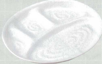
170-14-2K3 2,000円 2327170014 ランチ皿 白 (30.2×26.7×2.8H)