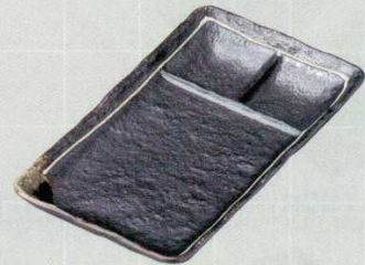
170-06-4A3 680円 2341170006 鉄釉一珍ライン串皿 (22×12×2.5H)