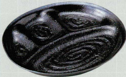
170-13-2K3 2,000円 2327170013 ランチ皿 天目 (30.2×26.7×2.8H)