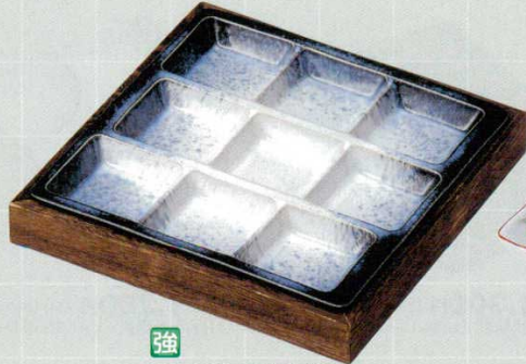
強 170-01-2A3 6,750円 2321170001 雲海九品皿(木枠付) (23×23×3.3H)

制器 高目小鉢 焼皿和皿大皿盛鉢 漆器等類 急須茶器 和陶オーブン 耐熱 萬古焼 洋食器・碗皿 中華食器 カフス・金属 茶道具 雑器 木・竹製品 神仏具