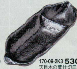
170-09-2K3 530円 2327170009 天目木の葉仕切皿 (27×9.7×4H)