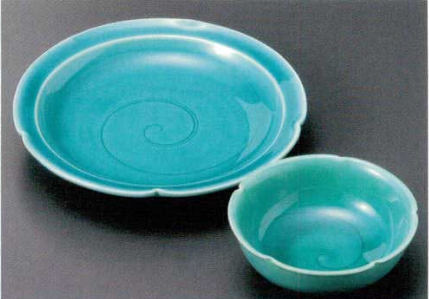
172-11-6F3 3,600円 1965146009 緑釉天皿 (20φ×3.1H) 172-12-6F3 1,350円 1965146010 緑釉呑水 (12.2φ×4.7H)