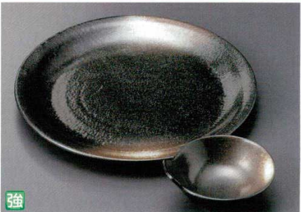
172-03-6A3 4,250円 2161184003 吹格子(石焼)7.5八角形皿 (21.5×21.5×1.5H) 172-04-6A3 1,080円 2161184004 吹格子3.3丸玉割 (10φ×4H)