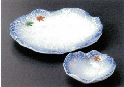
172-07-4B3 3,350円 1942146007 白吹春秋天皿 (21×16.5×4H) 172-08-4B3 1,800円 1942146008 白吹春秋呑水 (11.5×10.7×4H)