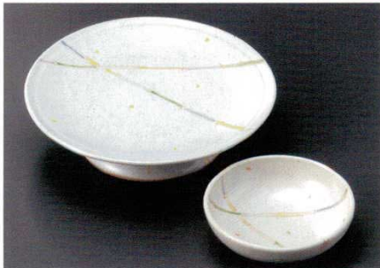
172-01-7E3 2,500円 2374172001 彩竹高台天皿 (18.3φ×4.9H) 172-02-7E3 1,280円 2374172002 彩竹玉割 (10.7φ×3.2H)