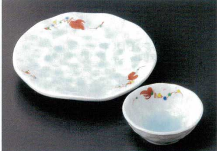
172-09-6F3 3,250円 1965147007 青白磁赤絵花天皿 (18.5φ×3.3H) 172-10-6F3 2,150円 1965147008 青白磁赤絵花呑水 (10φ×4H)