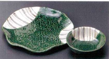
175-19-1H3 1,500円 2216174007 織部トクサ天皿 (23.5φ×2.5H) 50入 175-20-1H3 500円 2216174008 織部トクサ小鉢 (12.2φ×4.5H) 100入