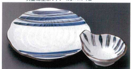
175-23-1K3 1,400円 2017165008 手描民芸古染天皿 (22φ×2.5H) 175-24-1K3 820円 2017165009 手描民芸古染香水 (11.8φ×6H)