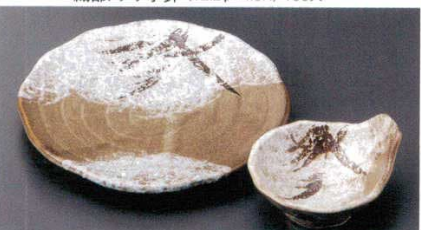
175-25-1K3 1,400円 1917151017 唐津風芦天皿 (22φ×2.6H) 175-26-1K3 680円 1917151018 唐津風芦香水 (13×11.5×4.5H)