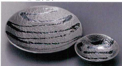
175-21-1B3 1,450円 2212174013 黒織部流し天婦羅皿 (21.9φ×3.7H) 175-22-1B3 460円 2212174014 黒織部流し香水 (12.2φ×4.2H)