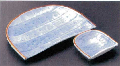
175-13-6F3 1,650円 1965150023 笹天皿 (25.5×17.5×3H) 175-14-6F3 750円 1965150024 笹小鉢 (10.5×10.5×3.7H)