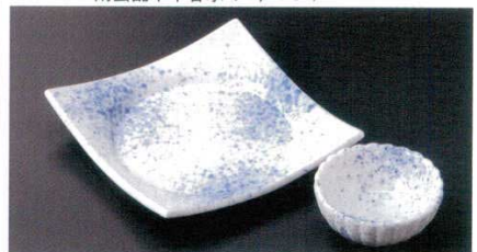
175-17-4B3 1,550円 2042165001 吹墨正角天皿 (17.5×17.5×3H) 中国 175-18-4B3 600円 2042165002 吹墨菊型とんすい (9φ×4H) 中国