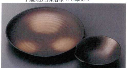
175-30-6E3 850円 2264174028 黒備前天皿 (20φ×4.2H) 175-31-6E3 350円 2264174029 黒備前香水 (13.8×13×4.8H)

陶器 焼皿和皿大皿盛鉢 酒器 茶器 急須・茶器 和陶オーブン 耐熱 裏古焼 洋食器・碗皿 中華食器 フランス・金属 茶道具 雑器 木・竹製品 神・仏具