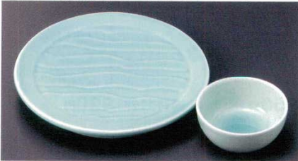
175-07-2F3 1,880円 1925150019 深海青磁波彫6.3皿 (18.8φ×2.4H) 175-08-2F3 730円 1925150020 深海青磁丸香水 (8.9φ×4H)