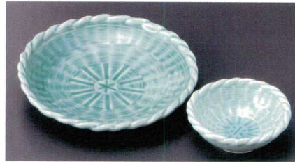
175-03-6F3 1,900円 1965150009 深海青磁ザル型7.0皿 (19.8φ×3.5H) 175-04-6F3 910円 1965150010 深海青磁ザル型香水 (11φ×4H)