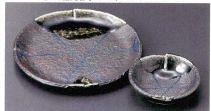
175-11-2A3 1,660円 2321175011 南蛮乱十草7.0丸皿 (22φ×2.2H) 175-12-2A3 920円 2321175012 南蛮乱十草香水 (12φ×2.8H)