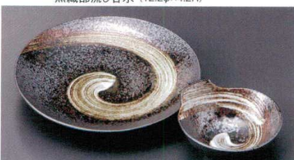
175-27-7E3 1,280円 1974151006 白刷均霽7.0皿 (22.3φ×3.4H) 175-28-7E3 830円 1974151007 白刷均霽6.0皿 (19.2φ×2.8H) 175-29-7E3 620円 1974151008 白刷均霽香水 (12.7×12×5H)