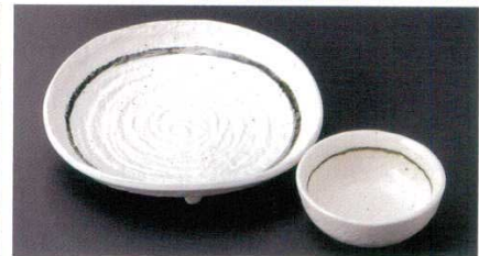
175-05-7E3 1,850円 1974149028 なごり雪三ッ足天皿 (22×21.5×4.8H) 175-06-7E3 550円 1974149029 なごり雪丸香水 (11.3φ×4.7H)