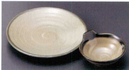
175-15-6F3 1,580円 1965150027 ニュー益子天皿 (22φ×3H) 175-16-6F3 770円 1965150028 ニュー益子香水 (13×12.5×5.2H)