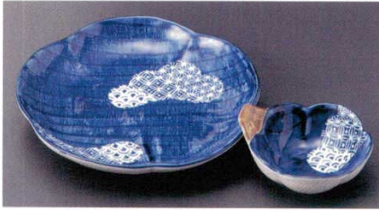
175-01-6H3 1,900円 2366175001 藍染波松葉梅型大皿 (23φ×4H) 175-02-6H3 700円 2366175002 藍染波松葉梅型とんすい (12×11.5×6H)