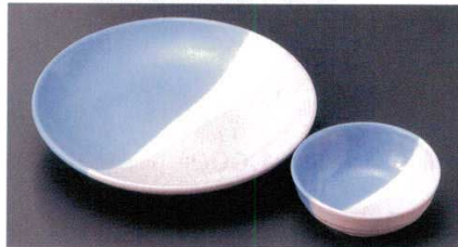
175-09-2A3 1,780円 1921150015 ゆず志野7.0丸皿 (22.8φ×3.3H) 175-10-2A3 750円 2121187022 ゆず志野丸香水 (11.6φ×4.3H)