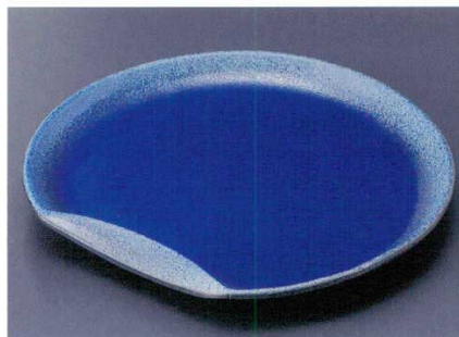
185-15-6A3 3,600円 2361185015 海碧9.0半月丸皿 (27×25.5×2.5H) 185-16-6A3 1,760円 2361185016 海碧7.0半月丸皿 (21×20×2.5H)