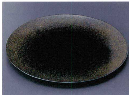
185-10-1B3 3,800円 蒔絵プレート(L) (28.5φ×2H) 2312185010 185-11-1B3 2,800円 蒔絵プレート(M) (23.5φ×1.5H) 2312185011 185-12-1B3 1,780円 蒔絵プレート(S) (18.5φ×1.5H) 2312185012