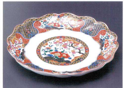
185-13-1K3 3,780円 1917225003 京友禅尺大皿 (31φ×4H)