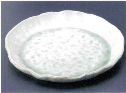
185-01-4A3 4,850円 2141257002 白雲丸盛皿 (31φ×4H)