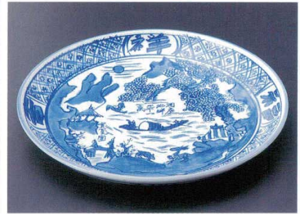
185-03-1H3 4,500円 2016221006 古染山水絵10号大皿 (32.3φ×4.5H)