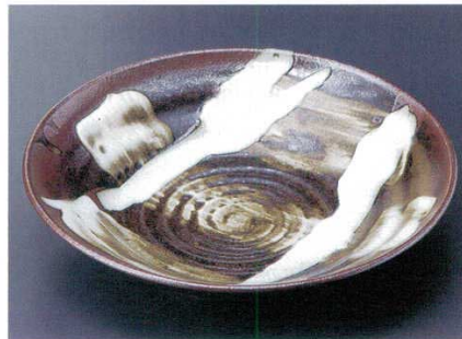
185-05-6F3 4,300円 2365185005 唐津9.0皿 (29φ×6H)