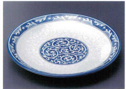
185-06-3C3 4,200円 2233182025 波唐草10.0皿 (30.5φ×4.2H)