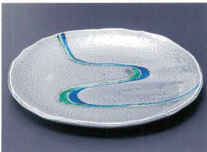
185-07-6A3 3,800円 ねずみ流水10.0丸皿 (29×26×3H) 2361185007 185-08-6A3 3,050円 ねずみ流水8.0丸皿 (24.5×22.5×3.5H) 2361185008 185-09-6A3 2,480円 ねずみ流水7.0丸皿 (22.5×20×3H) 2361185009