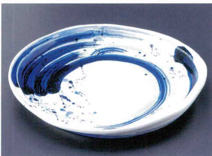
185-14-8F3 3,750円 2185259003 ゴス刷毛変形10.0皿 (31φ×4.5H)