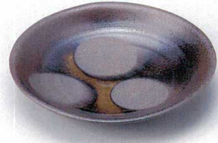
201-01-6A3 2,200円 2161219007 手造焼締6.0丸皿 (18φ×3H)

和食器 小鉢 茶碗 焼皿和皿大皿盛鉢 酒器 茶器 其茶碗 急須 和陶オトコ 耐熱 菓古短 洋食器 碗皿 中華食器 ガラス 金属 茶道具 漆器 木竹製品 神仏具