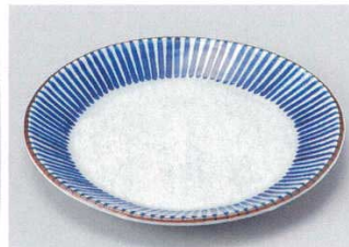
201-10-6A3 1,710円 2161210018 口錆青磁十草(布目)6.5丸皿 (19.5φ×2H) 201-11-6A3 1,270円 1961171005 口錆青磁十草(布目)5.5丸皿 (16.5φ×2H)