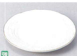
強 201-18-6A3 1,600円 2161220009 ニューボン測全ウエーブ21cm丸皿 (20.5φ×2H)