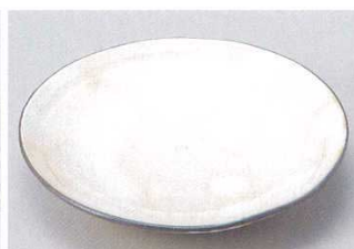
201-19-7E3 1,580円 2074191005 御本手7.0深皿 (19.5φ×3.6H)