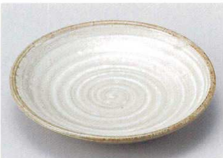
201-12-6A3 1,710円 2161222028 石焼かいらぎ6.0丸皿 (18φ×3H)