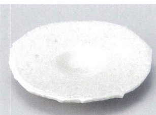
201-14-5E3 1,700円 2354201014 黄磁6.0丸くぼみ皿 (18.5φ×2.5H)