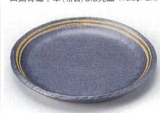
201-15-2B3 1,650円 2322201015 黒ライン丸7.0皿 (20.5φ×2.5H)30入