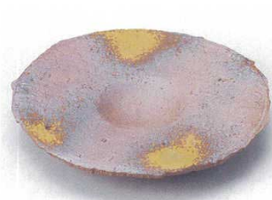
201-09-1B3 1,760円 2312201009 焼締6.0丸くぼみ皿 (18.5φ×2.5H)