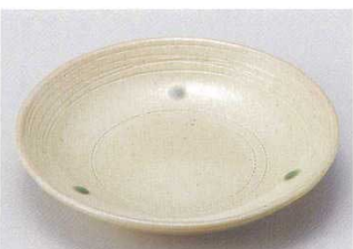
201-22-2B3 1,550円 1922159020 点線丸6.0皿 (18.7φ×3.2H)