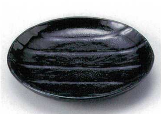
201-13-1B3 1,700円 2112220001 油滴天目ライン6.0皿 (18φ×2.8H)