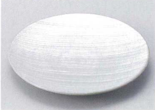
201-04-1A3 1,930円 2311201004 氷柱6.5丸皿 (21φ×2.5H)