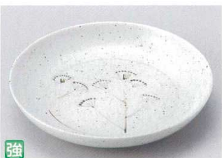
強 201-17-6A3 1,600円 2161220007 そば志野野の花6.0深丸皿 (18.5φ×3H)