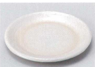
201-20-6A3 1,540円 2161212014 荒土御本手7.5丸皿 (22.5φ×2.5H) 201-21-6A3 1,270円 1961159024 荒土御本手6.5丸皿 (19.5φ×2.5H)