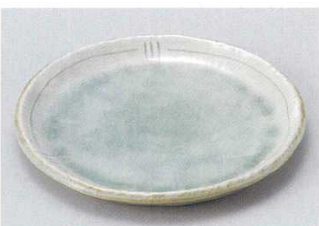
201-16-2A3 1,630円 2121219016 緑彩貴入7.0丸皿 (20.5φ×2.5H)