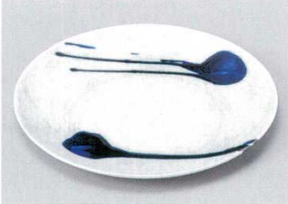
201-03-1B3 2,200円 2112219005 呉須流プレート(小) (18.4φ×1.2H)