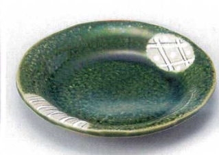
201-06-6A3 1,870円 2261519061 織部丸紋6.0深丸皿 (18φ×2.5H)