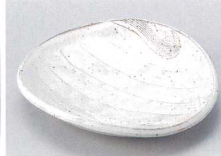
201-02-2C3 2,200円 2223203016 粉引手起し和皿 (18×17×4H)