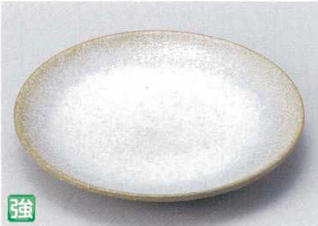
強 201-08-6A3 1,820円 2161219014 候白吹(布目)6.0丸皿(新) (18.5φ×2.5H)