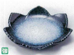
強 201-05-2A3 1,950円 2321201005 雲海葉型6.0皿 (18.2φ×3.5H)