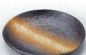
202-14-6A3 1,060円 2261205012 いぶし備前7.0丸皿 (20φ×3H)