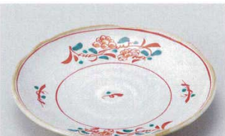
202-17-2B3 1,000円 1922161024 花万暦6.0皿 (19.2φ×2.7H) 202-18-2B3 800円 1922161025 花万暦5.0皿 (16.5φ×2.5H)