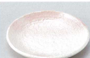
202-15-6A3 1,060円 2161221006 桜志野7.0丸皿 (20φ×3H)