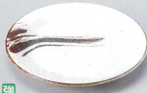
202-03-1B3 1,500円 1912164017 錆刷毛目6.0皿 (19φ×2.4H)