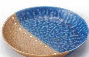
202-07-1B3 1,320円 2212205001 青イラボ6.0皿 (18.2φ×2.9H)