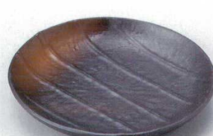
202-08-1B3 1,300円 2112223019 黒伊賀ライン6.0皿 (18φ×2.8H)