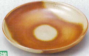
202-01-6A3 1,540円 2161223012 伊賀風6.0丸皿 (18φ×3H)

刺身・小鉢・珍味 焼皿和皿・大皿・盛鉢 酒器・器類 其・茶碗 急須・茶器 和陶・オーブン 耐熱・萬古焼 洋食器・碗皿 中華食器 カブ入・金属 茶道具 雑器 木・竹製品 神・仏具