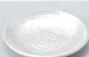
202-11-2A3 1,220円 2221205003 煌めき真珠7.0丸皿 (19.8×19.6×2.8H)