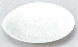
202-04-1A3 1,460円 2311202004 雲プレートM (21×19.5×2H) 202-05-1A3 1,130円 2311202005 雲プレートS (18×16.5×2H)