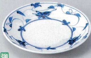
202-02-6A3 1,540円 2161220006 花唐草6.0丸皿 (19φ×2.5H)