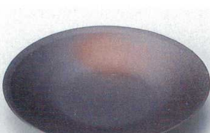
202-19-7E3 850円 2174221005 黒伊賀6.0丸皿 (19.1φ×2.7H)