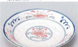
202-22-4B3 580円 2342202022 染付赤絵花7.0皿 (24φ×3.2H) 202-23-4B3 360円 2342202023 染付赤絵花6.0皿 (19.2φ×3H)