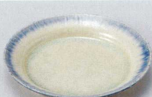
202-06-2A3 1,450円 2021191009 御深井6.0丸皿 (18.6φ×2.7H)