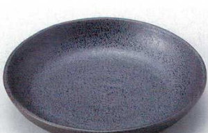
202-10-7E3 1,260円 2174220014 黒伊賀深口6.5皿 (20.4φ×3.6H)