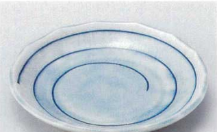
202-13-2A3 1,100円 1921161011 うず潮6.5丸皿 (20φ×3.1H)