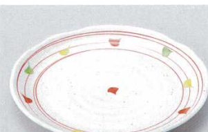
202-21-2B3 720円 2322202021 粉引赤絵千鳥7.0皿 (21.5φ×2.5H)40入