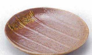
202-09-1B3 1,300円 2112223020 信楽ライン6.0皿 (18φ×2.8H)