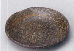
207-30-2A3 600円 2321207030 流星5.0取皿 (15.5φ×2.6H)