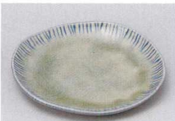
207-25-1A3 660円 1911171031 霜柱5.0皿 (15×14.3×1.5H)