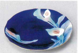
207-34-1H3 600円 2316207034 花青蘭皿 (17φ×1.5H)