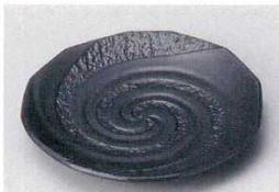
207-10-1B3 720円 2312207010 黒マット伊賀角取皿 (14.2φ×2.2H)