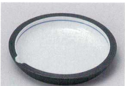
207-16-2F3 680円 2125237010 黒伊賀片口皿 (13.4φ×2.1H)