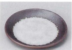
207-21-3A3 680円 1931171023 初雪5.0皿 (15φ×1.5H)