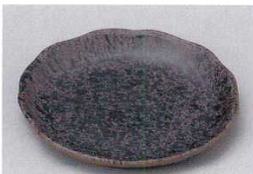
207-19-4A3 680円 2341207019 南蛮5.0丸皿 (15φ×2H)