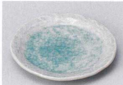
207-05-7F3 760円 2275209009 灰貫入荒石目17cm丸皿 (17.2φ×2.4H)