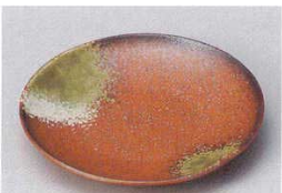
207-20-1H3 680円 2216209016 美濃の里5.0皿 (14.7φ×2H) 80入