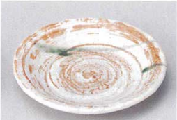
207-31-1H3 650円 2216208033 赤志野5.0皿 (16φ×2H) 80入