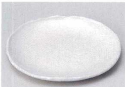
207-22-1A3 660円 1911172002 粉引5.5皿 (16.5×14.8×1.5H) 207-23-1A3 540円 1911172003 粉引4.5皿 (13.8×12.7×1.5H)