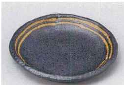
207-14-2B3 680円 2322207014 黒ライン4.0皿 (12.7φ×2H) 140入