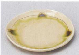
207-24-1A3 660円 2011199001 なごみ5.0皿 (15×14.3×1.5H)