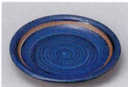
207-18-6A3 680円 1961169029 荒土ごす染5.0丸皿 (15φ×2.5H)