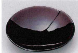
207-02-3B3 800円 2132224029 うるし釉ハス取皿 (14φ×2.5H)