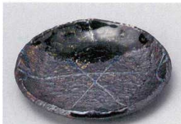
207-13-2A3 690円 2321207013 南蛮乱十草丸銘々皿 (13.3φ×1.8H)