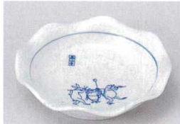
207-03-1K3 790円 2317207003 高山寺5.0皿 (15.5φ×3.8H) 207-04-1K3 660円 2317207004 高山寺4.0皿 (12.4φ×3.6H)