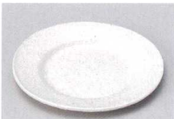
207-15-1A3 680円 2211209006 砂嵐15.3リム皿 (15.3×14.5×1.5H)