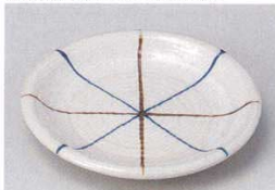
207-09-2A3 720円 2321207009 粉引十草白刷毛5.0皿(青) (15.3φ×2.4H)