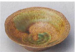
207-26-4B3 630円 2142317060 信楽ビードロ平鉢(大) (15.3φ×4.3H) 207-27-4B3 360円 2142317063 信楽ビードロ千代口 (9.6φ×3.2H)