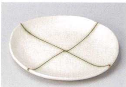
207-11-2A3 720円 2321207011 十文字5.0丸皿 (15×14.6×1.6H)