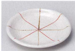
207-08-2A3 720円 2321207008 粉引十草白刷毛5.0皿(赤) (15.3φ×2.4H)