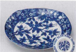
207-32-6E3 600円 2264201013 藍桃花7.0皿 (20.8φ×2.5H) 207-33-6E3 400円 2264210021 藍桃花5.0皿 (15.5φ×2.5H)