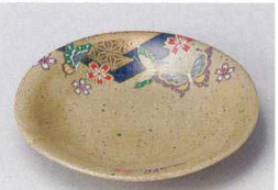
207-35-1H3 580円 2116225010 唐津友禅5.0和皿 (16.3φ×2.5H)

和食用小鉢 焼皿和皿 漆器 酒器 茶器 急須 和陶 耐熱 洋食器 中華食器 カフス 茶道具 雑器 木・竹製品 神・仏具