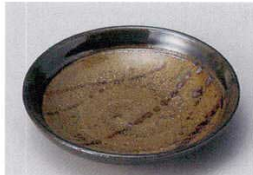
207-07-7F3 750円 2075205034 手造り織部4.0皿 (13.2φ×3H)