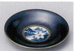
207-28-1H3 600円 2116204014 金彩山水5.0和皿 (16.5φ×2H) 207-29-1H3 480円 1916178007 金彩山水小皿 (11.8φ×2H)