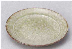
207-06-2C3 750円 2123236014 緑釉かいらぎ4.8皿 (14.7φ×2.3H)