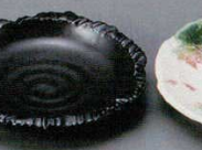
212-34-7E3 900円 2074203006 黒マット乱切取皿 (13φ×2.3H)