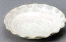
212-07-6A3 1,710円 2361212007 手造粉引刷毛目5.0波瀾丸皿 (14.5φ×3H)