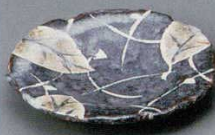
212-01-6B3 3,400円 2162232001 鼠木の葉三ツ足銘々皿 (15φ×3.2H)

和食器・碗皿 焼血和血大皿盛鉢 酒器・茶器 急須・茶器 和陶・オーブン 耐熱・蓋古焼 洋食器・碗皿 中華食器 カニス・洋風 茶道具 雑器 木竹製品 神仏具