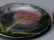
212-10-6E3 1,480円 2264274010 備前風草紋取皿フルーツ皿 (16φ×1.5H)