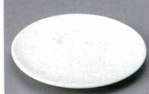
212-31-6B3 980円 2262275036 桜小皿 (13.5φ×1.8H)