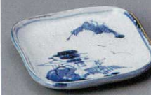
212-13-1B3 1,550円 1912174022 古染山水角銘々皿 (12.9×13.2×1.6H)