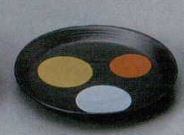
212-05-6C3 1,800円 2363212005 金銀赤彩黒4.0皿 (12φ×1.5H)