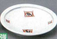
212-12-6A3 1,430円 2361212012 錆点赤格子4.5丸皿 (14.5φ×2.5H)