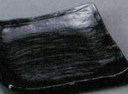
212-29-1A3 990円 2311212029 BL銘々皿 (13.1×13.1×2H)