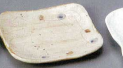
212-14-1H3 1,400円 2116233026 粉引唐草銘々皿 (13.2×13.2×2H)