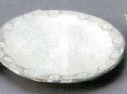
212-16-6B3 1,380円 1962174026 粉引印花角銘々皿 (13.3φ×2H)