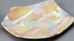
212-02-1H3 2,000円 1916174012 釉彩銘々皿 (17.6×15.5×2H)