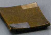
212-06-2A3 1,720円 2121233022 タタ金銀彩足付銘々皿 (11.7×11.7×2.1H)