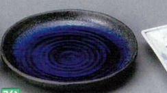
212-26-6A3 1,080円 2361212026 伊賀るり釉4.5深丸皿 (14φ×2.5H)