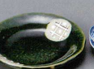
212-21-6A3 1,210円 2261519062 織部丸紋4.5深丸皿 (14φ×2H)