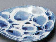
212-22-6E3 1,200円 2264276016 風船フルーツ皿 (15.5×15.1×2H)