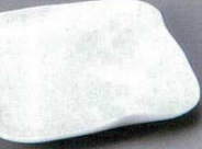
212-15-6E3 1,400円 2134230020 青白磁角皿 (14×14×1.7H)