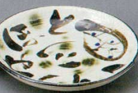
212-24-6E3 1,200円 2264274036 いろは丸5.5フルーツ皿 (15.5φ×2.8H)