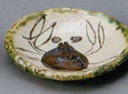
212-04-1H3 1,800円 2016205011 手作り蟹紋4.0銘々皿 (13.6φ×2.5H)