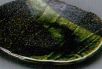
212-36-7F3 900円 2375212036 天の川フルーツ皿 (17×15.2×2H)