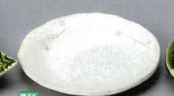
212-20-6A3 1,280円 2361212020 白唐津4.5深丸皿 (14.5φ×2.5H)