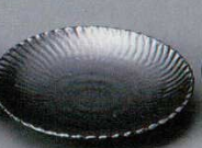
212-23-7F3 1,200円 2075205022 いぶし銀彩トチリ銘々皿 (13.5φ×2H)