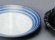
212-33-6B3 900円 1962175020 ゴス巻小皿 (14φ×2H)