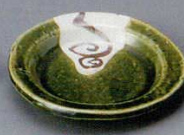
212-03-6B3 1,980円 1962174010 織部うず銘々皿 (14φ×2.1H)