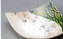
212-19-7Y3 1,300円 2378212019 瀬戸焼オリハ梅柄角小皿 (12.5×12.5×3H)