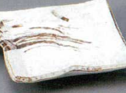
212-17-1B3 1,360円 1912174036 錆刷毛目銘々皿 (12.8×2.4)