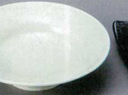
212-28-8F3 1,000円 2385212028 ヒワ釉4.8高台皿 (15φ×4H)