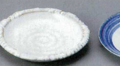
212-32-7E3 900円 2074203005 春がすみ乱切取皿 (13φ×2.3H)