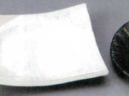
212-09-6B3 1,600円 1962174019 粉引印花角銘々皿 (12.5×12.5×2H)