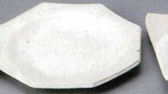
212-08-6B3 1,600円 1962167015 きなり八角取皿 (15.5φ×2.3H)