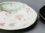
212-35-1B3 900円 1912171018 織部春秋銘々皿 (14.8φ×2H)