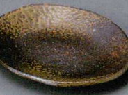
212-11-6B3 1,450円 1962174020 灰釉小判皿 (15.5×13.8×2.7H)