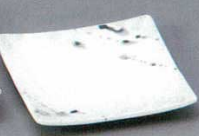
212-18-1B3 1,300円 2312212018 墨吹染四角皿 (11.5φ×1.5H)