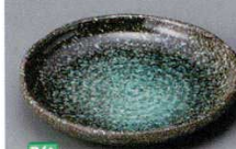
212-25-6A3 1,080円 2161234033 新緑ビードロ4.5深丸皿 (14φ×2.5H)