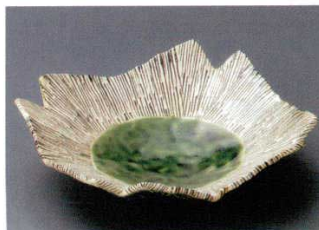
022-17-7E3 2,700円 2274023006 織部十草四切向付 (16.8×16×4.5H)