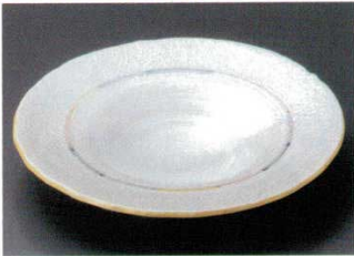
022-01-1K3 2,900円 2217024004 三色ラスター7.0向付 (21.5φ×3.5H)

刺身向付小鉢 珍味 焼酎・原酒・酎燗 酒類・燗酒 酒類・燗酒 急須・茶器 和陶・オーブン 耐熱・重台焼 洋食器・碗皿 中華食器 ガラス・金属 茶道具 雑器 木・竹製品 神・仏具