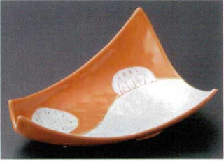
022-04-6F3 2,900円 2365022004 オレンジラスター変形鉢 (19×14×7H)