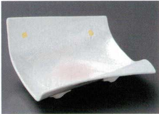
022-16-6F3 2,700円 2265025002 ピンク吹きウエーブ向付 (18.2×15.5×10H)