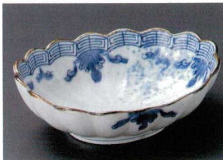
022-09-7C3 2,800円 1973026005 染付洩紋菊型向付 (15.5×11.5×5H)