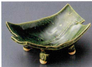
022-13-2H3 2,730円 2126499051 織部重ね四足向付 (18.5×12×7H)