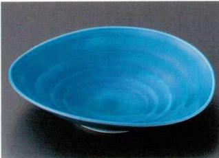
022-06-8F3 2,850円 2185028016 トルコ交趾楕円向付 (18.8×17.8×4.5H)