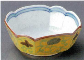
022-15-7C3 2,700円 1973026006 三彩八角向付 (12φ×5.2H)