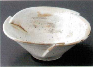
022-02-1K3 2,900円 2217024008 粉引|5.6櫛目切合わせ反向付 (17φ×6.5H)