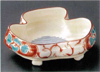
022-08-7E3 2,800円 2374022008 内十草三ツ葉向付 (15×13×5H)