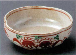
022-07-6E3 2,800円 2264008015 手描き花鳥刺身鉢 (15φ×5.5H)