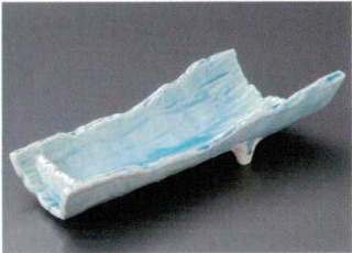
022-12-2F3 2,400円 2325022012 マリブルー竹割型向付 (30.5×12.5×7.5H)