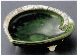
022-20-7E3 2,700円 2274024014 織部十草アワビ向付 (16×13.2×5.5H)