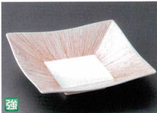
022-05-6E3 2,880円 2364022005 千本十草赤高台6.0皿 (17.8×17.8×4.5H)