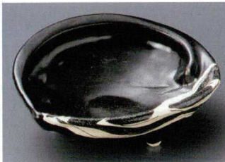
022-14-6F3 2,700円 2265024010 黒織部あわび向付 (16×13.3×5.5H)