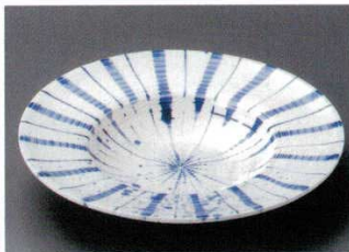
022-18-7C3 2,700円 2273024006 クシ目呉須放射6寸浅鉢 (20φ×3.3H)