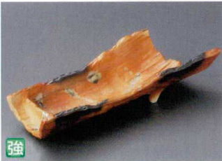
022-11-8F3 2,750円 2385022011 焼締竹割向付 (30.5×12.5×7.5H)