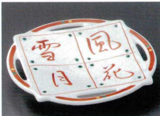
022-19-6F3 2,700円 1965025015 雪月風花透し高台皿 (19×17.5×3H)