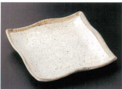
237-10-4E3 1,550円 1944205007 白唐津9.0正角皿 (23.5×23.5×4.2H) 237-11-4E3 830円 2244225006 白唐津7.0正角皿 (18×18×3.5H)