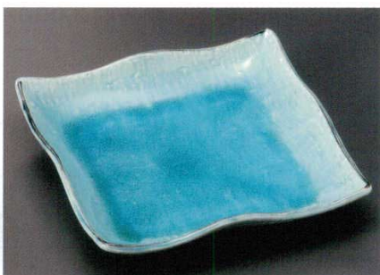
237-12-8F3 1,450円 1985205012 スカイブルー正角皿(大) (24×24) 237-13-8F3 770円 1985205013 スカイブルー正角皿(小) (18.5×18.5)