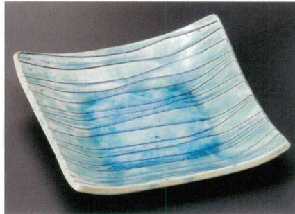
237-02-7F3 3,000円 2175194006 湖水盛皿 (23.5φ×5.5H)