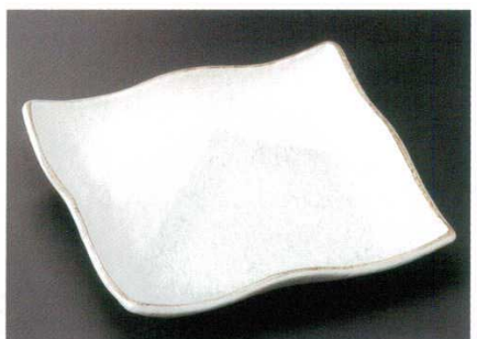
237-14-8F3 1,450円 2085169015 白マット水晶正角皿(大) (24×24) 237-15-8F3 770円 2085169016 白マット水晶正角皿(小) (18.5×18.5)

和食器 焼皿和皿大皿盛鉢 酒器茶器 丼茶碗 急須茶器 和陶オーブン 耐熱 漆古焼 洋食器 碗皿 中華食器 ガラス 漆器 茶道具 雑器 木竹製品 神仏具