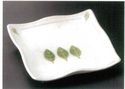
237-03-1H3 2,500円 2316237003 織部木の葉角盛皿 (23.5×23×4.8H)