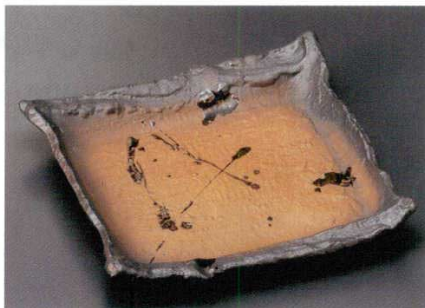
237-08-6F3 2,200円 2265224011 焼締四角皿 (22×22×4H)