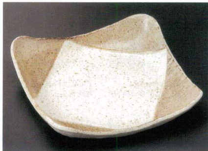
237-05-4E3 1,680円 2044179006 マス入白唐津9.0正角皿 (23.3×23.3×5.2H)