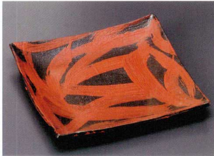
237-01-7C3 3,500円 2273223002 炭化土根来布目正角8寸皿 (23.5×23.5×3.5H)