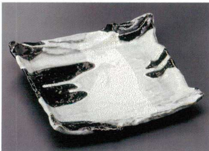
237-07-2F3 2,500円 2225223016 カイラギ正角変型皿 (22×22×4.3H)