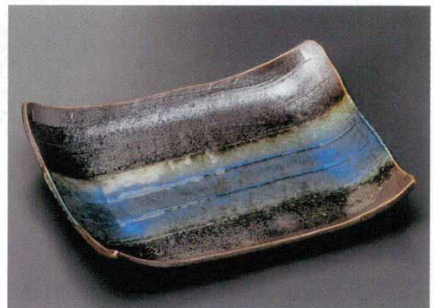
237-06-8F3 1,480円 2285221015 黒青吹きそぎ長角盛皿 (26×21×3H)