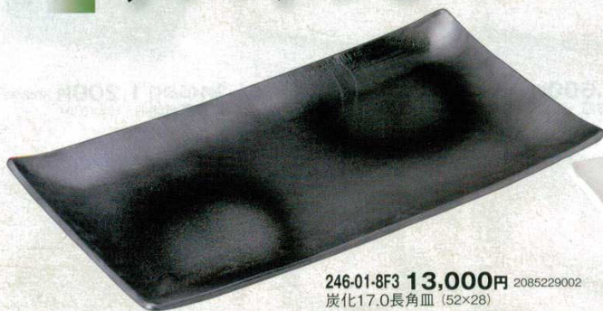
246-01-8F3 13,000円 2085229002 炭化17.0長角皿 (52×28)