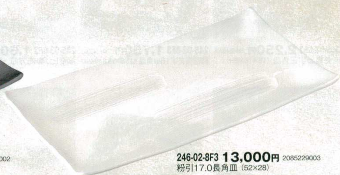
246-02-8F3 13,000円 2085229003 粉引17.0長角皿 (52×28)