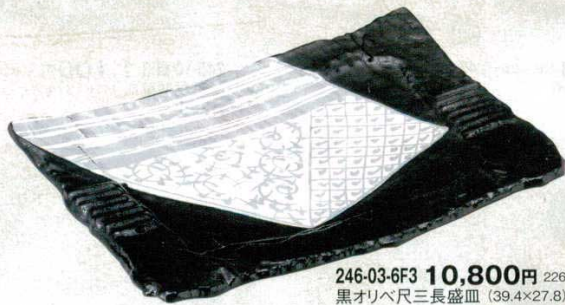
246-03-6F3 10,800円 2265231002 黒オリベ尺三長盛皿 (39.4×27.8)