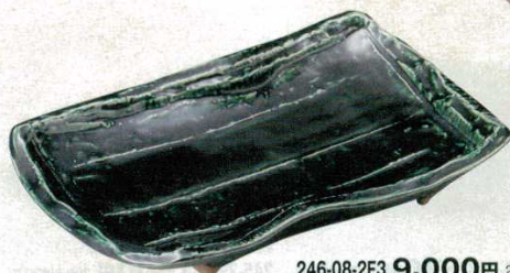
246-08-2F3 9,000円 2125267012 織部12.0盛込皿 (35.5×22.5×5.5H)