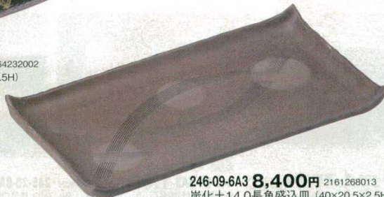
246-09-6A3 8,400円 2161268013 炭化土14.0長角盛込皿 (40×20.5×2.5H)