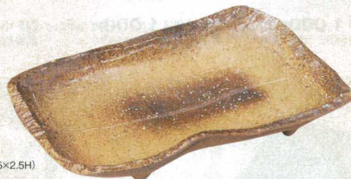
246-06-6F3 9,600円 1965198009 備前風12.0皿 (36×22.5×5.5H)