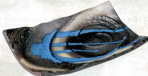
246-04-1H3 10,000円 2016238002 うず潮12号大盛皿 (35.4×24.3×6.5H)