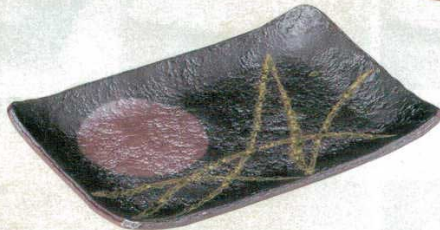
246-07-6E3 9,500円 2264232002 備前風12.0大皿 (31.5×21×3.5H)