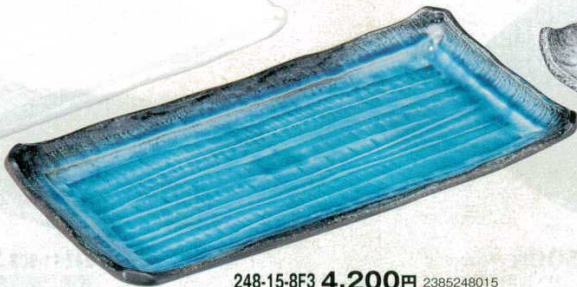
248-15-8F3 4,200円 2385248015 黒流しブルー43cm長角皿 (42.8×21.6×3.5H)