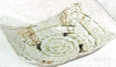
248-12-2C3 3,800円 2323248012 ビードロ四方上り皿(大) (31.5×23×7.5H)