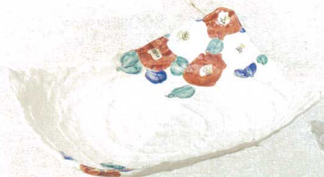
248-11-2C3 5,400円 2323248011 赤絵山茶花四方上り皿(大) (31.5×23×7.5H)