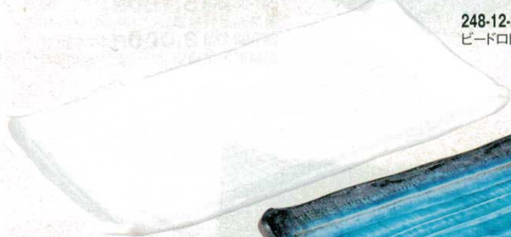
248-14-8F3 4,200円 2385248014 白マット43cm長角皿 (42.8×21.6×3.5H)