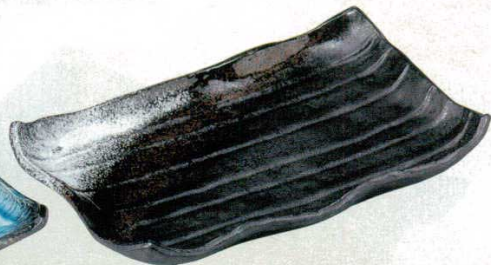
248-16-6E3 3,500円 2264233011 南蛮白雪長角大皿 (34.5×22×5.5H)