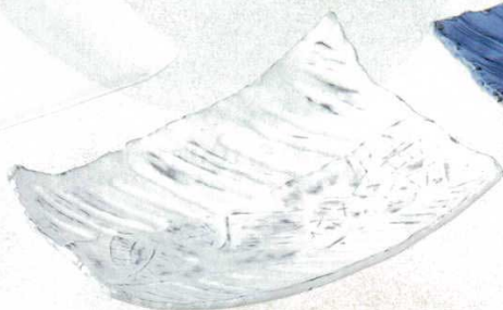
248-10-6A3 4,850円 2161277001 ごすクシメ12.0長皿 (37×21.5×3H)