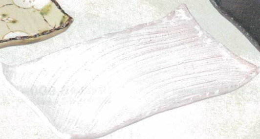
248-02-2B3 6,000円 2322248002 紅粉引枯山水角皿(大) (37×24.5×4H) 20入 248-03-2B3 4,600円 2322248003 紅粉引枯山水角皿(中) (31×21×4H) 30入 248-04-2B3 2,800円 2322248004 紅粉引枯山水角皿(小) (26×17.5×3.5H) 40入