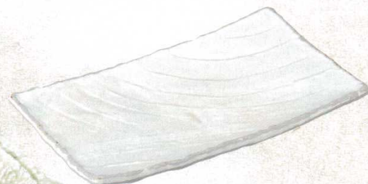
248-13-2F3 4,250円 2025238010 御本手クシ目長角12.0皿 (37.5×21.5×4.5H)