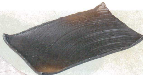
248-05-2B3 6,000円 2322248005 備前吹枯山水角皿(大) (37×24.5×4H) 20入 248-06-2B3 4,600円 2322248006 備前吹枯山水角皿(中) (31×21×4H) 30入 248-07-2B3 2,800円 2322248007 備前吹枯山水角皿(小) (26×17.5×3.5H) 40入