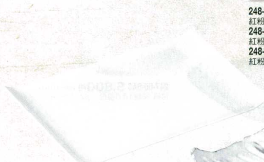
248-08-6H3 5,800円 2366248008 特白磁36cmプレート (36×24.7×2.4H)