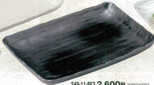
249-11-8F3 2,600円 2085240003 炭化11.0長角皿 (36×24.6×3.8H)