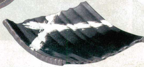
249-03-8F3 4,400円 2385249003 白釉黒刷毛かわら盛皿 (28.2×27.8×5.6H)