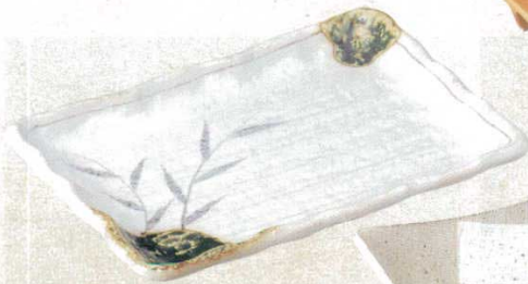
249-07-4A3 3,350円 1941200004 志野織部芦10.0長角皿 (30.5×21×2.8H)