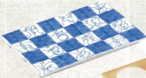
249-04-8F3 4,400円 2385249004 染付文字入市松ゲタ皿(大) (31×20×3H)