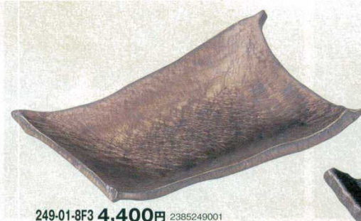
249-01-8F3 4,400円 2385249001 金結晶ちぎり盛込皿 (35×22.5×4H)