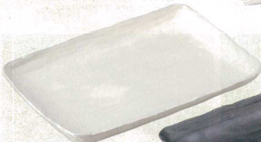
249-10-8F3 2,600円 2185275002 粉引11.0長角皿 (36×24.6×3.8H)