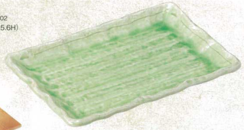
249-06-4A3 3,450円 2041239012 ヒワ粉引10.0長角皿 (30.5×21×2.8H)