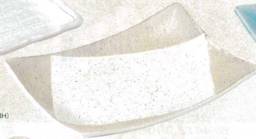
249-08-4E3 3,150円 2144278005 白唐津マス入尺角長皿 (32.8×23.5×4.8H)