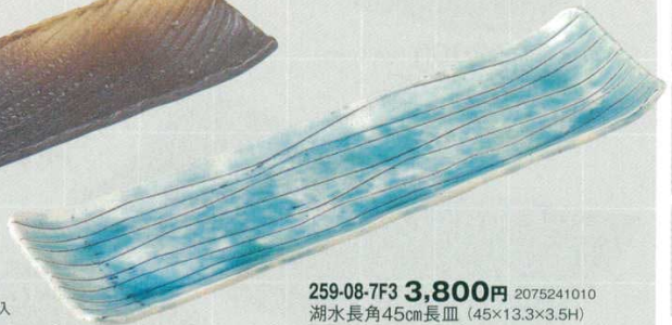
259-08-7F3 3,800円 2075241010 湖水長角45cm長皿 (45×13.3×3.5H)