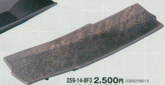
259-14-8F3 2,500円 2385259014 金結晶木目13.0長角皿 (39.3×13×3H)

和食器・洋食器 焼皿和皿大皿盛皿 酒器・茶器 丼・茶碗 急須・茶器 和陶・オーブン 耐熱・高古焼 洋食器・碗皿 中華食器 ガラス・金属 茶道具 雑器 木・竹製品 神・仏具