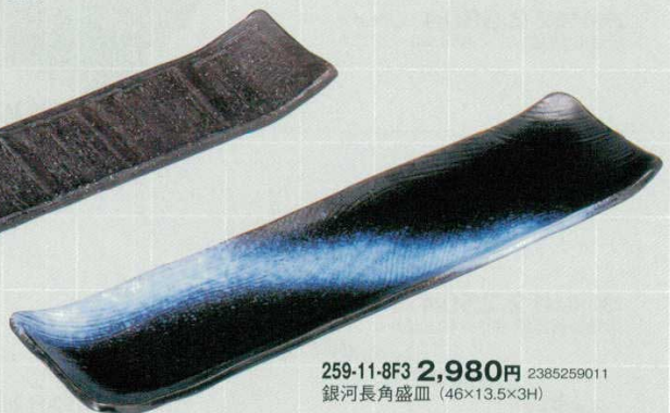
259-11-8F3 2,980円 2385259011 銀河長角盛皿 (46×13.5×3H)