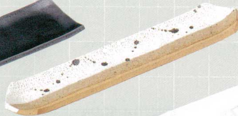
259-02-6F3 3,900円 2265241007 かいらぎ錆散し六角長皿 (39.5×9)