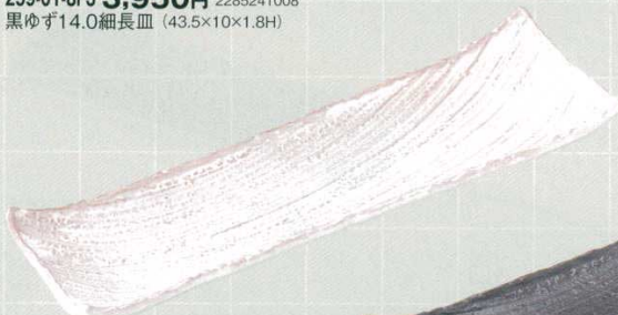
259-04-2B3 3,800円 2322259004 紅粉引枯山水長角皿(大) (41×13×4H) 30入 259-05-2B3 2,500円 2322259005 紅粉引枯山水長角皿(中) (31×12.5×3H) 30入