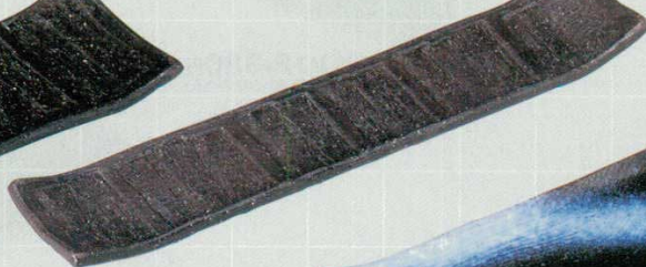
259-10-7E3 3,200円 2374259010 渋袖前菜長皿 (45×10×2H)