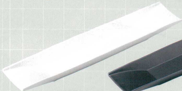
259-12-7C3 3,300円 2073241011 白釉両上り47cmプレート (46.5×10.5×3.5H)