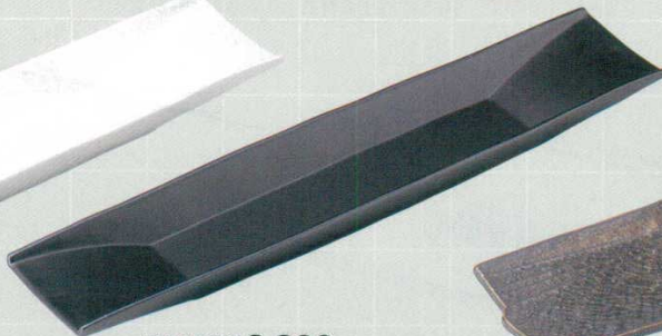
259-13-7C3 3,300円 2173271017 黒マット両上り47cmプレート (46.5×10.5×3.5H)