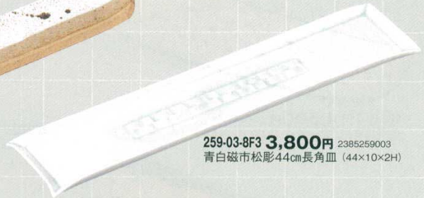
259-03-8F3 3,800円 2385259003 青白磁市松彫44cm長角皿 (44×10×2H)