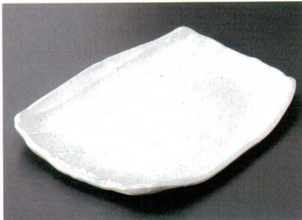
274-04-3C3 4,700円 2233215005 白釉ソギ長角大皿 (36.7×29×5.3H)