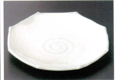
274-09-8F3 4,250円 2185258002 黄磁八角11.0皿 (33×31.5×4.5H) 274-10-8F3 2,250円 2185258003 黄磁八角9.0皿 (27×25.5×3H)