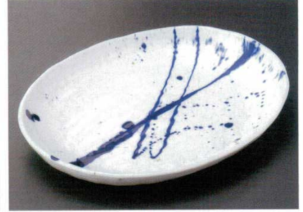
274-06-6F3 5,000円 2265250005 ゴス吹き楕圓大皿 (37×29×5H)