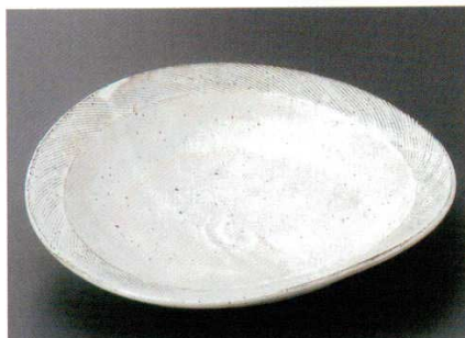
274-07-2C3 4,500円 1923195014 粉引くし目楕圓盛皿 (27.5×26×6.3H)