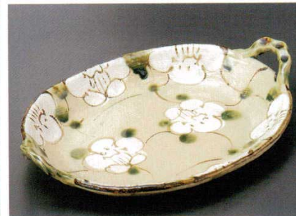
274-14-2F3 4,150円 2025233008 格子花楕圓両手11.0皿 (36×25×6.3H)