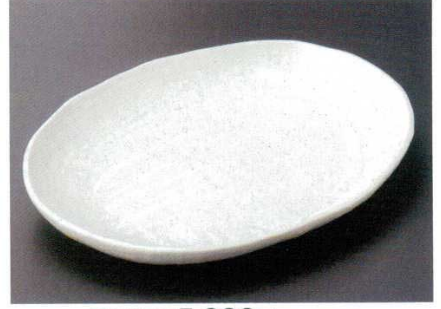
274-03-7F3 5,000円 1975195006 粉引楕圓特大皿 (36×28×4.8H)