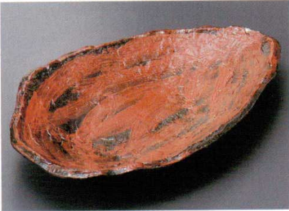
274-01-6F3 5,100円 2265250010 根来変型尺2皿 (36.5×24×5.5H)

和洋両用 小判鉢 楕圓和皿大皿盛鉢 酒器 茶器 洋食器 井茶碗 急須 茶器 和陶 オープン 耐熱 美古焼 洋食器 楕圓 中華食器 カラス 金属 茶道具 雜器 木竹製品 神・仏具