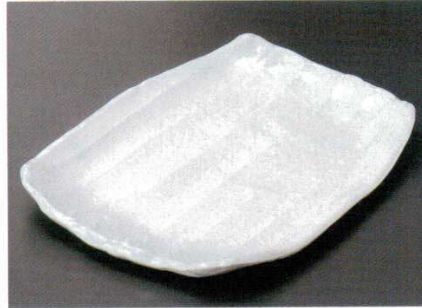
274-05-2C3 4,700円 223251004 青白磁大皿 (37×29×3H)