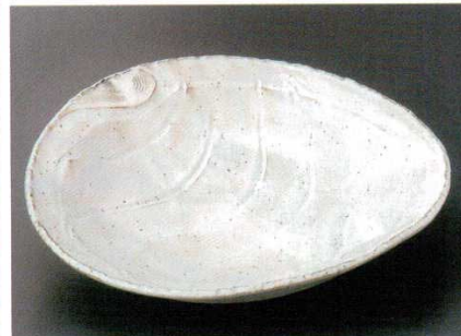
274-08-2C3 4,500円 2223251006 粉引手起し盛皿 (28×26×6.5H)