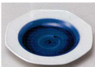
282-19-1K3 1,680円 2017185001 中コス7.0八角皿 (22.2φ×3H)