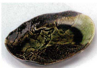
282-21-7F3 1,600円 2375282021 天の川パーティ皿 (25×18.2×3.5H)