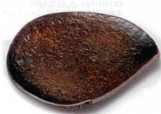
282-08-4A3 2,150円 2041180013 備前変型半月皿 (21×18.5×2.6H)