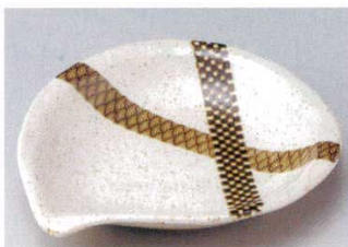
282-13-4B3 1,900円 2342282013 銀彩白変型片口大皿 (23×20×3.3H)