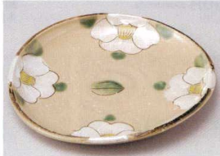
282-06-3B3 2,200円 2132211017 織部椿たわみ大皿 (23×22×2.3H)