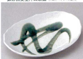
282-18-2F3 1,850円 1925207008 白マット織部散し大皿 (27×20.4×5H)