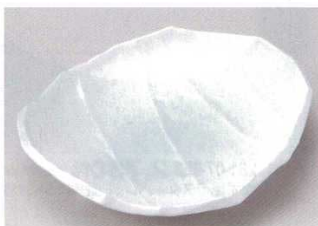
282-17-2C3 1,600円 2323282017 青磁三ツ足6.0皿 (22.5×19×5.5H)