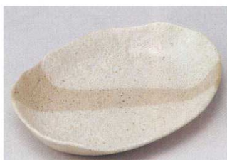
282-20-7F3 1,600円 2375282020 リプルパーティ皿 (25×18.5×3.7H)