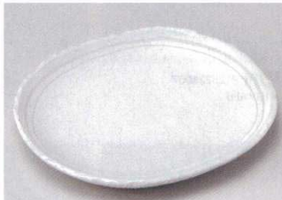
282-10-4A3 2,100円 2041180021 手彫ライン楕円皿 (22.8×20.8×2.7H)