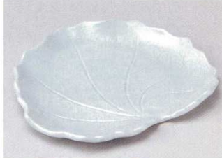
282-04-8F3 1,600円 2285265015 青磁つわぶき23cm中皿 (23×20×2H)