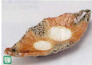
282-07-8F3 2,200円 2285259009 ビードロ葉型皿 (29.5×12.7×5H)