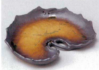
282-01-6F3 2,800円 2365282001 焼締つわぶき皿 (23.5×20×3H)

刺身・寿司・小鉢・珍味 焼皿・和皿・大皿・盛鉢 酒器・茶器 丼・茶碗 急須・茶壺 和陶・伊万里 耐熱・萬古焼 洋食器・碗皿 中華食器 ガラス・金属 茶道具 雑器 木竹製品 神仏具