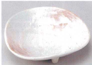
282-11-1K3 1,870円 2317282011 桜志野三つ足鉢 (21.5φ×5.5H)