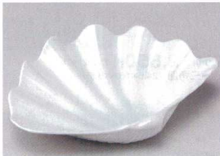
282-09-8F3 2,100円 2385282009 青白磁シェル8.5皿 (26.5×20×4.5H)