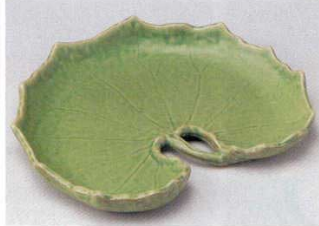
282-03-8F3 1,680円 2385282003 つわぶき8.0皿 (23.3×20×3H)