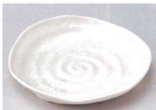
282-16-1B3 1,800円 1912165018 粉引クリーム麺皿 (21.4×20.6×3.8H)