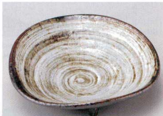
282-12-1K3 1,870円 2317282012 白刷毛均窯三つ足鉢 (21.5φ×5.5H)