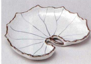
282-02-2F3 2,250円 2025182023 かいらぎイチョウ皿 (大) (22.5×19×2.8H)