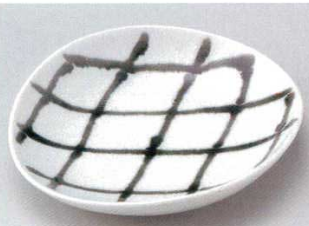
284-13-7C3 2,400円 1973027009 白粧釉織部格子小判皿 (20×17.5×4.5H)