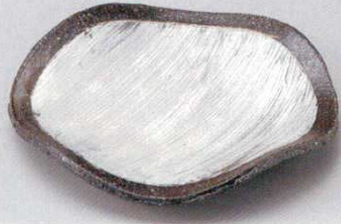
284-02-2F3 4,800円 2225264003 黒刷毛目変形楕円向付 (20×18.3×4H)