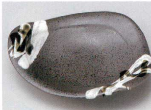
284-19-7E3 2,250円 2274266018 [軽量]黒釉乱線変型6.5皿 (20×18.3×4.2H)