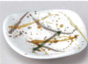
284-18-7E3 2,250円 2274266017 [軽量]夢幻変型6.5皿 (20×18.3×4.2H)