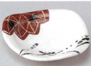
284-17-7Y3 2,000円 2378284017 美濃焼朱巻鉄とび変形皿 (20×18×4H) 1入