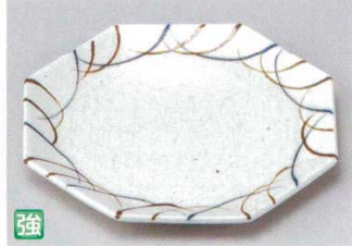
284-07-6A3 2,700円 2161214009 鉄錆線抜(石焼)6.0八角形皿 (18×18×2H)