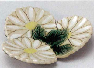
284-09-5E3 2,700円 1954157007 三重菊盛皿 (18.8×15×3.7H)