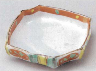
284-06-2F3 3,550円 1925023017 十草赤丸紋六角鉢 (20.3×18×4.5H)