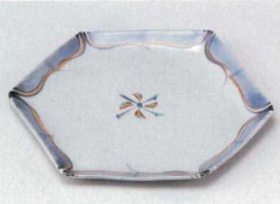
284-05-1K3 3,700円 1917170008 小染風車六角皿 (18.3φ×1H)