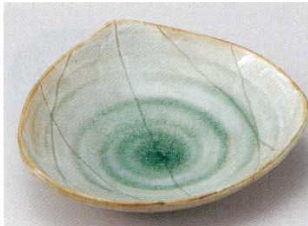
284-15-2A3 2,260円 2221264019 手堀ライン変形鉢 (20×18×5H)