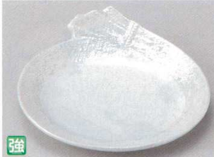
284-10-2A3 2,550円 2221155014 青白櫛目蛤型焼物皿 (23×17.2×2.9H)