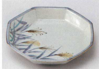
284-12-1B3 2,400円 1912167011 赤土すすぎ八角深皿 (18.5×3.1H)