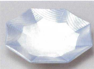
284-14-6A3 2,370円 2261267001 コバルト吹銀彩波彫 八角7.0皿 (21×19.5×3.5H)