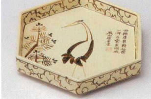
284-03-7C3 3,800円 2273266004 乾山鶴六角6寸皿 (20×17.5×3H)