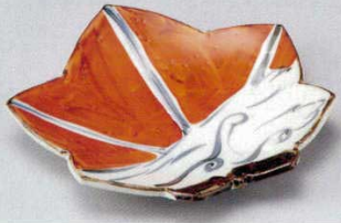
284-01-6F3 6,800円 2265264001 色絵もみじ皿 (20×18.5×3H)