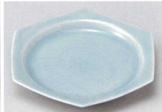
284-20-6F3 2,080円 1965158006 青海波六角6.0和皿 (17.8φ×19.7H)