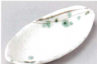
285-15-7F3 1,450円 2175169007 もえぎトレイ (22.3×11.3×3.2H)