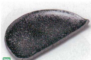
285-19-1A3 1,330円 2311285019 黒藤7.0半月皿 (21.4×12.7×1.9H)