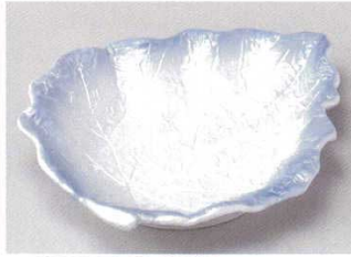
285-02-8F3 2,000円 2285267011 ブルー和紙葉型皿 (21×18×3.5H)