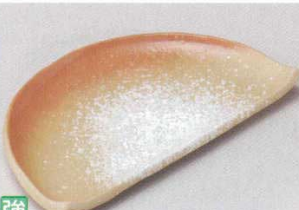
285-16-2A3 1,400円 2321285016 雪どけ7.0半月皿 (21×12.8×2H)