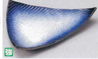
285-04-6A3 1,980円 2161166017 測るり内白吹(波彫)三角皿 (23.5×17×4H)