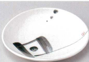
285-11-1A3 1,640円 2111219021 墨彩たまご皿(大) (20.9×20×3.1H)