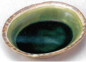
285-07-2A3 1,880円 2221267007 織部測志野多用深皿 (18×15.5×3H)