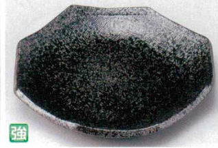
285-08-6A3 1,820円 2161228029 南蛮黒ちらし6.0八角皿 (19φ×2.5H)