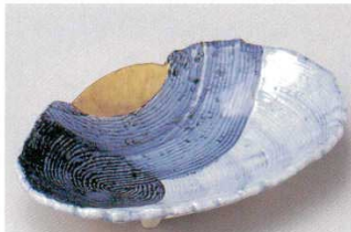
285-10-6E3 1,650円 2264267014 呉須櫛目6.5小判皿 (19×12.5×3.4H)