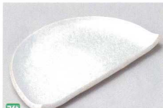
285-21-1A3 1,220円 2211158023 白山7.0半月皿 (21.4×12.7×1.9H)

和食器 洋食器 茶道具 和陶オーブン 耐熱 薬古焼 洋食器 碗皿 中華食器 ガラス 金属 茶道具 箱器 木竹製品 神仏具