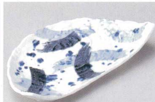
285-13-2F3 1,450円 1925159009 呉須散し半月7.5皿 (22.5×12.8×5H)