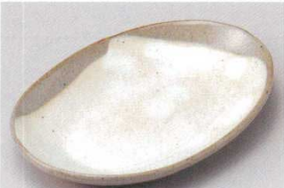
285-14-6B3 1,500円 1962142016 粉引取皿 (18×12×2H)