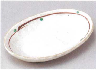
285-05-6B3 1,950円 1962142010 赤絵取皿 (18.7×13×2.7H)