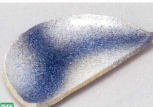
285-20-1A3 1,280円 1911133001 青蛭7.0半月皿 (21.4×12.7×1.9H)