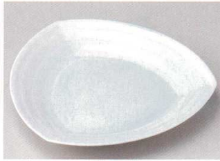
285-06-1A3 1,910円 2311285006 蒼三角皿 (20.7×20.7×2.3H)