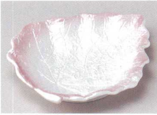
285-01-8F3 2,000円 2285267010 ピンク和紙葉型皿 (21×18×3.5H)