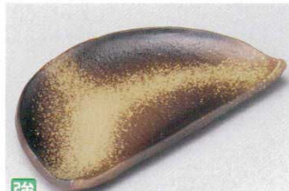
285-17-1A3 1,330円 2211158022 多聞7.0半月皿 (21.4×12.7×1.9H)