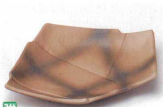
285-18-6A3 1,320円 2261158016 南蛮黒格子7.0結形皿 (21×15.5×3H)