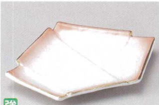
285-09-2A3 1,780円 2321285009 測金ピンク吹結び皿 (19×13.3×2.3H)