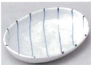
286-09-2B3 1,150円 2322286009 ストライプ小判型6.0多用鉢 (18.8×14×3.5H) 60入