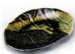
286-14-7F3 900円 2375286014 天の川パン皿 (19.2×14×1.8H)