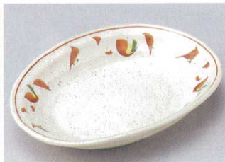
286-11-5E3 1,000円 2254268007 無鉛赤絵うず巻長皿(小) (20×14.5×3.9H)