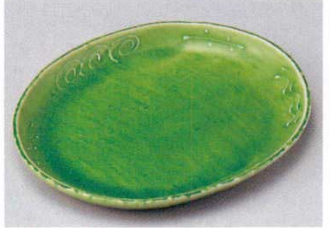
286-04-2A3 1,280円 1921160017 もえぎ7.0小判多用皿 (22×18.6×1.8H)