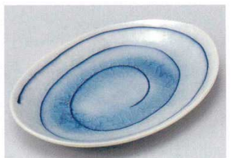
286-16-2A3 830円 1921144005 うず潮6.5小判フルーツ皿 (20.7×14.4×2.7H)