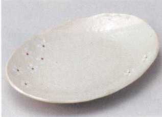
286-02-2B3 1,380円 2322286002 白押花楕円取皿 (20.7×14.8×3.5H) 60入