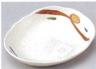
286-10-1K3 1,060円 2117229015 手描赤絵6.0楕円皿 (15×18.2×3.5H)