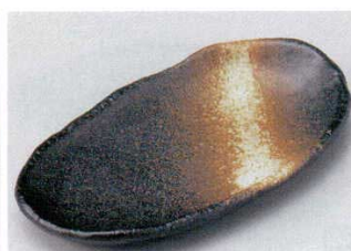
286-19-6A3 790円 2261269008 いぶし備前 手造風万能皿 (21×11.5×2.5H)