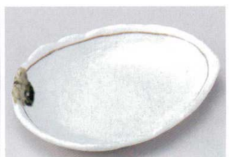
286-20-3A3 770円 2331286020 志野茶ライン7.0菱型皿 (20.4×16.3×2.7H)