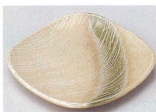
286-18-6H3 800円 2366286018 淵厚四角千筋利久銘々皿 (15.8×15.5×2H)