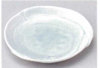
286-08-6F3 1,200円 1965161010 青白磁重ね彫6.0皿 (18φ×3.2H)