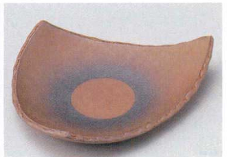
286-12-8F3 990円 2185229013 焼締丸紋三角皿 (20×16.5)