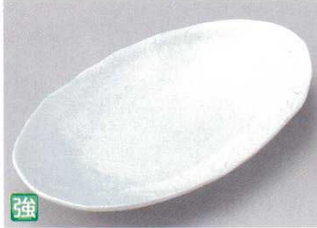
286-03-7C3 1,300円 1973174034 青白磁楕円皿 (18×11×2H)