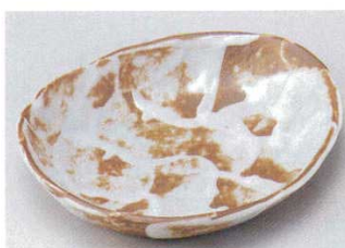
286-13-1K3 950円 2017188015 南蛮志野6.0皿 (18.6×15.5×3.5H)