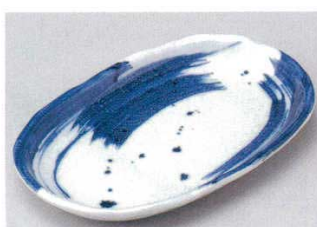
286-17-7E3 800円 2274523015 [軽量] 呉須刷毛玉玉淵6.5小判皿 (18.6×11.6×2.2H)