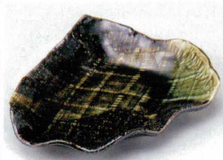
286-07-7F3 1,250円 2375286007 天の川三角タタラ皿 (20.7×17×3.5H)