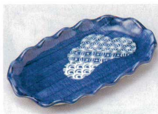
286-15-6H3 850円 2366286015 藍染波松葉フリル焼物皿 (21×12.5×2H)