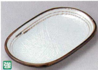
286-05-1K3 1,260円 2117189020 ライングレープ6.0小判皿 (12.2×19×2.3H)