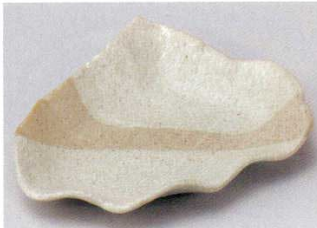
286-06-7F3 1,250円 2375286006 リプル三角タタラ皿 (20.7×17×3.5H)