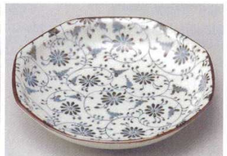
287-16-5E3 400円 2254269022 古染花八角6.0皿 (18.4φ×3.5H)