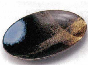
287-13-6H3 630円 2166170020 羽衣たわみ6.5楕円皿 (20×14.2×2.7H)