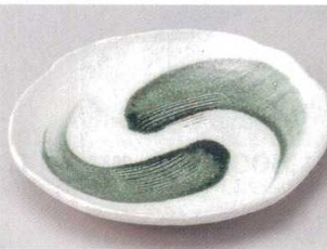
287-07-2C3 720円 1923167027 織部風車和皿 (18×17×3H)