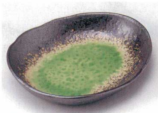
287-10-7E3 720円 2074035009 ヒワ吹楕円多用皿(小) (18.2×15×3.5H)