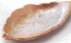
287-03-5E3 750円 2054150005 単志野木ノ葉22cm長皿 (22×12.2×3.2H)