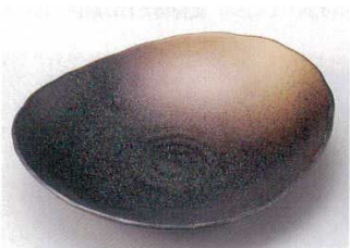
287-19-8F3 480円 2385287019 金茶吹き楕円皿(大) (19.5×15×4H) 287-20-8F3 320円 2385287020 金茶吹き楕円皿(小) (13.5×12×3H)