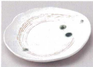
287-06-2C3 720円 1923167028 クシ目和皿 (18×17×3H)