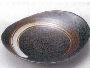
287-21-8F3 480円 2085201009 ハケ天目楕円皿(大) (17.5×15×3.8H) 287-22-8F3 320円 2085201010 ハケ天目楕円皿(小) (13.3×12×3.2H)