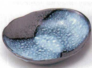
287-17-2K3 680円 2027200023 清流6.0ダ円皿 (18.2×15×3.3H) 287-18-2K3 500円 2027200024 清流4.5ダ円小皿 (14×11.5×2.5H)