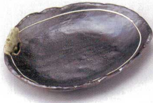
287-01-4A3 800円 2341287001 鉄釉一珍ライン7.0変形皿 (20.3×16×3.3H)