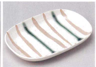
287-08-2B3 700円 2222271002 流れ十草楕円小判皿 (18.5×12.6×2.3H)