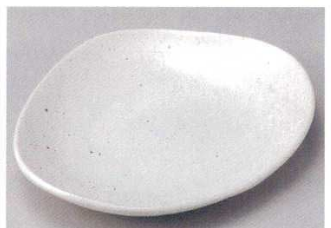
287-23-2C3 760円 2223268019 白釉マロン和皿 (20×17×3H) 287-24-2C3 500円 2223268020 白釉マロン銘々皿 (18×15×2H) 287-25-2C3 400円 2223268021 白釉マロン小皿 (15×12×3H)

和食向小鉢 焼皿和皿大皿盛鉢 酒器茶器 丼茶碗 急須・茶器 和陶オーブン 耐熱 華古焼 洋食器 碗皿 中華食器 ガラス・金属 茶道具 雑器 木竹製品 神仏具