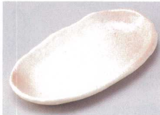
287-05-6A3 790円 2261269013 桜志野 手造風万能皿 (21×11.5×2.5H)