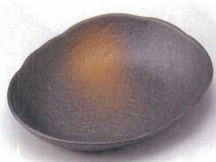
287-09-7E3 700円 2174229028 黒伊賀楕円プレート小皿 (18.5×15×3.5H)