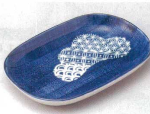
287-11-6H3 670円 2366287011 藍染波松葉小判皿 (18.5×12.5×2.2H)