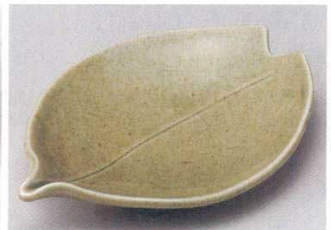
287-12-6H3 650円 2266269015 灰釉桜花銘々皿 (20×14×3.5H)