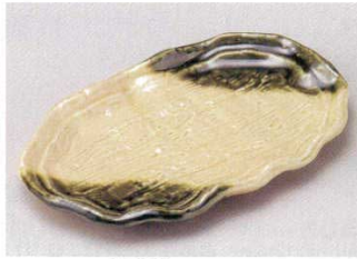
287-02-2B3 800円 2322287002 織部ヌリ分け焼物皿 (19.5×12.2×2.3H) 80入