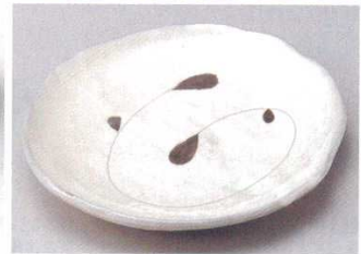
287-04-2C3 720円 2023463067 粉引木の葉取皿 (18×16.5×3H)