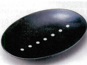
287-15-1H3 500円 2216269018 イナシゲ楕円6.0皿 (17.5×12.5×2.5H)