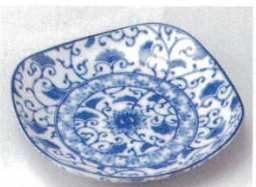
289-27-8F3 440円 2285271028 藍彩四角5.0皿 (15.2×15.2×3.2H)