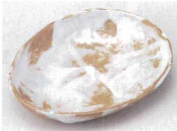
289-08-1K3 660円 2017206018 南蛮志野5.0皿 (14.5×12×2.8H)