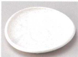
289-05-3B3 690円 2132231025 斑点粉引たわみ取皿 (15×14.3×2.3H)