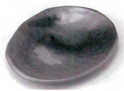
289-18-8F3 540円 2085195020 炭化ダ円取皿 (16×12.8)