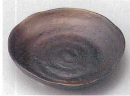
289-06-1B3 680円 2012204003 黒備前取皿 (14φ×3.2H)