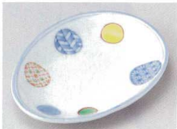
289-12-2C3 650円 2323289012 錦丸紋だ円銘々皿 (17×12.5×2.5H)