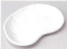
289-09-4E3 650円 1944177018 白釉ソラ豆型銘々皿 (18×11.6×1.4H)