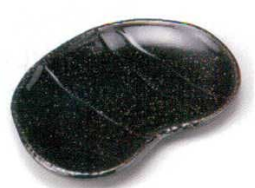
289-10-4E3 650円 1944177017 黒釉ソラ豆型銘々皿 (18×11.6×1.4H)