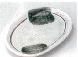
289-30-4A3 360円 1941145010 オリベサビ6.0小判皿 (18×12.2×2.1H)