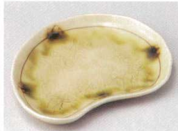
289-02-1A3 720円 2311289002 なごみそら皿 (16.5×13×1.7H)