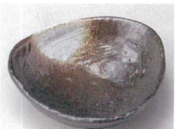
289-26-6H3 450円 2366289026 白吹天目三角小鉢 (13φ×4.5H)