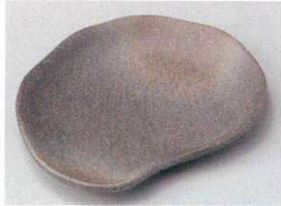
289-07-3B3 670円 2132231021 古窯豆型皿 (17×13.2×2H)