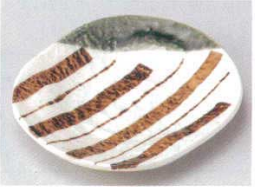
289-20-4A3 470円 2241271021 織部十草楕円取皿 (15.5×13.3×2.5H)