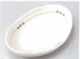
289-24-3B3 450円 2032195024 粉引ヒスイ楕円皿 (15.5×10.5×3H)