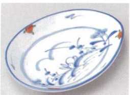
289-15-2C3 540円 2323289015 赤絵うさぎだ円銘々皿 (17×12.5×2.5H)