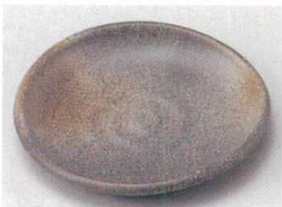
289-13-3B3 630円 2132231024 古窯たわみ取皿 (15×14.3×2.3H)