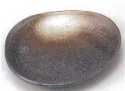
289-14-6H3 600円 2366289014 白吹天目三角中皿 (17.5×15.2×2.7H)