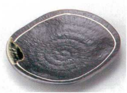
289-19-4A3 480円 2341289019 鉄釉一珍ライン小判和皿 (15×13×2.5H)