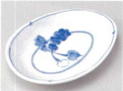
289-21-2C3 460円 2223271024 かぶらだ円銘々皿 (17×12.5×2.5H)