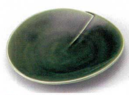
289-16-6H3 580円 2266270027 織部丸合せ取皿 (16×14.5×2.6H)