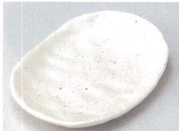
289-11-1H3 650円 2116237031 粉引彫り長皿 (17×12.5×2.5H)