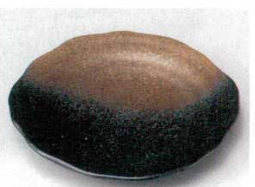
289-31-8F3 330円 2385289031 黒備前フリル楕円皿 (15×14.5×1.5H)

和食の付くお祝い鉢 焼印和皿大皿盛鉢 酒器茶器とは 井茶碗 急須茶器 耐熱高古焼 洋食器 碗皿 中華食器 ガラス・金属 茶道具 漆器 木竹製品 神仏具