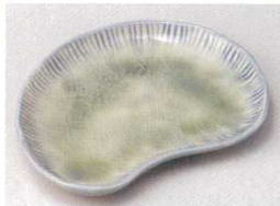
289-04-1A3 720円 2311289004 霜柱そら皿 (16.5×13×1.7H)