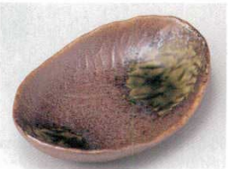
289-23-3B3 450円 2032195023 ふる里楕円皿 (15.5×10.5×3H)