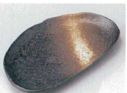
289-29-5C3 400円 2353289029 黒備前半月皿(小) (18.4×10.6×1.8H) 120入