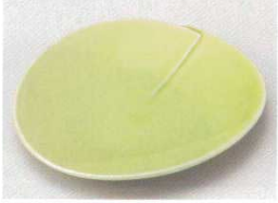
289-17-6H3 580円 2266270026 ひわ丸合せ取皿 (16×14.5×2.6H)