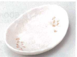
289-25-3B3 450円 2132231028 桜志野楕円銘々皿 (15.5×10.5×3H)