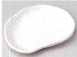
289-01-3B3 750円 2132231020 斑点粉引豆型皿 (17×13.2×2H)