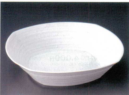
295-08-1A3 5,600円 2211295008 蒼ポウル(大) (28×28×7.2H)