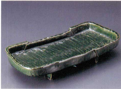
295-01-6F3 9,800円 1965208001 織部切立12.0盛皿 (38.5×17.5×7.5H)