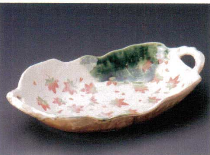
295-11-3B3 3,800円 2032259003 織部春秋両手付盛鉢 (34.5×19.5×6.5H)