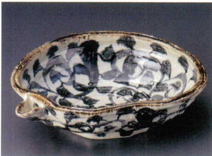
295-04-8F3 4,600円 2385295004 タコ唐草片口浅口大鉢 (29×25×7.5H)