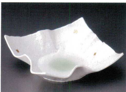
295-12-6F3 4,950円 2165297007 ラスター紙鍋形8.0鉢 (25.5×25.5×8H) 295-13-6F3 3,450円 2165297008 ラスター紙鍋形7.0鉢 (20.8×20.8×7H)