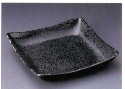
295-14-4A3 7,700円 2241293012 黒釉12.0正角鉢 (37×37×7.6H) 295-15-4A3 5,500円 2241293013 黒釉11.0正角鉢 (33×33×6.2H)

割身内付大鉢 焼皿和皿大皿盛鉢 酒器茶器 其・茶碗 急須・茶器 和陶オーブン 耐熱・漆古焼 洋食器 碗皿 中華食器 ガラス・金属 茶道具 雑器 木・竹製品 神・仏具