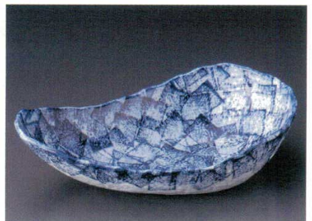
295-07-6F3 3,800円 2265306004 染付折り紙大鉢 (32×20×9H)