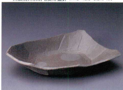
295-09-6A3 9,300円 2161290008 炭化土ばたもち13.0変形盛鉢 (35.5×27×4.5H)