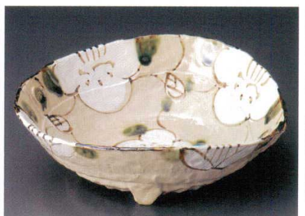
295-10-2F3 4,100円 2025259002 格子花盛鉢 (26×24.5×7.5H)