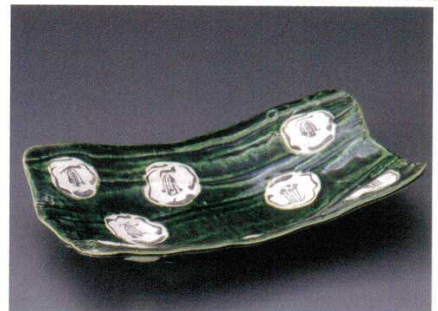
295-03-4B3 4,150円 2142297009 織部椿盛鉢 (28×18.5×6H)