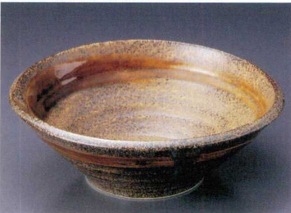
303-11-2H3 3,600円 2326303011 黄河織部富士形8.5并 (26.4×9H) 303-12-2H3 2,500円 2326303012 黄河織部富士形7.0并 (23×9H)