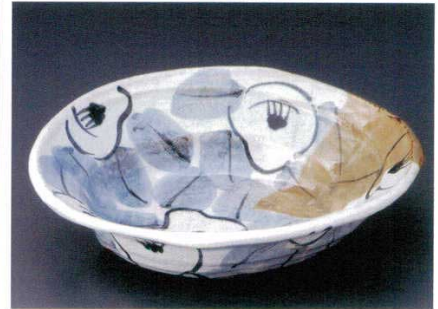
303-03-6F3 3,500円 2265301009 粉引山茶花変型8.0鉢 (24.5×23×7H)