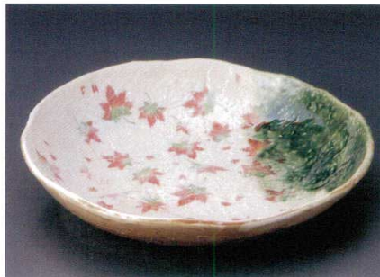
303-09-3B3 4,200円 2332303009 織部春秋丸盛鉢 (27.4×26.4×5.8H)