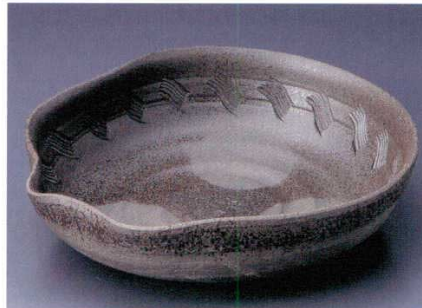
303-05-6A3 3,950円 2261301010 炭化土(ぼたもち)瓢形8.5盛鉢 (26.5×24.5×6.5H)