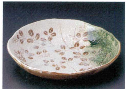
303-10-3B3 4,200円 2032258001 織部萩丸盛鉢 (27.4×26.4×5.8H)