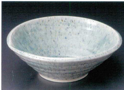
303-13-8F3 3,700円 1985224002 星の砂富士型8.5鉢 (26.2φ×9H) 303-14-8F3 2,150円 1985224003 星の砂富士型7.0鉢 (23φ×6.7H)