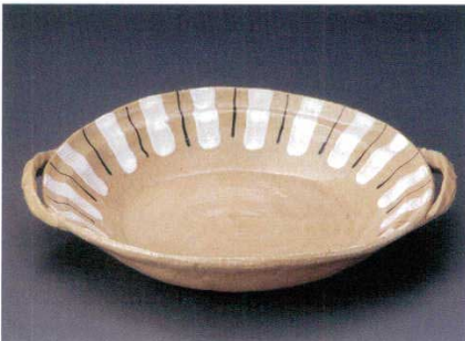
303-07-6E3 4,500円 2264301011 白十草盛鉢 (28×23.8×5H) 303-08-6E3 2,500円 2264301012 白十草手付和鉢 (23.5×18.6×4.6H)