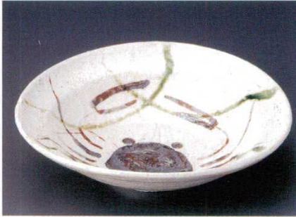
303-01-6B3 5,300円 2162296004 志野織部蟹あみ笠鉢 (25×23.5×7H)