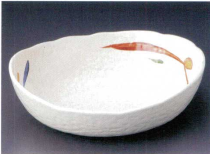
303-04-1K3 4,200円 2117299013 手描赤絵8.5楕円大鉢 (22.7×26×7.5H)