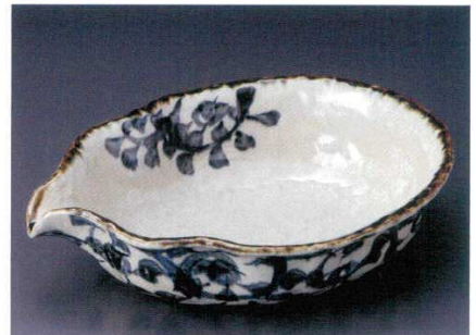
303-06-6F3 3,600円 1965230009 タコ唐草ひさご型盛鉢 (26.5×21×6H)