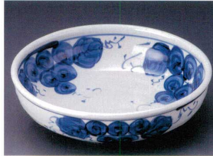
303-02-7C3 5,000円 2073256004 古染ぶどう8.0玉ボール (24.8φ×7.4H)