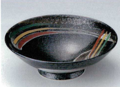
306-05-5E3 2,100円 2154306016 荒刷毛三彩 8.0高台鉢 (24.5φ×8H)