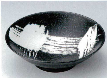
306-08-6E3 1,750円 2364306008 黒釉白刷毛目8.0鉢 (25φ×7.5H) 30入