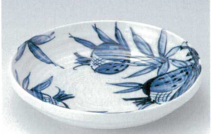
306-03-2C3 2,000円 1923234008 ざくろ8.0盛皿 (25.3φ×5H)