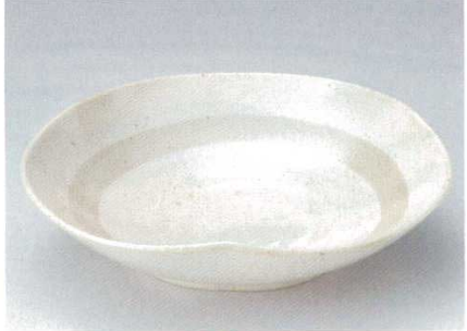
306-06-2B3 2,050円 2222304011 砂うのふ変形三角鉢 (大) (25×24×5.5H)