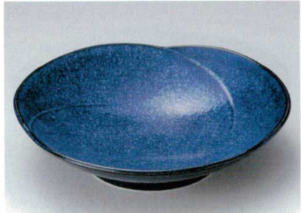
306-09-6E3 1,580円 2264305007 深海ウェーブ8.5鉢 (25.2φ×5.2H)