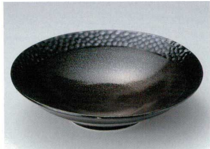
306-14-6A3 2,200円 2361306014 シヨコラ植目形大鉢 (26φ×6.5H)