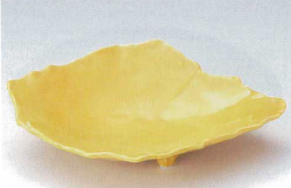
306-02-8F3 2,650円 2285306006 黄釉ちぎり変形9.0鉢 (28×23×7H)