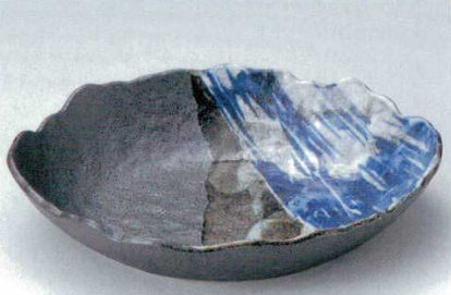
306-01-7Y3 2,000円 2378306001 美濃焼呉須唐津盛鉢 (24.5×21×4.5H) 1入