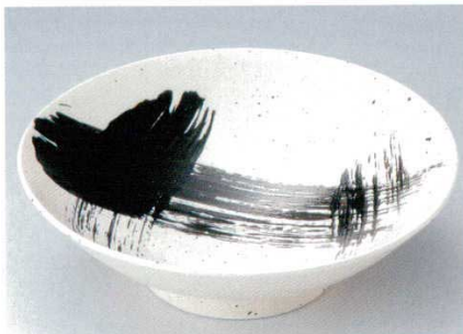
306-07-6E3 1,750円 2364306007 粉引黒刷毛目8.0鉢 (25φ×7.5H) 30入