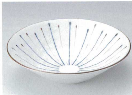
306-12-2H3 2,200円 2326306012 紺錆十草リップル8.0鉢 (26.2φ×7H) 306-13-2H3 1,900円 2326306013 紺錆十草リップル7.0鉢 (23.2φ×6.4H)