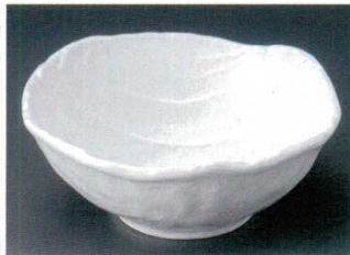
311-16-3C3 2,350円 2233312016 白釉ソギ23cm大鉢 (23.5φ×9.5H)