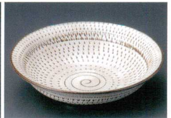
311-17-6A3 4,750円 2261527001 手彫り(飛びカンナ)7.0鉢 (21.5φ×5H)