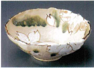
311-01-4E3 4,750円 2144303001 さくら7.5盛鉢 (23.5φ×8.8H)