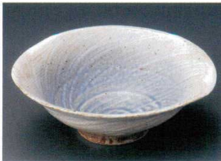
311-15-7Y3 3,500円 2178305001 美濃焼かいらぎブルー7.5鉢 (23φ×7H) 1入