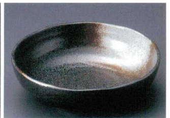
311-21-6H3 1,080円 2366311021 白吹天目6.5ボール (20φ×5.8H)

器 和 洋 食 器 茶 器 酒 器 焼 皿 和 皿 大 皿 盛 鉢 酒 器 急 須 茶 器 和 洋 食 器 耐 熱 美 古 焼 洋 食 器 碗 皿 中 華 食 器 カ フ ス 金 屬 茶 道 具 磁 器 木 竹 製 品 神 仏 具