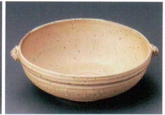
311-04-1H3 4,000円 2016265016 伊賀灰釉8.0盛鉢 (21.5φ×7.4H)