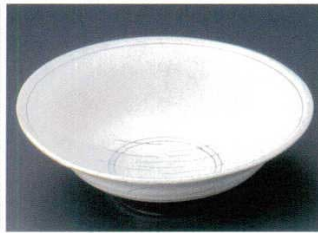
311-12-7Y3 3,600円 2178304006 美濃焼白7.5鉢 (23.5φ×8H) 1入