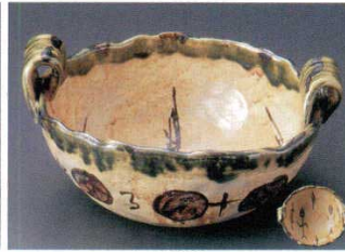
311-03-2C3 4,100円 2023265011 織部錆丸紋曲り手盛鉢 (23×19×11.5H)