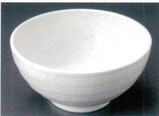
311-18-2C3 1,270円 2323311018 粉引うどん鉢 (21.5φ×9.8H)