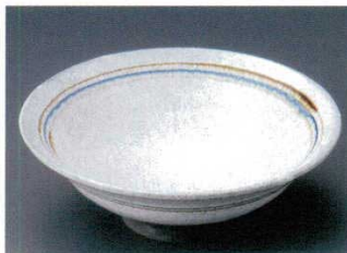
311-20-7Y3 3,500円 2178304014 美濃焼かいらぎライン7.5鉢 (22.5φ×7H) 1入