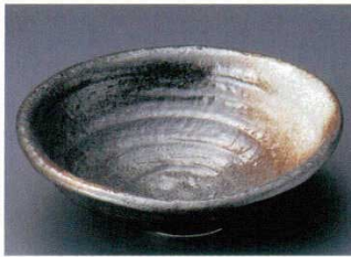
311-11-6H3 2,000円 2366311011 白吹天目舞深鉢 (20×19×6.3H)