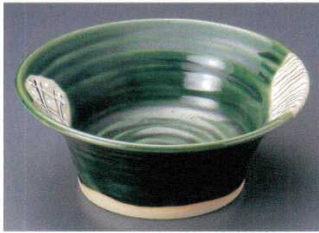
311-05-6A3 3,750円 2261519053 織部丸紋ラッパ形7.0深井 (21φ×8.5H)