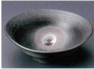
311-02-7C3 4,300円 2173303019 炭化火色8.0鉢 (22.5φ×7.5H)