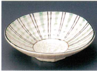
311-06-2B3 4,500円 2322311006 二色十草ろくべ7.0浅鉢 (21.3φ×5.8H) 40入