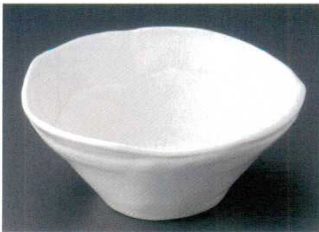
311-14-7E3 2,450円 2074268008 クリームたたら7.0盛鉢 (21×20×8.8H)