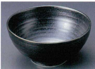
311-19-2C3 1,270円 2323311019 黒釉うどん鉢 (21.5φ×9.8H)