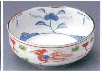
311-08-2F3 4,850円 1925228016 赤絵鳳凰一方押7.0鉢 (21.5φ×8.2H) 311-09-2F3 2,150円 1925228018 赤絵鳳凰一方押5.0鉢 (16.3φ×6.7H)