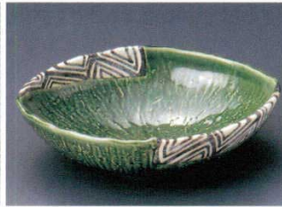
311-07-1K3 3,600円 1917230016 おりべ夏型盛鉢 (23.5×18.5×6.5H)