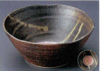
312-04-6E3 3,750円 2264310004 備前草紋7.0盛鉢 (21.5φ×9H)