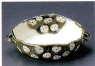
312-05-2F3 3,420円 2125309011 織部春秋両耳付7.0盛鉢 (22×17×6H)