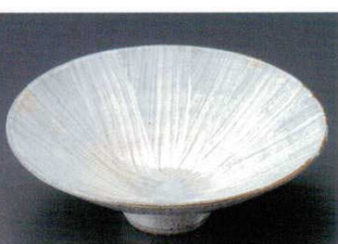
312-20-6C3 4,600円 2363312020 粉引刷毛目大鉢 (22.5φ×7.5H)