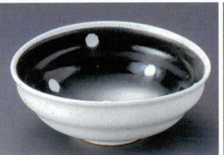
312-06-7Y3 3,200円 2178304015 美濃焼水玉夕円鉢 (22×19×8.5H) 1入