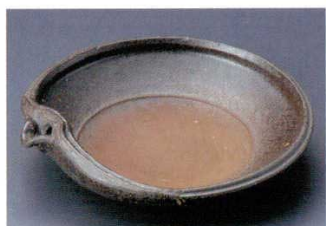
312-10-6A3 3,450円 2261310018 炭化土 片口7.5鉢 (23φ×6H)