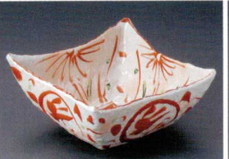
312-02-2C3 7,500円 2023264004 赤絵月うさぎ四角深鉢 (19.5×19.5×10.5H)