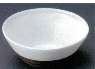
312-16-1H3 3,500円 2016266012 白カイヤギ7.0ボール (21.5φ×8.9H)