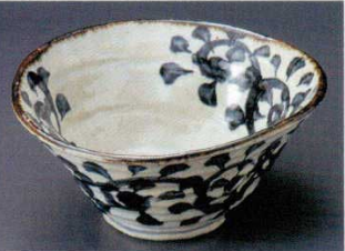
312-03-6F3 3,900円 1965229014 タコ唐草7.0盛鉢 (21.5×20×10H)