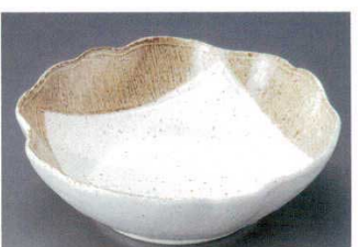
312-21-4E3 2,250円 2144305011 白唐津マス入花型鉢 (24.2φ×7.3H)