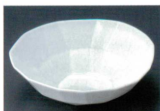
312-14-2C3 2,250円 2323312014 青磁盛鉢 (22φ×7H)