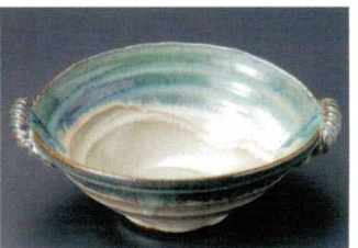
312-13-7F3 2,800円 2075652009 手造り白唐津オリベ手付6.5鉢 (21.8×18.3×7H)