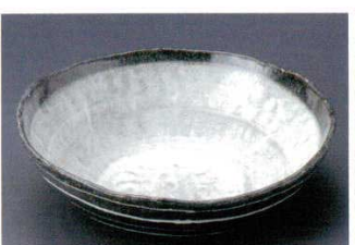
312-19-1A3 3,100円 2311312019 如意7.0鉢 (21.2×20.5×6.2H)