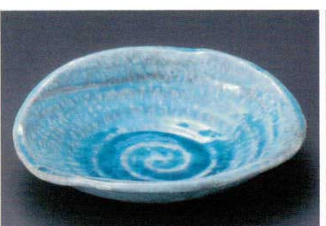
312-15-6F3 3,450円 1965230015 トルコ釉なぶり鉢 (23×22×5.5H)