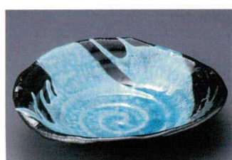
312-18-6B3 3,700円 2062266001 トルコかいらぎ7.0鉢 (22.7×21.5×5.5H)