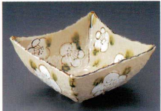
312-01-2F3 4,200円 2025259004 格子花6.5角深鉢 (20×20×11H)

和食器 洋食器 茶器 急須 和陶・伊万里 耐熱・美古焼 洋食器 陶器 中華食器 ガラス・金属 茶道具 雑器 木竹製品 神・仏具