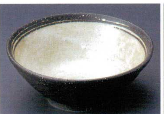
312-11-2C3 2,000円 2323312011 稔波けずり6.8井 (20.5φ×8.3H)