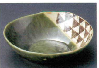
312-17-1A3 3,000円 2111309029 戦国織部7.0鉢 (21.2×20.5×6.2H)