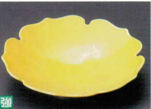
312-07-7C3 3,500円 1973024003 黄釉輪花7.5鉢 (22.5φ×5H)