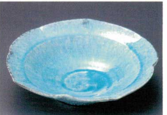
312-09-1H3 3,500円 2216310016 ブルーカイヤギ7.5盛鉢 (22φ×5.9H)