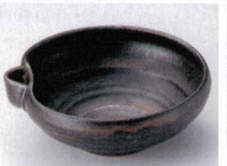
319-17-5E3 1,700円 2254319023 灰流片口鉢 (16×14.5×5.5H)