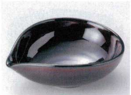
319-15-3B3 1,650円 2132035016 うるし釉片口鉢 (17×14×6H)