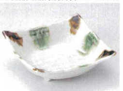
319-28-2B3 950円 2322319028 ビードロ流し四ツ足煮物鉢 (15.5×15.5×5.5H) 60入