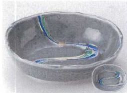
319-19-6A3 1,980円 2361319019 ねずみ流水小判形多用鉢 (17×14×5H)