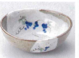
319-12-4B3 1,250円 2242320021 山ぶどう楕円鉢(大) (16.2×15.2×6H)