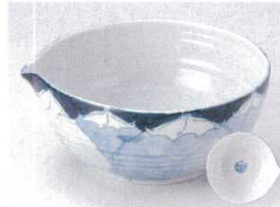
319-01-6B3 3,300円 2362319001 賀茂茄子片口鉢(中) (17×15.7×7H)