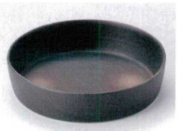
319-09-6A3 1,540円 2261319001 備前風 切立中鉢 (17φ×4.5H)