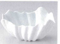
319-05-8F3 1,700円 2385319005 青磁シャコ貝向付 (17.7×12.3×8.6H)