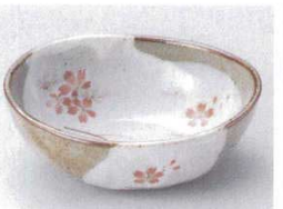
319-10-4B3 1,250円 2242320031 武蔵野楕円鉢(大) (16.2×15.2×6H)