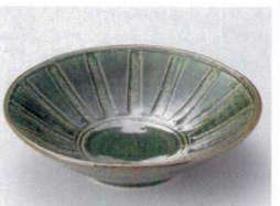
319-33-7C3 1,900円 2273319025 総織部しのぎ5.5平鉢 (16φ×4.6H)