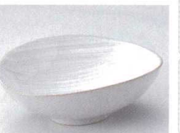
319-30-1A3 1,620円 2311319030 氷柱たまご鉢 (16.5×12.7×5.7H)