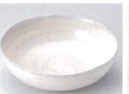
319-34-6B3 2,050円 1962233003 京唐津梅型盛鉢 (18.5φ×5.7H)