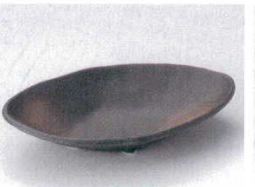
319-23-1B3 1,400円 2012269017 備前風菱型鉢(大) (21.5×13.3×6H)