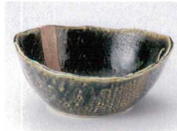
319-06-2A3 1,220円 2221320037 織部三角紋中鉢 (16.6×13.5×6.8H)