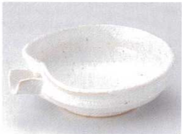
319-08-7C3 2,300円 2273318001 かいらぎ粉引片口5.0鉢 (16.5×16.5×5H)