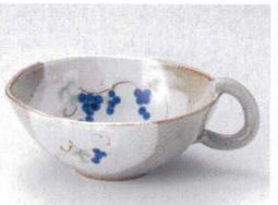
319-04-4B3 1,500円 2342319004 山ぶどう手付変型鉢(小) (17.5×12.5×6.6H)