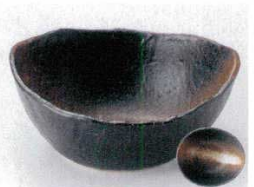
319-21-6A3 1,060円 2261321004 いぶし備前 新楕円深鉢(中) (16×13.5×7H)