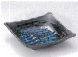
319-31-2C3 1,100円 2323319031 いづみ多用皿 (17.5×17.5×4.8H)