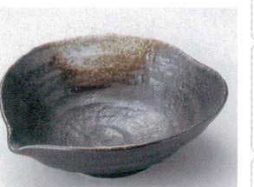
319-35-6H3 830円 2366319035 白吹天目片口煮物鉢 (17×16×5.3H)

和食器・碗皿 和陶・オーブン 耐熱・薬古瓶 洋食器・碗皿 中華食器 ガラス・金属 茶道具 雑器 木竹製品 神・仏具