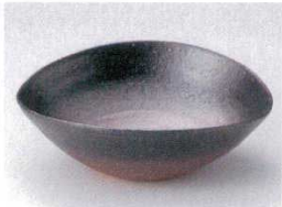
319-02-7C3 3,400円 2173025012 備前楕円多用鉢 (16×17.5×6H)