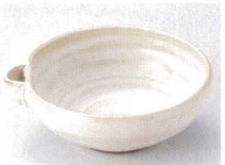
319-16-5E3 1,700円 2254319024 白唐津片口鉢 (16×14.5×5.5H)