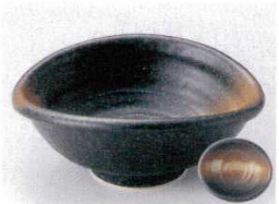
319-20-6A3 1,320円 2261320016 いぶし備前(M)楕円鉢 (15.5×13×6.5H)