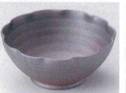
319-18-6H3 2,100円 2366319018 黒備前風中鉢 (15.5φ×7H)