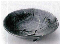
319-26-2A3 1,050円 1921236014 黒南蛮6.0平鉢(三ツ足) (18φ×5.8H)