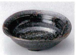
319-32-2B3 970円 2322319032 黒油滴三ツ足鉢(小) (20×20×6.5H) 40入