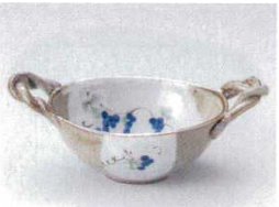
319-03-4B3 1,950円 2342319003 山ぶどう両手付楕円鉢(小) (19×12.5×7.4H)