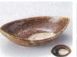
319-25-1H3 800円 2316319025 京うさぎ舟型鉢 (18.5×11.5×5H)