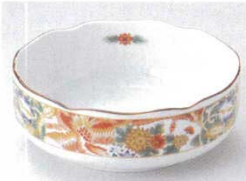
321-06-1K3 1,320円 2317321006 錦鳳凰5.5鉢 (17φ×6.5H)