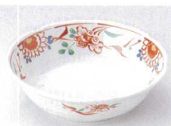
321-21-1K3 1,350円 1917235009 華万葉7.0鉢 (21.6φ×6.5H)