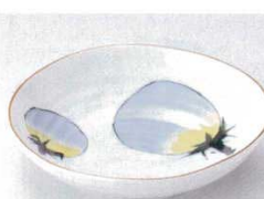
321-29-4B3 500円 2342321029 夢桜6.8浅鉢 (21φ×5.3H)