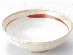
321-12-3B3 800円 2132316004 朱一文字5.5鉢 (16.8φ×4.9H)