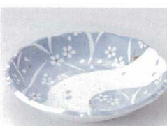
321-24-3C3 450円 2333321024 磁器志野友禅7.0盛皿 (22.5φ×4H)