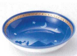
321-16-1H3 680円 2316321016 エジプトロマン5.5鉢 (17φ×3.8H)