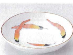
321-28-6E3 580円 2264318037 黄彩小花4.0ボール (12.4φ×4.1H)