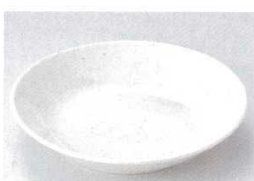
321-25-2C3 400円 2123221017 雪粉引7.0深皿 (21.5φ×4H)