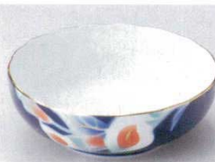
321-13-1H3 750円 2316321013 花青蘭鉢 (16.5φ×5.3H)