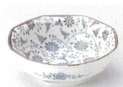
321-20-5E3 500円 2254323001 古染花八角5.0鉢 (16φ×5.5H)