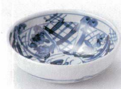
321-01-7C3 2,300円 2073273012 古染間取花5.0ボール (16φ×4.7H)