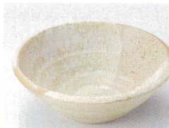
321-09-7F3 1,100円 2375321009 リブル富士型5.0井 (16.3φ×5.6H)