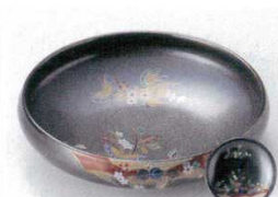
321-15-1H3 700円 2316321015 蝶友禅平鉢 (15φ×3.8H)