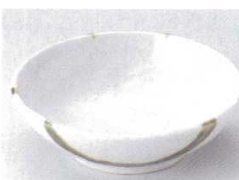
321-19-6H3 550円 2366321019 小雪5.0ボール (16.5φ×8H)