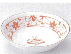
321-22-2H3 680円 2326321022 赤絵草花7.0浅鉢 (21.2φ×5.5H)