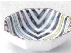
321-08-1H3 1,200円 2016273020 モダンストライプ5.0小鉢 (16.7φ×5.5H)