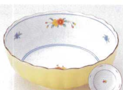
321-26-6E3 1,580円 2264318035 黄彩小花6.8ボール (20.6φ×7.3H)