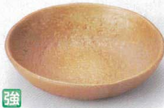
強 321-02-1A3 1,460円 2311321002 赤藤5.5浅鉢 (16.4φ×3.5H)