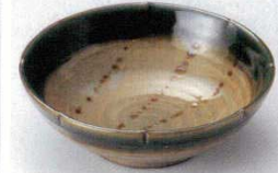
321-05-7F3 1,350円 2075273014 織部5.0鉢 (16.2φ×5.2H)