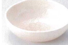
321-04-6A3 1,380円 2161315015 桜志野5.0丸鉢 (17×16×5H)