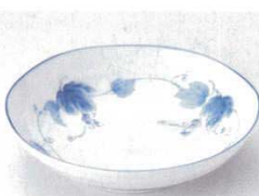
321-23-1E3 500円 2314321023 藍ブドー六兵6.8深皿 (21.2φ×5.3H)