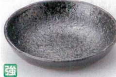
強 321-03-1A3 1,460円 2311321003 黒藤5.5浅鉢 (16.4φ×3.5H)