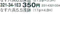
321-34-1E3 350円 2314321034 なす六兵5.5浅鉢 (17φ×4.8H)