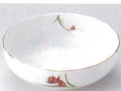
321-17-1H3 650円 2316321017 紅蘭鉢 (16.5φ×5.3H)