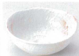
321-10-1K3 960円 2017034020 桜志野5.0手造三角鉢 (15.6φ×5.6H)