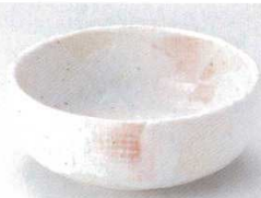
321-07-1K3 1,320円 2117315013 桜志野5.0浅ボール (15.5φ×6H)