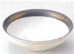
321-11-3B3 920円 2332321011 粉引金彩雲5.5鉢 (17φ×5H)