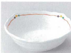
321-14-3B3 750円 2332321014 粉引三色点彩5.5鉢 (16φ×5H)