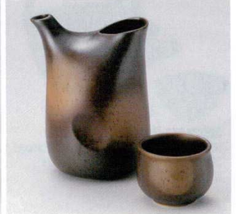
326-33-3B3 1,130円 2232326004 備前吹冷酒器 (8.7×11.6H・350cc) 10入 326-34-3B3 360円 2232326005 備前吹盃 (5.5φ×4.1H)