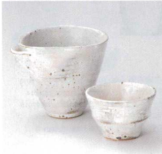
326-17-4C3 3,000円 2343326017 粉引冷酒器 (11.6×9×9.2H・250cc) 326-18-4C3 1,000円 2343326018 粉引ぐい呑み (7.7φ×5H)