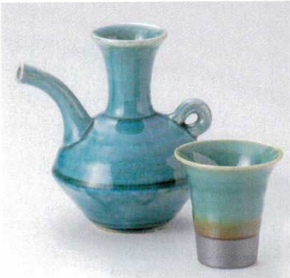
326-01-6C3 1,180円 2363326001 トルコ釉冷酒器 (10φ×13H・300cc) 6入 326-02-6C3 320円 2363326002 トルコ釉盃 (6.7φ×7H)

列身向付小鉢 椀 酒器 箸置き 井茶碗 急須 茶器 和陶 オーブン 耐熱 萬古焼 洋食 帯 碗皿 中華 食器 ガラス 金属 茶道具 雑器 木竹 製品 神仏 具