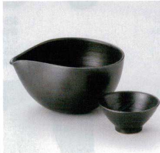
326-11-6C3 2,000円 2063286015 手造り黒焼平冷酒器 (14×11.5×7H・400cc) 6入 326-12-6C3 1,000円 2063286016 手造り黒焼平盃 (7.5φ×3.5H)