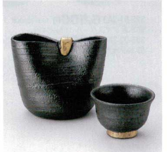
326-15-7E3 2,200円 1974238018 手造り黒釉冷酒差 (8.7φ×8H・120cc) 10入 326-16-7E3 940円 1974238019 手造り黒釉冷酒盃 (6φ×4H)