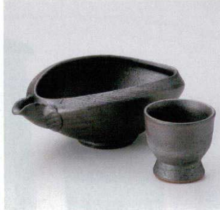
326-05-1K3 4,100円 2017286021 黒陶片口冷酒器 (16.5×11.7×6H・260cc) 326-06-1K3 900円 2017286022 黒陶片口高台盃 (6φ×5.5H・65cc)