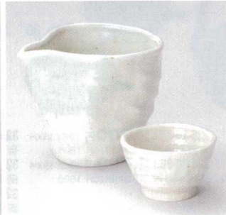
326-27-8F3 1,150円 2185320035 白釉冷酒 (大) (10.8×9.3×9H・340cc) 10入 326-28-8F3 1,000円 2185320036 白釉冷酒 (小) (9.3×7.5×8H・250cc) 10入 326-29-8F3 370円 2185320037 白釉ぐい呑 (7φ×4.3H)