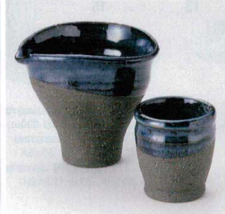
326-21-3B3 1,550円 2232326022 黒御影冷酒器 (10.5×9×9.4H・200cc) 10入 326-22-3B3 730円 2232326023 黒御影冷酒盃 (5.7×6.5H)