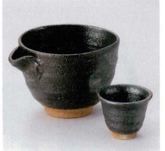
326-07-7E3 2,700円 1974238009 南蛮冷酒器 (13×10×8.5H・330cc) 6入 326-08-7E3 600円 1974238010 南蛮グイ呑 (5.8φ×4.7H)