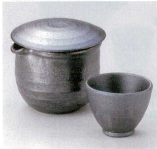
326-25-7E3 2,600円 2074286009 いぶし冷酒差 (9φ×8.8H・160cc) 6入 326-26-7E3 820円 2074286010 いぶし盃 (大) (φ6.7×5.4H)