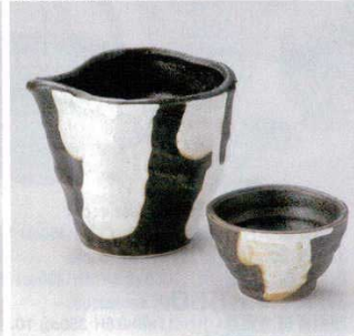
326-30-8F3 1,150円 2185320032 黒釉冷酒 (大) (10.8×9.3×9H・340cc) 10入 326-31-8F3 1,000円 2185320033 黒釉冷酒 (小) (9.3×7.5×8H・250cc) 10入 326-32-8F3 370円 2185320034 黒釉ぐい呑 (7φ×4.3H)