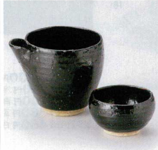
326-19-4C3 3,000円 2343326019 黒釉冷酒器 (9.8×8.8×8.2H・180cc) 326-20-4C3 1,000円 2343326020 黒釉ぐい呑み (6.5φ×3.8H)