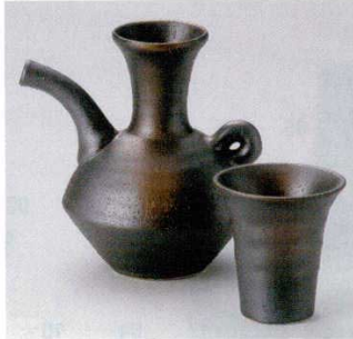
326-03-6C3 1,180円 2063287027 荒黒冷酒器 (10φ×13H・300cc) 6入 326-04-6C3 320円 2063287028 荒黒盃 (6.7φ×7H)