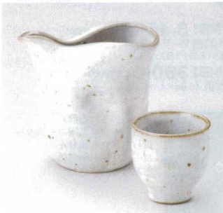
326-09-4E3 2,100円 1944251001 粉引青磁冷酒器 (11.3×8.8×10.9H・380cc) 326-10-4E3 780円 1944251002 粉引青磁ぐい呑 (6φ×6H)