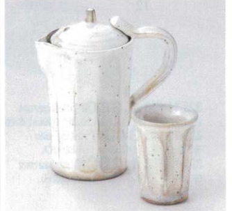
326-23-1K3 4,400円 2017286001 粉引面取り筒型冷酒器 (7φ×13H・220cc) 326-24-1K3 960円 2017286002 粉引面取り筒型盃 (5φ×6.8H・50cc)