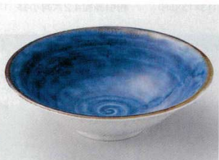
033-21-6H3 540円 2366033021 呉須巻5.5平鉢 (18φ×5H)