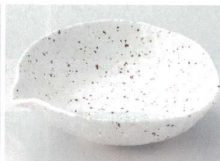
033-12-6H3 700円 2366033012 鉄粉白粉引片口平鉢 (17×16×5H)