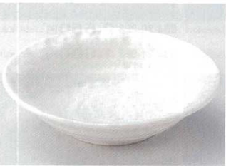
033-13-8F3 680円 2385033013 白釉石目5.0鉢 (16.7φ×4.2H) 033-14-8F3 450円 2385033014 白釉石目4.0鉢 (12.7φ×3.7H) 033-15-8F3 380円 2385033015 白釉石目3.3鉢 (11φ×3H)