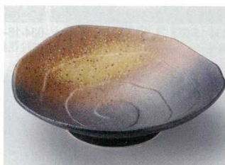
033-18-8F3 550円 2385033018 黒備前三角5.0浅鉢 (16×16×4H) 033-19-8F3 380円 2385033019 黒備前三角4.0浅鉢 (13×13×3.3H)