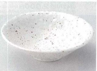
033-20-6H3 540円 2366033020 鉄粉白粉引5.5平鉢 (18φ×5H)