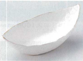
033-09-8F3 740円 2385033009 白マット水晶舟型鉢 (20.4×9.6×6.8H)