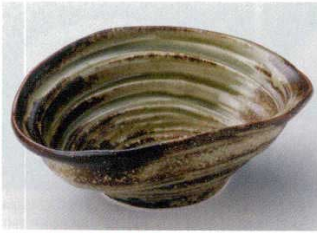
033-01-8F3 900円 2385033001 灰釉吹きたわみ向付 (18.5×15.5×7.5H)