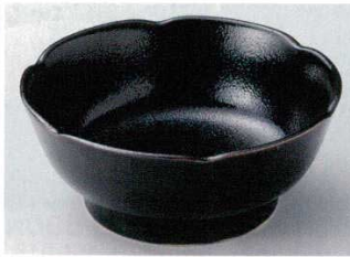
033-02-6E3 900円 2264019023 ゆず天目刺身鉢 (16.5φ×6.8H)