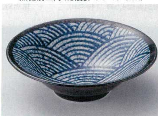
033-23-4E3 490円 2144039019 青海波5.0平鉢 (16φ×4.8H)