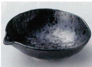
033-11-6H3 700円 2366033011 油敵天目片口平鉢 (17×16×5H)