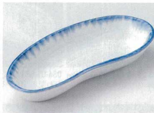
033-07-2F3 750円 1925031021 呉須刷毛目まゆ型向付 (22×10×3.1H)