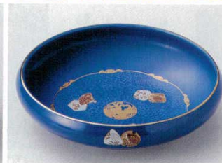
033-04-1H3 850円 1916236013 藍重ね鉄鉢 (15.5φ×4H)