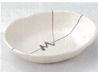
033-17-7E3 630円 2174039012 乱線楕円浅鉢(小) (17.5×14.5×3.5H)