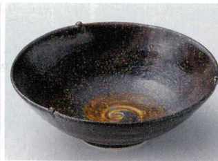
033-03-2A3 880円 2321033003 流星5.0平鉢 (15.5φ×4.8H)