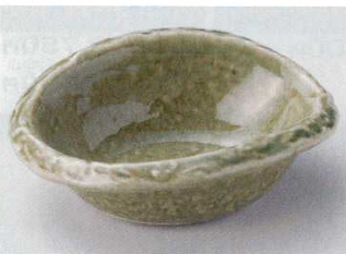
033-16-6H3 640円 2266033011 灰釉帽子型4.0小鉢 (16×14×5.5H)