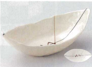
033-10-7E3 720円 2174039004 乱線舟型鉢 (20.3×10×7H)