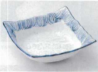
033-05-6B3 850円 2262032004 奥入瀬足付刺身鉢 (15.3×15.3×5.2H)