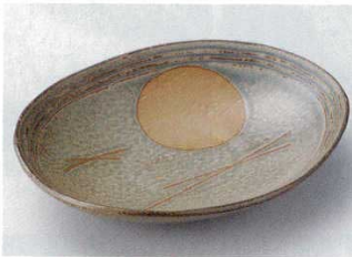
033-06-6E3 780円 2264033017 燦々三本線18cm楕円皿 (18.5×15×2.7H)