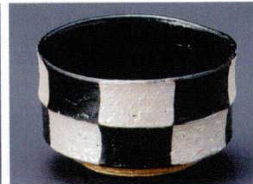
034-13-8F3 3,100円 2385034013 天目銀市松抹茶中鉢 (12.3φ×7.7H)