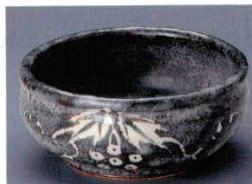
034-11-6B3 3,100円 1962033010 嵐志野ぶどう丸小鉢 (12.3φ×5.4H)