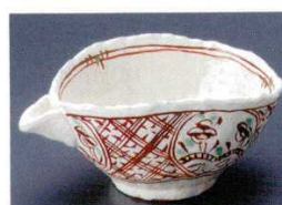
034-15-6F3 3,000円 2165040022 線格子片口小鉢 (16×10.5×7.5H)