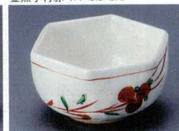
034-25-1K3 2,600円 2117041015 粉引赤絵4.2六角小鉢 (13φ×7H)