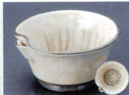
034-03-6B3 3,500円 2262034005 粉引印花片口小鉢 (14.2×13.5×7H)