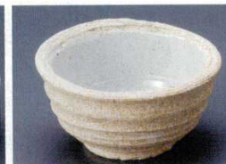
034-31-6A3 2,530円 1961034011 手造石焼青地深4.5井 (13φ×6.5H)