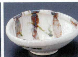
034-30-6F3 2,550円 2265034028 志野十草小鉢 (15×13.5×6H)