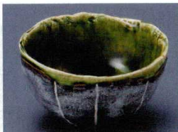
034-02-6B3 3,750円 2362034002 鼠織部掛分楕円小鉢 (11.5×11×6.5H)