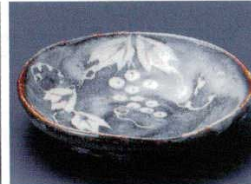
034-14-6B3 3,100円 1962033005 嵐ぶどう丸皿 (14φ×3H)