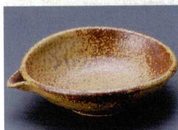
034-05-6B3 3,350円 1962033007 唐津片口鉢 (16.7×12.7×6.5H)