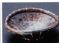
034-23-6F3 2,700円 2265034032 鼠志野玉瀾小鉢 (15.5×13.5×6H)