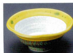
034-28-6F3 2,600円 1965042001 黄交趾小鉢 (12.5φ×5H)