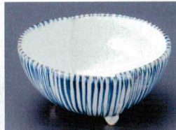
034-04-6B3 3,400円 2362034004 染付十草三ッ足小鉢 (12.3φ×5.7H)