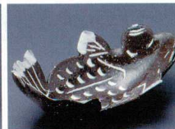
034-20-8F3 2,550円 2385034020 金魚小鉢黒 (15.5×9.7×5.3H)