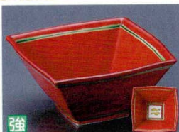
034-01-6F3 3,980円 1965033003 赤絵双魚角小鉢 (13×13×6.3H)