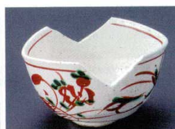
034-16-6F3 2,950円 2065036011 赤絵花紋両切4.5鉢 (15×10.3×8H)