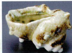
034-12-1K3 3,200円 2217034016 灰釉4.5サザエ (14.5×12×9H)