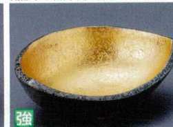
034-32-6A3 2,530円 2161041016 黒ちり内金塗4.5半月形井 (15.5×11×5.5H)

刺身向小鉢珍味 和風和風 酒器 酒器 酒器 酒器 井・茶碗 急須・茶器 和陶オーブン 耐熱 産古 洋食器 碗皿 中華食器 カフス・金属 茶道具 雑器 木・竹製品 神・仏具