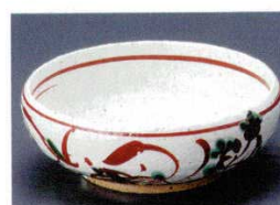
034-22-6F3 2,700円 1965034005 粉引赤絵4.5鉢 (14φ×5H)