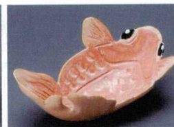
034-18-8F3 2,750円 2385034018 金魚小鉢赤 (14.7×9.5×5H)