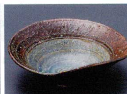
034-17-6F3 2,900円 1965040017 焼締半月ゴス小鉢 (13φ×4.6H)