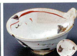
034-29-8F3 2,550円 2385034029 赤絵鉄絵染描小香水 (14.5×10.4×5.3H)