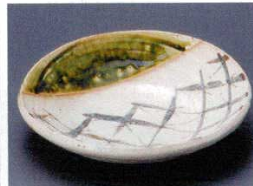
034-08-6B3 3,300円 1962040006 織部格子丸皿 (14φ×3H)