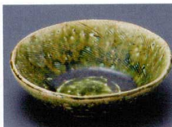
034-06-6B3 3,100円 1962040008 織部くし目鉢 (13.7φ×3.5H)