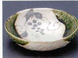
034-09-6B3 3,300円 1962040016 織部ぶどう丸鉢 (14φ×4H)