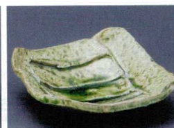
034-24-6F3 2,700円 1965041004 新緑けずり四角鉢 (13×13×5H)