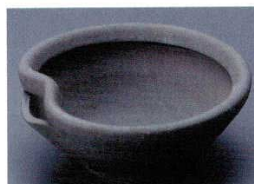
034-10-1K3 3,000円 2017036016 黒陶片口小鉢 (14φ×6H)