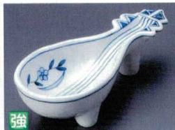
034-07-6F3 3,300円 2265034003 びわ型皿 (18.5×8×30φ×4.5H)