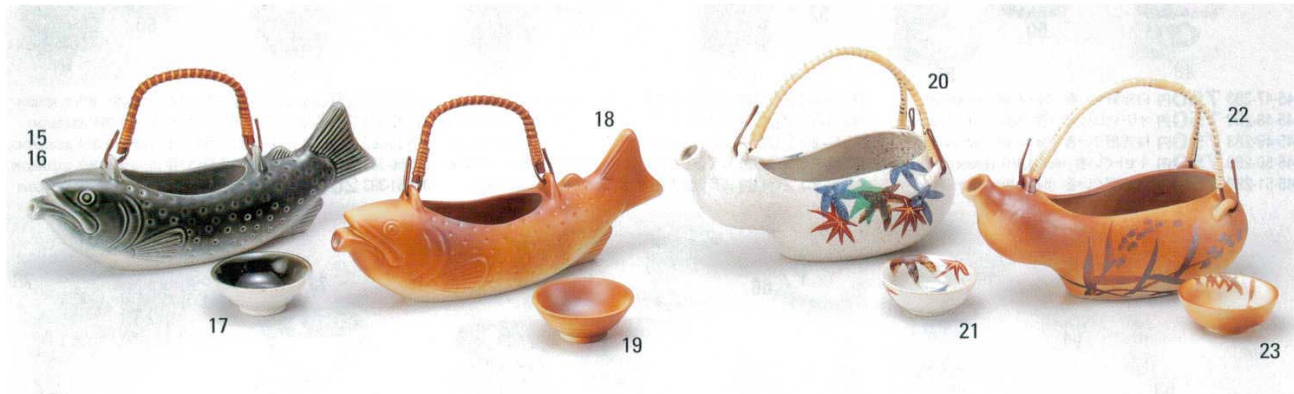
346-15-6C3 3,000円 1963250003 織部吹イワナ骨酒 (大) (32×9×12H・650cc) 1入 346-16-6C3 2,750円 1963250004 織部吹イワナ骨酒 (小) (28.5×8.5×10.5H・380cc) 1入 346-17-6C3 320円 1963250005 織部吹大平盃 (8.5φ×3.5H) 346-18-6C3 3,000円 2363346018 焼締イワナ骨酒器 (32×9×12H・650cc) 1入 346-19-6C3 320円 2363346019 焼締イワナ大平盃 (8.5φ×3.5H) 346-20-6C3 3,500円 2363346020 赤絵紅葉骨酒器 (26×11×12.5H・850cc) 1入 346-21-6C3 650円 2363346021 赤絵紅葉盃 (8.2φ×3.2H) 346-22-5E3 2,800円 1954250001 民芸ひさご型骨酒 (11.5×25.5×12.3H・900cc) 1入 346-23-5E3 280円 1954250002 民芸平盃 (8φ×3H)