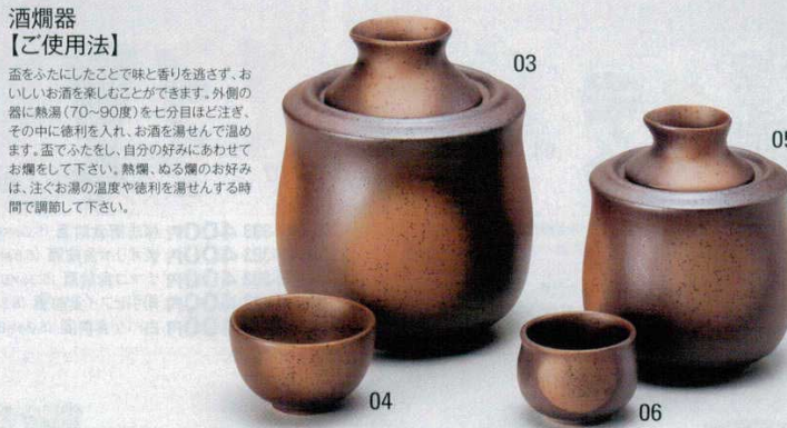
346-03-3B3 3,100円 備前吹酒燗器(大)徳利付 (12φ×15H) 1入 2132329019 346-04-3B3 400円 備前吹大丸グイ呑 (7φ×4.5H) 2132329023 346-05-3B3 1,900円 備前吹酒燗器(小)徳利付 (9.5φ×12H) 1入 2132329021 346-06-3B3 360円 備前吹グイ呑 (5.5φ×4.1H) 40入 2132329024