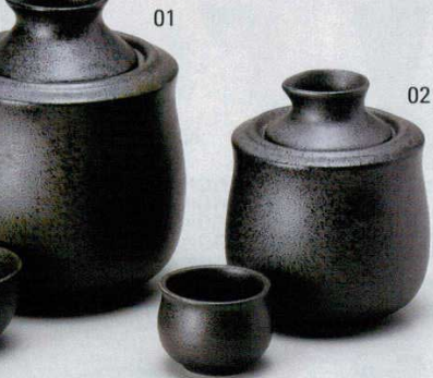
346-01-4B3 3,500円 2142329017 黒結晶酒燗器セット(大) (300cc) 346-02-4B3 2,200円 2142329018 黒結晶酒燗器セット(小) (140cc)