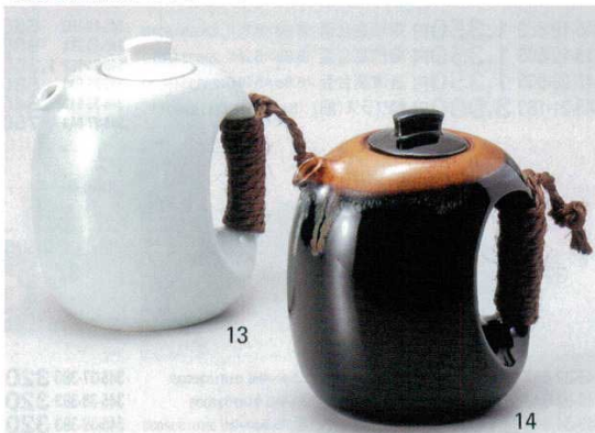
346-13-6C3 3,000円 1963250023 青地縄巻ポット7号 (16×12×19H・1500cc) 1入 346-14-6C3 3,000円 1963250024 天目縄巻ポット7号 (16×12×19H・1500cc) 1入