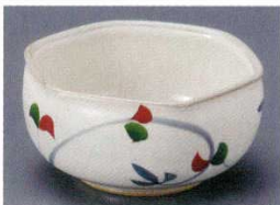
037-13-6E3 1,780円 2264036021 手描き赤絵唐草中鉢 (12φ×6H)