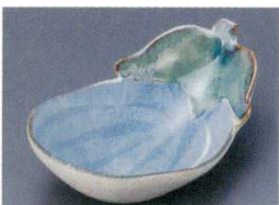
037-18-8F3 1,760円 2385037018 野菜小鉢(茄子) (14.3×8.6×4H) 037-19-8F3 1,100円 2385037019 野菜小付(茄子) (10.2×6.5×2.5H)