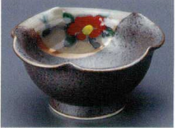
037-35-2A3 1,680円 1921044012 華南姿4.0花型小鉢 (12.8φ×6.2H) 037-36-2A3 1,600円 1921044013 華南姿3.6花型小鉢 (11.1φ×6.5H)