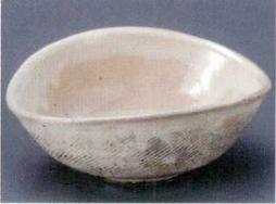
037-34-2C3 1,700円 2023040016 粉引くし目楕円小鉢 (14×11.8×5.5H)