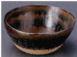
037-03-7Y3 1,900円 2178314020 美濃焼紺窯変ホー (15×14.5×6.5H) 1入