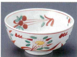
037-10-7C3 1,800円 1973045010 高麗内外赤彩小鉢 (12.2φ×5.7H)