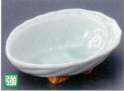
強 037-21-2A3 1,720円 2321037021 青白磁あわび型小鉢(大) (14.3×11.6×4.2H) 037-22-2A3 1,160円 2321037022 青白磁あわび型小鉢(小) (11×8.7×4.3H)