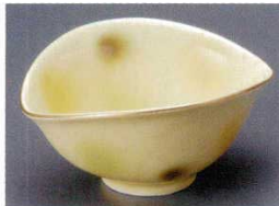
037-01-6A3 1,820円 2161043011 あすか三色吹すげ傘小鉢 (14×12×6.5H)