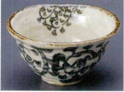
037-32-2C3 1,700円 2023040013 たこ唐草反小鉢 (13.5φ×7H)