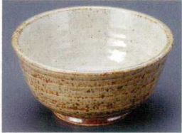
037-24-6A3 1,710円 2161044028 石焼かいらぎ4.5深井 (13.5φ×6.5H)