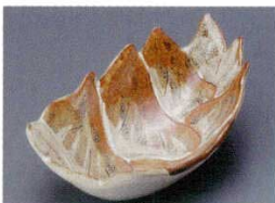
037-14-8F3 1,760円 2385037014 野菜小鉢(筍) (14×8.5×4H) 037-15-8F3 1,100円 2385037015 野菜小付(筍) (10.5×5.7×3.2H)