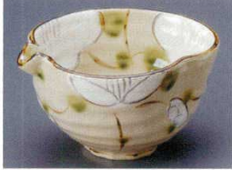
037-20-2F3 1,750円 2025039013 格子花片口4.0小鉢 (13.8×13×7H)