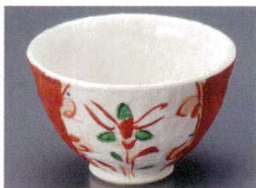
037-09-2C3 1,800円 2023335023 粉引志野赤絵姫井 (11.5φ×7H)