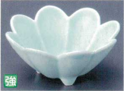
強 037-25-1B3 1,620円 2312037025 ヒスイ菊割小鉢 (12.5φ×5.7H) 037-26-1B3 740円 2312037026 ヒスイ菊割小付 (7.9φ×3.5H)