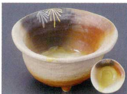
037-08-7F3 1,800円 2075039016 荒土金銀松葉4.0小鉢 (12φ×6.2H)