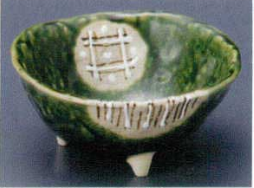
037-37-6A3 1,650円 2261519051 織部丸紋4.0三つ足深鉢 (13.5φ×6H)

刺身向付小鉢珍味 清器 蒸籠 土器 井茶碗 急須・茶器 和陶オーレン 耐熱・薄古焼 洋磁器・磁皿 中華食器 カニス・金庫 茶道具 雑器 木・竹製品 神・仏具