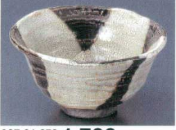
037-31-2F3 1,700円 2225037032 カイヤギ反小鉢 (13φ×7H)