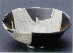
037-33-6E3 1,700円 2264037005 緑袖カイヤギ三ッ押中鉢 (13.5φ×5.5H)