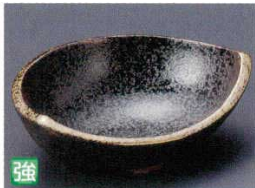
強 037-02-6A3 1,820円 2161043022 黒ちらし口金4.5半月形井 (15.5×11×5.5H)