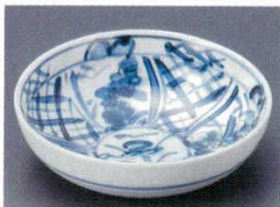
037-05-7C3 1,800円 2073040025 古染間取花4.0ホー (12.7φ×4H)