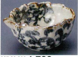
037-30-2C3 1,700円 2023040007 たこ唐草片口小鉢 (14.5×12.5×7H)