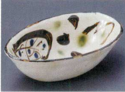
037-23-6E3 1,700円 2264054008 いろは中ホー(手造り) (15.8×8.8×5H)