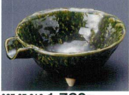
037-27-2A3 1,720円 2221037016 織部片口三つ足小鉢 (15.7×13.2×5.8H)