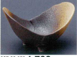
037-28-6F3 1,700円 2265037025 備前吹き双葉小鉢 (14.5×9.5×8.6H)