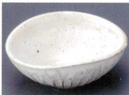
037-07-1K3 1,800円 2217038003 粉引4.3ソギ目楕円小鉢 (14×12.6×5.2H)