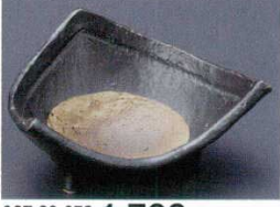
037-29-6F3 1,700円 2365037029 満月三角小鉢 (14.3×12×6.7H)