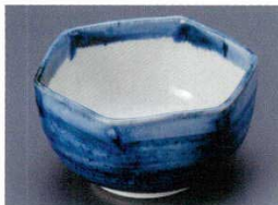
037-06-1K3 1,800円 1917035016 呉須巻六角鉢 (13φ×7H)