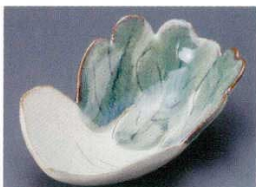
037-16-8F3 1,760円 2385037016 野菜小鉢(かぶ) (14×8×3.8H) 037-17-8F3 1,100円 2385037017 野菜小付(かぶ) (10.4×5.8×3H)