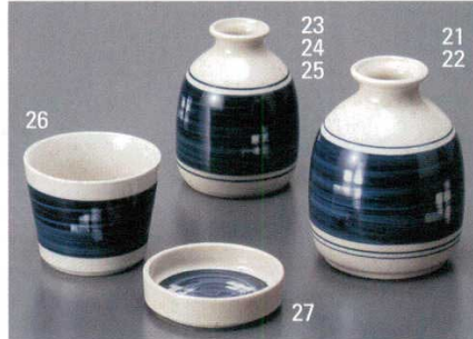
373-21-6C3 1,350円 コスカスリそば徳利5号 (11.5φ×14.8H・850cc) 6入 1963262020 373-22-6C3 1,100円 コスカスリそば徳利4号 (10.5φ×13.5H・660cc) 6入 1963262021 373-23-6C3 820円 コスカスリそば徳利3号 (9.5φ×12.5H・490cc) 10入 1963262022 373-24-6C3 650円 コスカスリそば徳利2号 (7.5φ×10.5H・270cc) 10入 1963262023 373-25-6C3 500円 コスカスリそば徳利1号 (7φ×9H・190cc) 20入 1963262024 373-26-6C3 400円 コスカスリそば千代口 (8.3φ×6.7H) 1963262025 373-27-6C3 310円 コスカスリ薬味皿 (6.3φ×2.3H) 1963262026