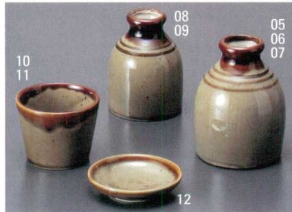
373-05-6C3 1,050円 オリーブそば徳利5号 (11.5φ×13.5H・950cc) 6入 1963264001 373-06-6C3 900円 オリーブそば徳利4号 (11.5φ×14.5H・900cc) 6入 1963264002 373-07-6C3 620円 オリーブそば徳利3号 (9.5φ×12.5H・490cc) 10入 1963264003 373-08-6C3 440円 オリーブそば徳利2号 (7.5φ×10.5H・270cc) 10入 1963264004 373-09-6C3 360円 オリーブそば徳利1号 (6.5φ×9.5H・160cc) 20入 1963264005 373-10-6C3 320円 オリーブそば千代口(大) (8.3φ×6.5H) 1963264006 373-11-6C3 300円 オリーブそば千代口(小) (8.3φ×5.5H) 2385373001 373-12-6C3 240円 オリーブそば薬味皿 (9.3φ×2H) 1963264007