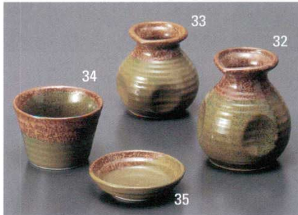
373-32-1B3 1,100円 よもぎグリーンそば徳利2号 (8.5φ×10H) 10入 2212372029 373-33-1B3 650円 よもぎグリーンそば徳利1号 (8φ×8H) 10入 2212372030 373-34-1B3 450円 よもぎグリーンそば千代口 (8.3φ×6H) 2212372031 373-35-1B3 330円 よもぎグリーンそば薬味皿 (8.5φ×2H) 2212372032