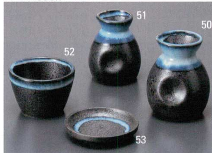
373-50-6C3 500円 黒水晶そば徳利2号 (8φ×10.5H・270cc) 10入 1963263059 373-51-6C3 410円 黒水晶そば徳利1号 (6.5φ×9H・170cc) 20入 1963263060 373-52-6C3 360円 黒水晶そば千代口 (8.5φ×5.8H) 1963263061 373-53-6C3 250円 黒水晶そば薬味皿 (9.2φ×1.5H) 1963263062