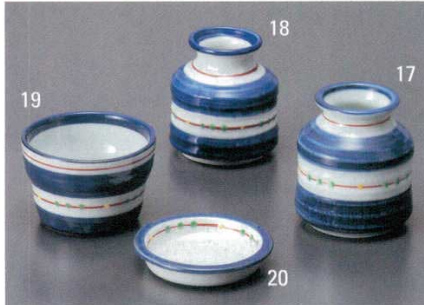
373-17-6B3 1,630円 こますじそば徳利(中) (7.8φ×8.8H・240cc) 2362373017 373-18-6B3 1,250円 こますじそば徳利(小) (7.5φ×8.2H・200cc) 2362373018 373-19-6B3 1,150円 こますじそば千代口 (9φ×6H) 2362373019 373-20-6B3 730円 こますじ薬味皿 (9φ×1.8H) 2362373020