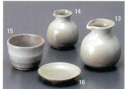
373-13-6E3 2,050円 手造風粉引吹そば徳利(大) (9.5φ×10.3H・380cc) 1934262005 373-14-6E3 1,480円 手造風粉引吹そば徳利(小) (7.9φ×8.3H・200cc) 1934262006 373-15-6E3 1,100円 手造風粉引吹ソバ千代口 (8.7φ×6.5H) 1934262007 373-16-6E3 600円 手造風粉引吹やぐみ皿 (9.5φ×2.2H) 1934262008