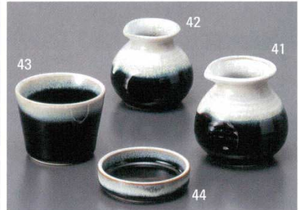
373-41-6C3 740円 天目白流し2号そば徳利 (8.5φ×8.5H・250cc) 10入 2363373041 373-42-6C3 610円 天目白流し1号そば徳利 (8φ×7.5H・180cc) 10入 2363373042 373-43-6C3 400円 天目白流しそば千代口 (8.4φ×6.6H) 2363373043 373-44-6C3 320円 天目白流しそば薬味皿 (8.5φ×2.3H) 2363373044