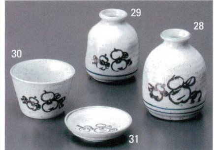
373-28-1B3 900円 梨地ひさごそば徳利2号 (8.4φ×10.8H) 10入 1912261030 373-29-1B3 520円 梨地ひさごそば徳利1号 (7.3φ×9.2H) 10入 1912261031 373-30-1B3 370円 梨地ヒサゴそば千代口 (8.4φ×5.7H) 1912261032 373-31-1B3 290円 梨地ヒサゴ薬味皿 (8.8φ×2H) 1912261033