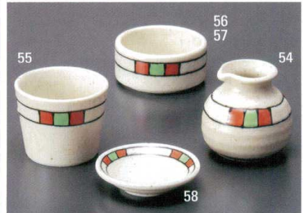
373-54-5E3 900円 二色間取そば徳利 (8.3φ×7.7H・180cc) 2254373001 373-55-5E3 590円 二色間取そば千代口 (8.1φ×6.5H) 2254373002 373-56-5E3 470円 二色間取薬味鉢(大) (8.6φ×4H) 2254374024 373-57-5E3 450円 二色間取薬味鉢(小) (7.8φ×3H) 2254374025 373-58-5E3 450円 二色間取小皿 (8.9φ×2H) 2254373003

酒器 茶器 和陶 急須 耐熱 洋食器 中華食器 ガラス 茶道具 雑器 木竹製品 神仏具