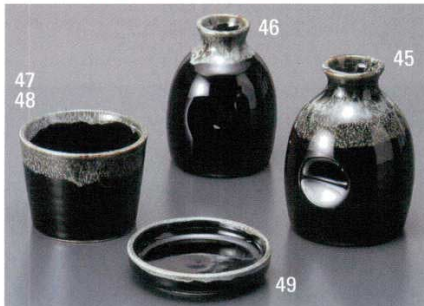
373-45-6C3 680円 黒織部2号そば徳利 (8.5φ×11.5H・360cc) 10入 2363373045 373-46-6C3 600円 黒織部1号そば徳利 (7.5φ×10.5H・250cc) 10入 2363373046 373-47-6C3 500円 黒織部そば千代口(大) (8.5φ×6.5H) 2363373047 373-48-6C3 460円 黒織部そば千代口(小) (7.8φ×6.2H) 2363373048 373-49-6C3 370円 黒織部そば薬味皿 (9.3φ×2H) 2363373049