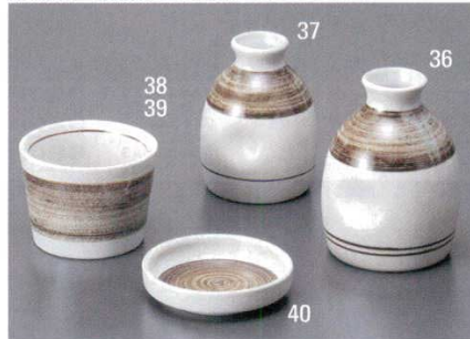
373-36-6C3 730円 茶刷毛目2号そば徳利 (8.5φ×11.5H・360cc) 10入 2363373036 373-37-6C3 650円 茶刷毛目1号そば徳利 (7.5φ×10.5H・250cc) 10入 2363373037 373-38-6C3 530円 茶刷毛目そば千代口(大) (8.5φ×6.5H) 2363373038 373-39-6C3 480円 茶刷毛目そば千代口(小) (7.8φ×6.2H) 2363373039 373-40-6C3 390円 茶刷毛目そば薬味皿 (9.3φ×2H) 2363373040