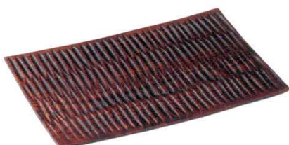
375-40-3S3 2,200円 2339375040 ザルソバ器(長角) (30×21) 中国