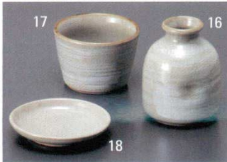
375-16-6B3 780円 1962262045 唐津白ハケメそば徳利 (7.8φ×9.7H・250cc) 10入 375-17-6B3 690円 1962262046 唐津白ハケメそば千代口 (8.5φ×6H) 375-18-6B3 390円 1962262047 唐津白ハケメそば薬味皿 (9.5φ)