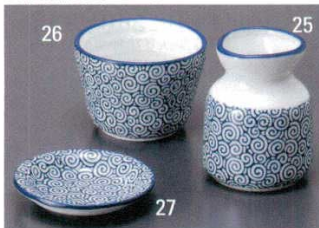
375-25-4B3 570円 1942263044 タコウズそば徳利1号 (7.5φ×9.6H) 375-26-4B3 470円 1942263045 タコウズ千代口 (9.2φ×6.5H) 375-27-4B3 410円 1942263046 タコウズ薬味皿 (9.2φ×1.8H)