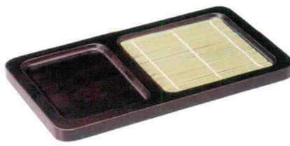
375-38-3S3 4,200円 2339375038 ザルソバ器(大) (39×22.5×3H)