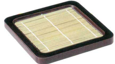
375-39-3S3 3,200円 2339375039 ザルソバ器(小) (23×23×3H)