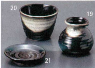
375-19-6A3 730円 2161356036 そば黒そば徳利 (8φ×7.5H・200cc) 20入 375-20-6A3 580円 2161356037 そば黒そば千代口 (9φ×7H) 375-21-6A3 300円 2161356038 そば黒丸小皿 (9.5φ×2H)