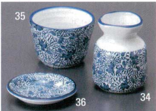
375-34-4B3 570円 1942263041 花唐草そば徳利1号 (7.5φ×9.6H) 375-35-4B3 470円 1942263042 花唐草千代口 (9.2φ×6.5H) 375-36-4B3 410円 1942263043 花唐草薬味皿 (9.2φ×1.8H)