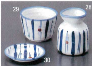
375-28-4B3 570円 1942263038 手描花十草1号そば徳利 (7.5φ×9.6H) 375-29-4B3 470円 1942263039 手描花十草千代口 (9.2φ×6.5H) 375-30-4B3 410円 1942263040 手描花十草薬味皿 (9.2φ×1.8H)