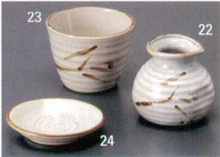
375-22-6A3 660円 2361375022 唐津そば徳利 (8φ×7.5H・200cc) 20入 375-23-6A3 540円 2361375023 唐津そば千代口 (9.5φ×6.5H) 375-24-6A3 280円 2361375024 唐津丸小皿 (9.5φ×2H)