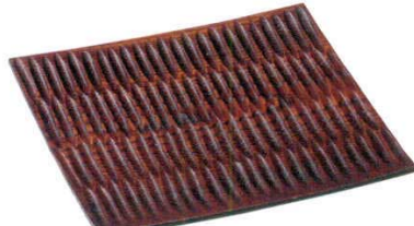
375-41-3S3 2,000円 2339375041 ザルソバ器(角) (21×21) 中国