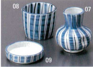
375-07-6A3 800円 2261373025 親子十草そば徳利 (8.5φ×9.5H・190cc) 20入 375-08-6A3 640円 2261373026 親子十草 そば千代口 (8φ×7H) 375-09-6A3 340円 2261373027 親子十草 丸小皿 (8.5φ×2H)