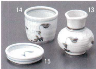
375-13-6A3 800円 2261373031 玉洲花絵 そば徳利 (8.5φ×9.5H・190cc) 20入 375-14-6A3 640円 2261373032 玉洲花絵 そば千代口 (8φ×7H) 375-15-6A3 340円 2261373033 玉洲花絵 丸小皿 (9φ×2H)