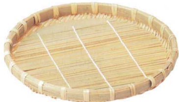
375-37-3S3 550円 2339375037 そばザル(ミス付) (22φ×2.5H)