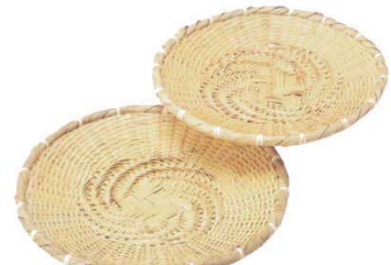
375-42-3S3 1,550円 2339375042 そばザル(大) (24φ×2.5H)