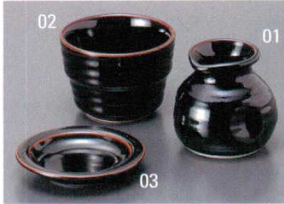
375-01-6A3 850円 2361375001 天目そば徳利 (8.5φ×7.5H・190cc) 20入 375-02-6A3 700円 2361375002 天目段付そば千代口 (9φ×6.5H) 375-03-6A3 430円 2361375003 天目丸小皿 (10φ×1.5H)