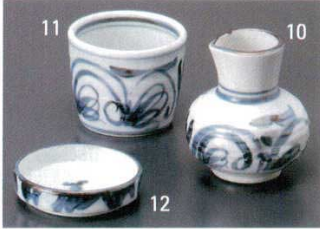
375-10-6A3 800円 2261373028 太唐草 そば徳利 (8.5φ×9.5H・190cc) 20入 375-11-6A3 640円 2261373029 太唐草 そば千代口 (8φ×7H) 375-12-6A3 340円 2261373030 太唐草 丸小皿 (8.5φ×2H)