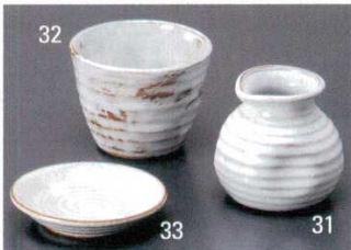
375-31-6A3 660円 2361375031 乳白そば徳利 (8φ×7.5H・200cc) 20入 375-32-6A3 540円 2361375032 乳白そば千代口 (9.5φ×6.5H) 375-33-6A3 280円 2361375033 乳白丸小皿 (9.5φ×2H)