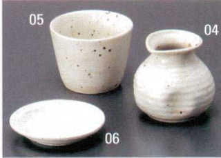
375-04-6F3 800円 2165357010 黄マツ刷毛ソノハ徳利 (8.5φ×7.5H・200cc) 375-05-6F3 670円 2165357011 黄マツ刷毛ソノハ千代口 (8.7φ×7.7H・200cc) 375-06-6F3 460円 2165357012 黄マツ刷毛薬味皿 (9.8φ×1.7H)