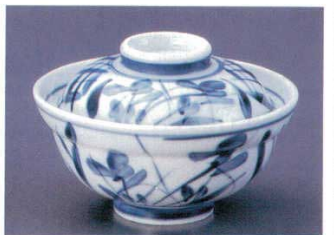
385-25-8F3 1,300円 2385385025 染付間取菊5.0蓋井 (16φ×10.7H)