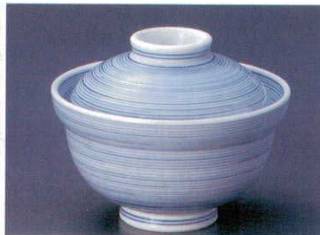
385-10-2F3 1,850円 2325385010 千段駒筋4.5蓋井 (14.2φ×11H) 40入