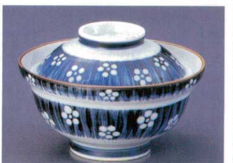
385-32-6H3 770円 2366385032 藍彩梅蓋井 (16φ×10.7H)

和食・洋食 湯呑・茶碗 急須・茶器 和陶・洋陶 和食器 洋食器・碗皿 中華食器 ガラス・金属 漆器 木製製品 神・仏具