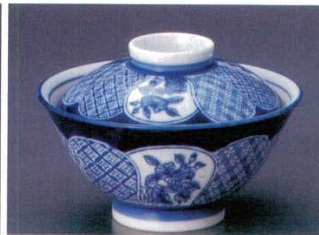
385-05-6A3 2,080円 2161396022 祥瑞丸蓋井 (15.5φ×10.5H) 385-06-6A3 1,340円 2161396023 祥瑞丸蓋井身丈 (15.5φ×7.5H)