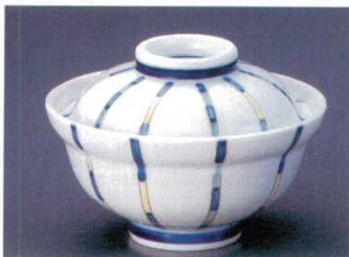
385-16-2H3 1,650円 2226415009 白盛十草5.0蓋井 (16φ×11H)