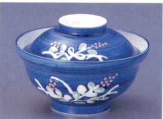
385-28-2H3 800円 2326385028 ルリ萩5.0蓋井 (15.3φ×11H) 385-29-2H3 450円 2326385029 ルリ萩5.0身井 (15.3φ×8H)