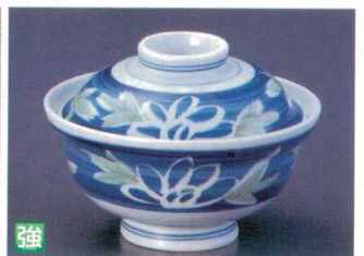
385-17-6E3 1,580円 2264415011 輪菊蓋付蓋井 (15.5φ×11.5H) 385-18-6E3 1,050円 2264415012 輪菊身井 (15.5φ×7.8H)