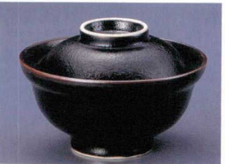
385-26-6E3 980円 2264415030 ゆず天目5.0蓋井 (16φ×11H) 385-27-6E3 600円 2264415031 ゆず天目5.0身井 (16φ×8H)