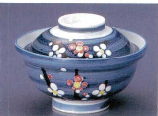
385-30-2H3 800円 2326385030 ゴス梅5.0蓋井 (15.3φ×11H) 385-31-2H3 450円 2326385031 ゴス梅5.0身井 (15.3φ×8H)