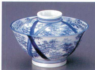
385-11-6A3 1,830円 2161397001 竹林丸蓋井 (15.5φ×10.5H) 385-12-6A3 1,210円 2161397002 竹林丸蓋井身丈 (15.5φ×7.5H)