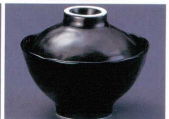
385-13-7C3 2,100円 2173396030 黒マット変型蓋井 (15.5φ×12.5H)