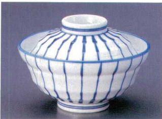
385-23-6A3 1,380円 2161397019 十草(六べ)5.0蓋井 (15.5φ×11H) 385-24-6A3 990円 2161397020 十草(六べ)5.0蓋井身丈 (15.5φ×7.5H)