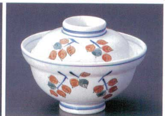
385-07-6A3 2,040円 2161396025 木の葉5.0蓋井 (15φ×11H) 385-08-6A3 1,430円 2161396026 木の葉5.0蓋井身丈 (15φ×8H)