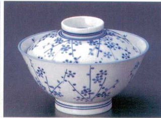
385-03-6A3 1,830円 2161396031 小梅ちらし丸蓋井 (15.5φ×10.5H) 385-04-6A3 1,190円 2161396032 小梅ちらし丸蓋井身丈 (15.5φ×7.5H)