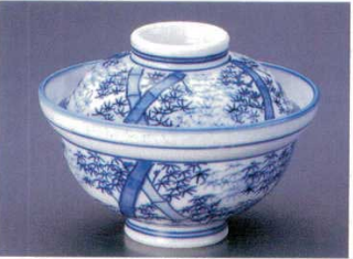
385-19-6A3 1,540円 1961357011 竹林5.0蓋井 (15φ×11H) 385-20-6A3 1,090円 2161397008 竹林5.0蓋井身丈 (15φ×8H)