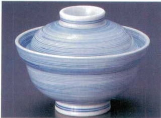
385-09-2F3 2,000円 2325385009 千段駒筋5.0蓋井 (15.7φ×12H) 36入