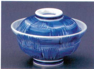
385-15-2H3 1,650円 2226415010 刷毛市松5.0蓋井 (16φ×11H)