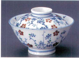
385-01-6A3 2,200円 2161396020 赤入小梅丸蓋井 (15.5φ×10.5H) 385-02-6A3 1,410円 2161396021 赤入小梅丸蓋井身丈 (15.5φ×7.5H)