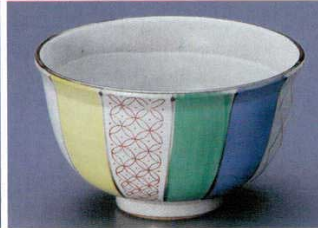
398-28-2F3 1,900円 1925345011 紙風船5.0多用井 (15.3φ×8.7H)