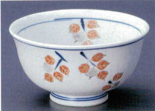
398-04-6A3 1,980円 2161383010 木の葉5.0反井 (15.5φ×8H)