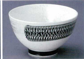
398-33-5E3 1,600円 2354398033 トチリ5.0多用井 (15.2φ×9H)