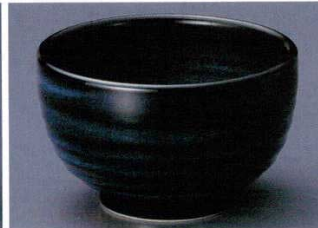
398-32-2B3 1,870円 2322398032 雲竜黒5.0多用井 (16φ×10.5H) 60入