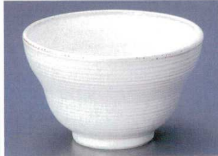
398-20-2H3 1,900円 2326398020 粉引瓢5.5井 (17.8φ×11H) 398-21-2H3 1,500円 2326398021 粉引瓢5.0井 (16φ×10H) 398-22-2H3 1,000円 2326398022 粉引瓢小井 (13φ×9.2H)