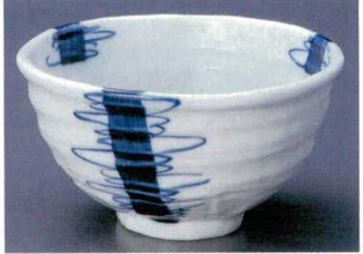
398-09-2F3 1,980円 2025327022 つる巻十草変型井(大) (17×16.5×9H) 398-10-2F3 1,400円 2025327023 つる巻十草変型井(中) (14×13×8.5H) 398-11-2F3 1,100円 2025327024 つる巻十草変型井(小) (13×12×7H)