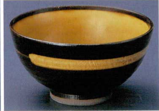
398-29-1A3 1,890円 2311398029 光陰大井 (15.9φ×8.5H)