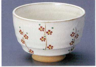
398-15-1B3 1,900円 2012337013 赤絵香叶花4.5深鉢 (13.8φ×2H)