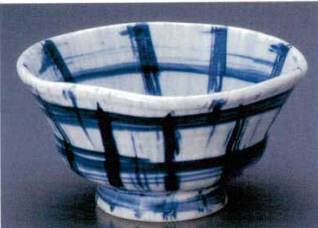
398-01-8F3 2,000円 2185370027 さら格子5.0手びねり井 (18.5×18.5×9.3H) 398-02-8F3 1,500円 2185370028 さら格子5.5手びねり井 (16.5×16.5×8.8H) 398-03-8F3 1,100円 2185370029 さら格子4.5手びねり井 (13.8φ×7H)

別冊内付小冊子 焼風和皿・和碗 酒器・茶器 井茶碗 急須・茶器 和陶・オーブン 耐熱・萬古焼 洋食器・碗皿 中華食器 ガラス・金属 茶道具 雑器 木・竹製品 神・仏具