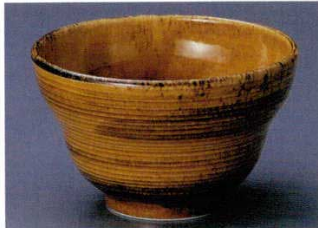
398-17-2H3 1,900円 2326398017 絵斑点瓢5.5井 (17.8φ×11H) 398-18-2H3 1,500円 2326398018 絵斑点瓢5.0井 (16φ×10H) 398-19-2H3 1,000円 2326398019 絵斑点瓢小井 (13φ×9.2H)