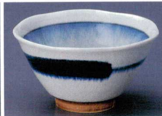
398-31-1A3 1,890円 2111383013 御深井5.0井 (16φ×8.7H)