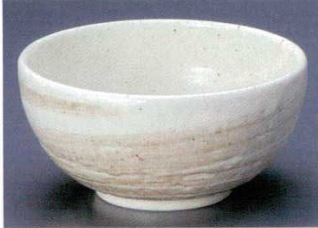
398-05-8F3 2,000円 2385398005 東風石目6.0井 (19.5φ×9.6H) 398-06-8F3 800円 2385398006 東風石目5.0井 (15.5φ×7.7H) 398-07-8F3 650円 2385398007 東風石目4.2井 (13φ×7.5H) 398-08-8F3 480円 2385398008 東風石目4.0井 (12.5φ×7.2H)