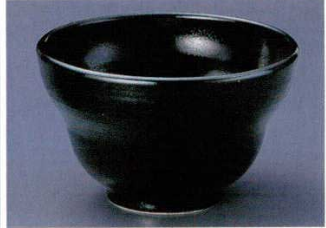
398-23-2H3 1,600円 2326398023 柚子天目瓢5.5井 (17.8φ×11H) 398-24-2H3 1,300円 2326398024 柚子天目瓢5.0井 (16φ×10H) 398-25-2H3 900円 2326398025 柚子天目瓢小井 (13φ×9.2H)