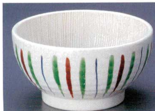
398-30-5E3 1,900円 2354398030 刻み色十草5.5釜上井 (17φ×9H)