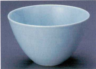
398-12-6F3 1,950円 2165375023 青磁深口5.5井 (17φ×10.3H)