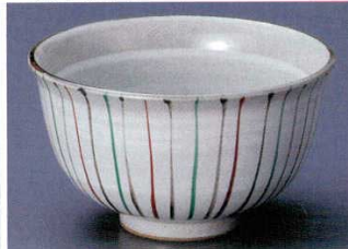
398-27-2F3 1,900円 1925345010 十草5.0多用井 (15.3φ×8.7H)