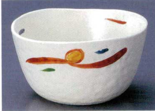
398-13-1K3 1,920円 2117383015 手描赤絵5.0丸中井 (15φ×8H)