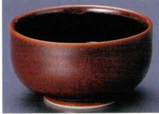
398-14-6A3 1,930円 1961344017 外赤内黒5.0深鉄鉢井 (15.5φ×8.5H)