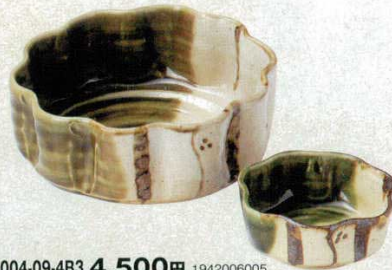
004-09-4B3 4,500円 1942006005 織部花型刺身鉢(手造) (15φ×6.5H) 004-10-4B3 2,300円 1942006006 織部花型千代口(手造) (9φ×3.5H)