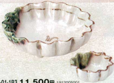
004-01-1B3 11,500円 1912005001 織部瀨ひねり向付 (17φ×5.2H) 004-02-1B3 3,600円 1912005002 織部瀨ひねり千代口 (8.4φ×3H)