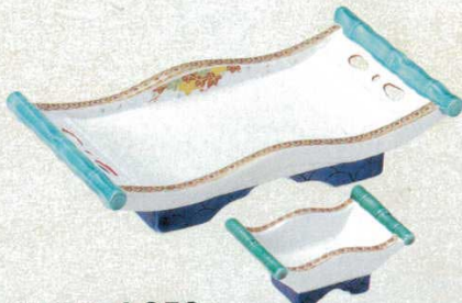
004-07-4B3 4,950円 1942005005 透し竹瀝春秋刺身 (23.5×14×5.5H) 004-08-4B3 1,300円 1942005006 透し竹瀝春秋千代口 (9.3×6.8×4.2H)