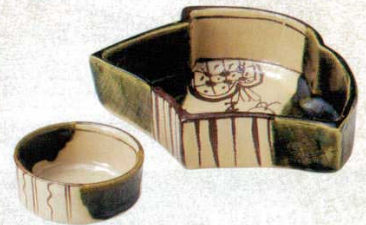
004-05-2A3 4,970円 1921004001 赤津焼織部つる花千鳥刺身鉢 (16×12×4H) 004-06-2A3 1,490円 1921004002 赤津焼織部つる花丸千代口 (7φ×3.3H)