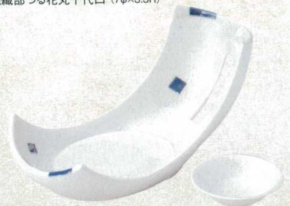
004-11-6F3 3,700円 2265020004 白花ラスター片上り向付 (27×12.5×11H) 004-12-6F3 980円 2365004012 ラスター反千代口 (8.5φ×2.3H)