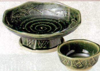
004-03-6A3 5,000円 2161006001 手造織部5.0八角高台皿 (15×15×5.5H) 004-04-6A3 1,480円 2161006002 手造織部八角千代口 (8×8×4H)