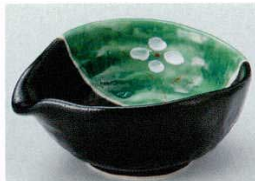
040-25-2B3 1,150円 2322040025 黒グリーン梅片口4.0小鉢 (14.3×11.5×6.3H) 80入