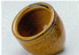
040-34-2A3 1,230円 2321040034 雲海三方小鉢(大) (12×11.7×6H)