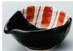
040-23-2B3 1,060円 2322040023 黒麦わら手片手4.0小鉢 (14.3×11.5×6.3H) 80入