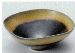
040-12-7Y3 1,300円 2178046005 美濃焼黒窯変浅鉢 (13.5×13.5×5H) 1入