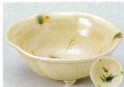
040-13-6A3 1,160円 1961037019 黄瀬戸草文彫三ツ足4.0鉢 (13φ×5H)