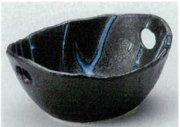
040-09-2A3 1,220円 2221041007 乱れ格子中鉢 (15.8×13.5×6.7H)