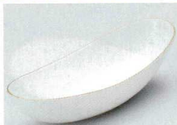
040-01-6F3 1,230円 2365040001 白マット楕円小鉢 (16×6×4H)