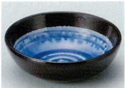
040-20-6F3 1,150円 1965149010 鉄砂ゴス小鉢 (12.6φ×4H)