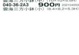
040-37-2K3 1,150円 2027043036 吹墨笠形小鉢(大) (14×12.3×6.5H) 中皿