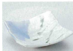
040-17-6A3 1,160円 2261495078 清流織部ちらし角鉢 (13×13×4.5H)