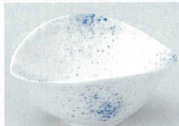
040-33-2H3 600円 2326040033 漆染リップル11cm角ポウル (11.2φ×2.7H)