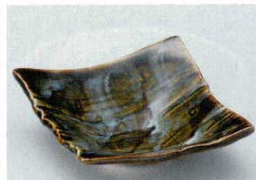
040-18-6A3 1,160円 2261514028 うのふ織部角鉢 (13×13×4.5H)