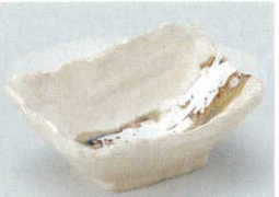
040-16-6H3 1,150円 2266040035 月虹ちぎり小鉢 (13.5×10×6H)