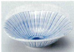
040-19-7C3 1,150円 1973049020 千本十草なぶり小鉢 (13.5×13×4H)