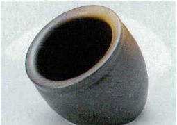
040-35-2A3 1,000円 2321040035 雲海三方小鉢(中) (11.0×10×5.5H)