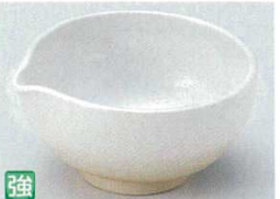
040-05-6A3 1,210円 2161048013 粉引白吹(片口)4.0井 (12.5×12×6H)