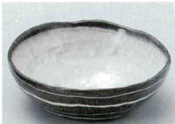
040-08-1A3 1,220円 2311040008 如意5.0鉢 (14.7φ×5H)