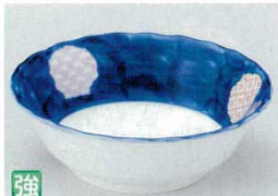
040-14-7C3 1,200円 1973048010 ダミ丸紋祥瑞4.5小鉢 (13.5φ×4.5H)