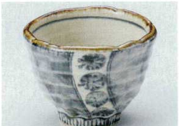
040-15-2F3 1,180円 1925048020 祥瑞3.5深鉢 (10.6φ×7.8H)