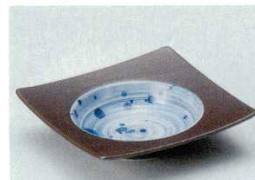
040-31-2H3 1,150円 2326040031 漆染リップル14cm角ポウル (14.2φ×3.5H)