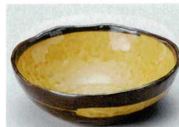
040-22-1A3 1,130円 2311040022 光明5.0鉢 (14.7φ×5H)