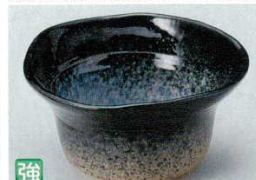
040-32-2A3 850円 2326040032 漆染リップル12cm角ポウル (12.2φ×3.1H)