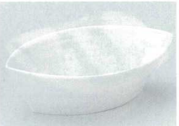
040-21-1A3 1,130円 2211041023 蒼ポウル(中) (15.8×9.3×4.6H)