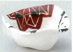
040-11-7Y3 1,200円 2378040011 美濃焼朱巻鉄とび小鉢 (12φ×5.5H) 1入