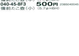
040-40-2B3 1,200円 2322040040 鉛斑点たこ壺(大) (10.5φ×11.3H) 80入