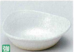
040-04-1A3 1,220円 2211040024 白山三角4.0鉢 (14.5×14.5×4H)