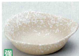
040-06-1A3 1,220円 2211040023 白吹三角4.0鉢 (14.5×14.5×4H)