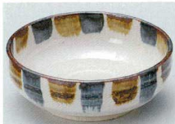
040-02-6F3 1,250円 1965148016 十草小鉢 (12φ×4.5H)