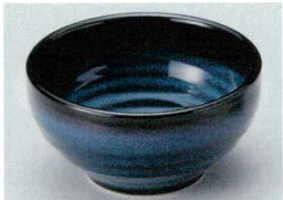
040-27-2B3 1,160円 2322040027 雲竜黒4.0なつめ小鉢 (13.2φ×7H) 80入