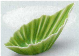
040-03-6F3 1,230円 2365040003 菱菊型前菜皿 (20.2×8×8H)