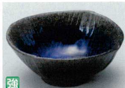
040-07-6A3 1,210円 2361040007 伊賀苧り釉戸締小鉢 (12×11.5×4.5H)