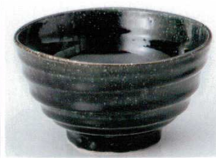
408-22-2K3 580円 2327408022 黒織部変形5.0多用井 (15φ×8H)