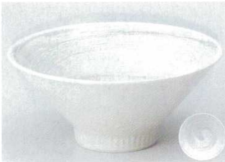
408-20-4E3 860円 2344408020 早瀬白6.3高台井 (19.2φ×8.3H)