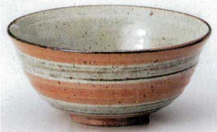
408-10-3C3 1,800円 2233402012 古里(赤)多用井 (18φ×8H)