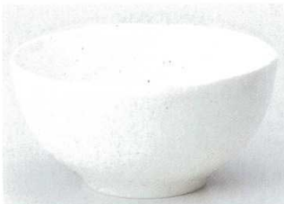
408-24-2C3 500円 2323408024 雪粉引大井 (16φ×8H)