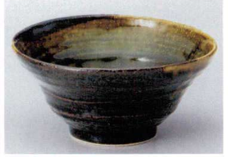
408-09-7F3 1,700円 2275403002 黒唐津オリベ流5.8そば丼 (17.5φ×8.1H)