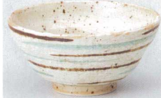
408-12-7C3 1,500円 1973353003 黄マット二色ライン 5.5お好み碗 (17.5φ×8.5H) 408-13-7C3 1,200円 1973353004 黄マット二色ライン 5.0お好み碗 (15.5φ×8.3H) 408-14-7C3 900円 1973353005 黄マット二色ライン4.5お好み碗 (13φ×8H)