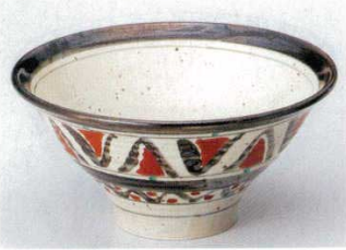
408-01-2H3 3,700円 2226402001 上絵古代紋7.0反井 (21.5φ×10.4H) 408-02-2H3 2,900円 2226402002 上絵古代紋6.0反井 (18.5φ×9.8H) 408-03-2H3 2,430円 2226402003 上絵古代紋5.0反井 (15.5φ×8.9H)