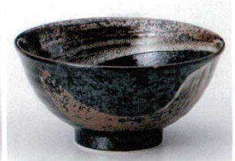
408-27-3B3 480円 2332408027 明世荒刷毛5.0和井 (16φ×8H)