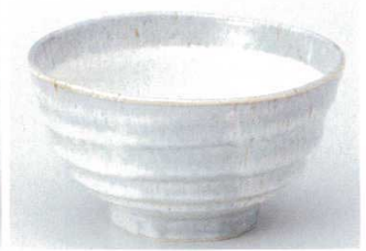
408-23-2K3 580円 2327408023 まゆ変形5.0多用井 (15φ×8H)