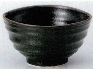
408-25-2K3 570円 2227401025 彩鉢5.0多用井(ゆず天目) (15φ×8.4H)