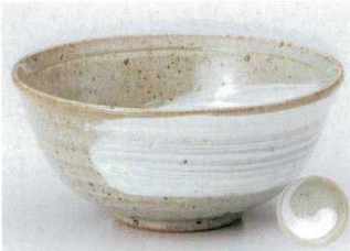
408-16-3C3 1,550円 2233402014 唐津白化粧多用井 (18φ×8H)