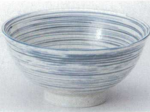
408-21-3B3 540円 2232399019 細刷毛目5.0和井 (16φ×8H)