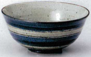
408-11-3C3 1,800円 2233402011 古里(青)多用井 (18φ×8H)