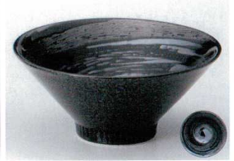
408-19-4E3 860円 2344408019 早瀬黒6.3高台井 (19.2φ×8.3H)