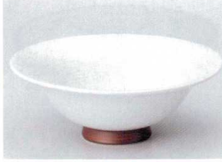
408-06-6F3 2,100円 2265402004 白化粧7.0反型 (22φ×8H) 408-07-6F3 1,450円 2265402005 白化粧5.5反型 (18φ×7H) 408-08-6F3 1,100円 2265402006 白化粧4.5反型 (14φ×5.5H)