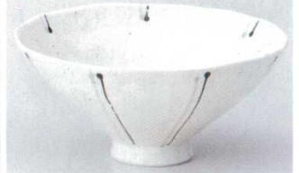
408-15-6H3 1,600円 2266402008 十草大鉢 (19φ×8.5H)