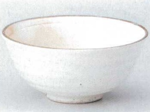
408-17-3C3 1,550円 1933345015 桃山粉引多用井 (17.5φ×8.3H)