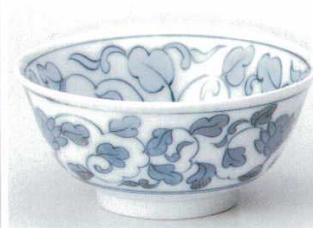
408-26-2C3 450円 1923351029 草花4.8多用井 (15φ×7H)