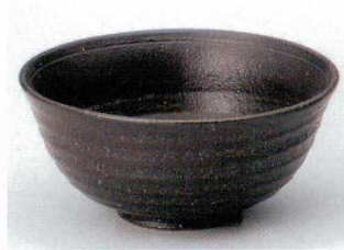
408-18-3C3 1,550円 1933345016 鉄彩釉多用井 (17.8φ×8H)