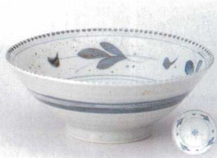
409-02-2K3 780円 1927353026 益子つた6.3井 (19φ×7.4H) 409-03-2K3 500円 1927353027 益子つた5.8井 (17.5φ×7.3H)