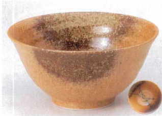
409-01-2C3 1,050円 2123371047 信楽おりべ6.5反井 (19.8φ×9.7H)