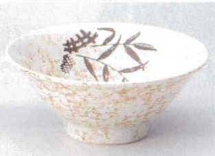
409-14-3B3 560円 2232403020 磁器志野笹6.5ソバ井 (19.5φ×8H) 409-15-3B3 490円 2232403021 磁器志野笹5.8ソバ井 (18φ×7.5H)