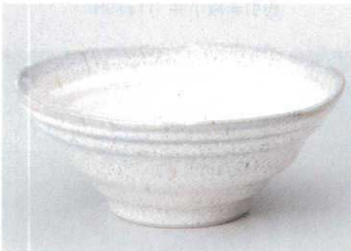
409-23-2K3 430円 2327409023 まゆ6.0彩鉢 (18φ×7H)