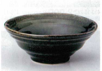
409-22-2K3 430円 2327409022 黒織部6.0彩鉢 (18φ×7H)