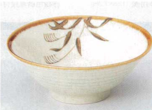
409-25-2K3 340円 1927353016 梨地スキ5.8井 (18.2φ×7.8H)