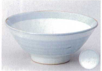
409-06-2K3 740円 1927353024 グレー巻6.3井 (20φ×8H) 409-07-2K3 480円 1927353025 グレー巻5.8井 (18φ×7H)