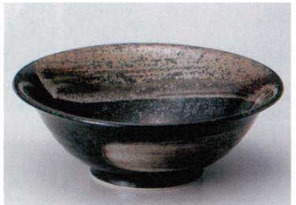
409-18-3B3 560円 2332409018 明世荒刷毛6.3反和井 (19.9φ×7H)