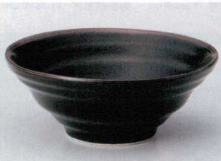
409-24-2K3 420円 2227403028 彩鉢6.0井(ゆず天目) (18φ×7H)