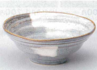
409-20-2K3 430円 2227403026 彩鉢6.0井(均紫) (18φ×7H)