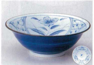
409-12-3B3 580円 2232379026 紺巻里の秋6.3反和井 (19.7φ×7H)