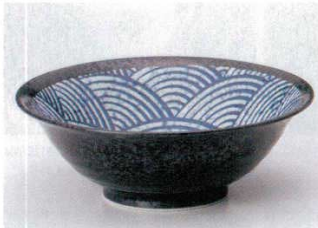
409-08-4E3 690円 2144380018 青海波6.3和井 (19.5φ×7H)