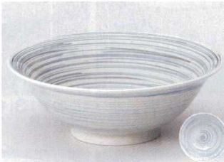
409-11-3B3 580円 2232379025 細刷毛目6.3反和井 (19.7φ×7H)