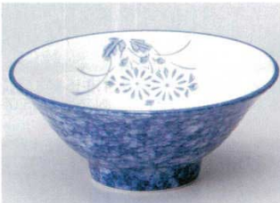
409-16-3B3 560円 2232403018 淡雪菊6.5ソバ井 (19.5φ×8H) 409-17-3B3 490円 2232403019 淡雪菊5.8ソバ井 (18φ×7.5H)