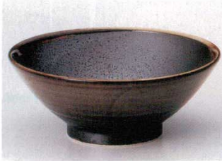
409-04-3B3 930円 2132381014 明世黒6.5そば井 (19.3φ×7.6H) 409-05-3B3 620円 2132381015 明世黒5.8そば井 (17.5φ×7H)