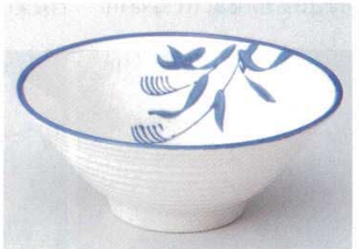
409-26-2K3 340円 1927353017 アワ雪スキ5.8井 (18.2φ×7.8H)

和食器 茶碗 急須 茶器 和陶 お返し 刺繍 風呂敷 洋食器 磁器 中華食器 カブス 金庫 茶道具 雑器 木竹製品 神仏具