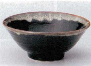
409-09-2K3 680円 1927353028 天目流6.3井 (20φ×8H) 409-10-2K3 430円 1927353029 天目流5.8井 (18φ×7H)