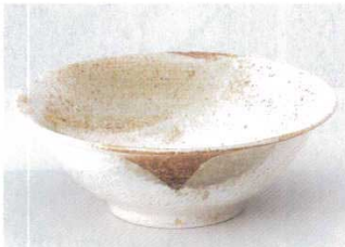
409-13-3B3 570円 2332409013 雪志野6.3反和井 (19.9φ×7H)