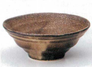
409-21-2K3 430円 2227403024 彩鉢6.0井(茶) (18φ×7H)