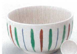
414-17-5E3 1,050円 2354414017 刻み色十草多用碗(小) (12.7φ×7.1H)