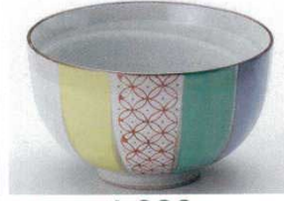
414-30-2F3 1,000円 1925350029 紙風船多用碗 (12.5φ×7.3H)