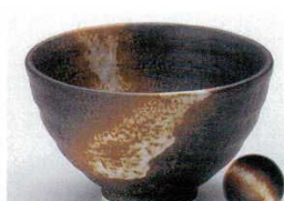
414-13-4A3 1,100円 2141391023 黒備前茶漬碗 (13.2φ×7.9H)