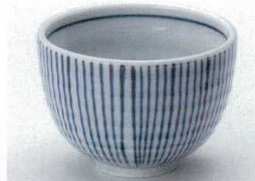
414-25-6F3 1,000円 2365414025 手描き細十草小井 (12φ×8.5H)