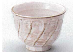
414-23-2B3 1,000円 2322414023 粉引ねじり小井 (12.7φ×9.1H) 60入