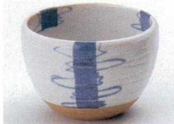
414-07-2F3 1,150円 2025338027 つる巻十草姫井 (11φ×8H)