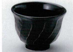
414-24-2B3 900円 2322414024 柚子天目ねじり小井 (12.7φ×9.1H) 60入