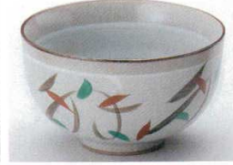
414-28-2F3 1,000円 1925350027 唐草多用碗 (12.5φ×7.3H)