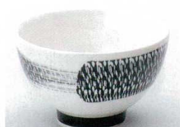
414-18-5E3 1,050円 2354414018 トチリ茶漬碗 (12.8φ×7.6H)