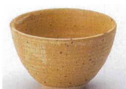
414-15-7E3 1,050円 2174395006 黄河多用碗 (11.2φ×7.2H)