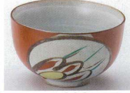
414-29-2F3 1,000円 1925350030 丸紋多用碗 (12.5φ×7.3H)