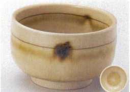
414-06-1A3 1,130円 2311414006 なごみ多用碗 (13.3φ×8.2H)