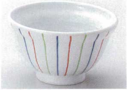
414-11-2B3 1,100円 2122391002 色十草ライス井 (13.7φ×8H)