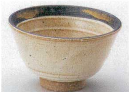
414-04-3B3 1,150円 2332414004 粉引金彩雲多用井 (14φ×8.5H)