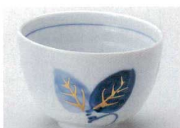
414-14-6F3 1,050円 1965351001 金木の葉多用井 (11.8φ×8H)