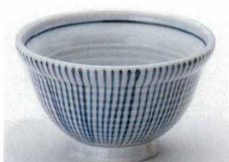
414-03-6F3 1,150円 2365414003 手描き細十草段付ライス井 (13.7φ×8H)