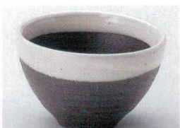
414-16-7E3 1,050円 2174395005 黒雪化粧多用碗 (11.3φ×7.2H)