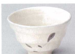
414-12-2C3 1,100円 2023463051 粉引木の葉小井 (13φ×8H)