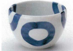
414-08-2F3 1,150円 1925350006 呉須丸紋姫井 (10.6φ×7.7H)