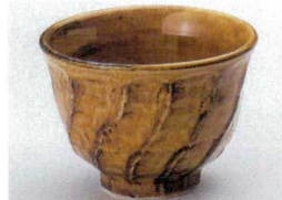
414-22-2B3 1,000円 2322414022 飴斑点ねじり小井 (12.7φ×9.1H) 60入