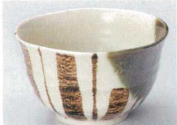
414-21-4A3 1,000円 2241409024 織部十草多用碗 (13φ×8H)