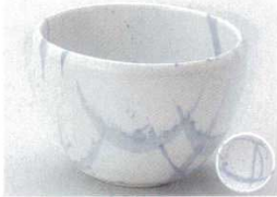
414-09-2F3 1,150円 1925350007 白マット呉須散し姫井 (11φ×7.7H)