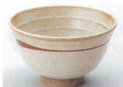
414-20-3B3 1,000円 2132391011 朱一文字多用井 (14φ×8.2H)