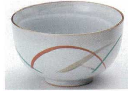
414-27-2F3 1,000円 1925350031 芦多用碗 (12.5φ×7.3H)