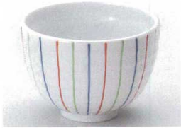
414-10-2B3 1,100円 2122391003 色十草小井 (12φ×8.5H)