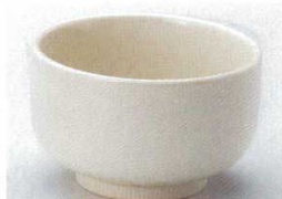
414-19-1A3 1,040円 2311414019 乳白多用碗 (13.3φ×8.2H)