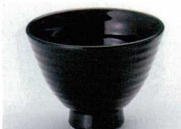
414-01-2B3 1,150円 2222404024 黒釉高台井(大) (13.2×13.2×9.7H) 414-02-2B3 960円 2222404025 黒釉高台井(小) (12.3×12.3×9H)

例身向付茶碗 拾遺和皿・和碗類 酒器・茶器 井茶碗 急須・茶器 和陶・オーブン 耐熱・萬古焼 洋食器・碗皿 中華食器 ガラス・金属 茶道具 雑器 木・竹製品 神・仏具