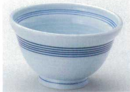
414-26-8F3 930円 2385414026 五線ライス井 (13.6φ×8H)