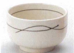
414-05-1A3 1,130円 2311414005 平和多用碗 (13.3φ×8.2H)