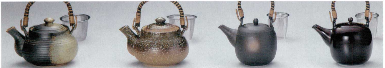
442-05-3Y3 3,200円 2138433020 萬古焼備前風4号土瓶(カゴアミ付) (13.5φ×8.5H・700cc) 1入