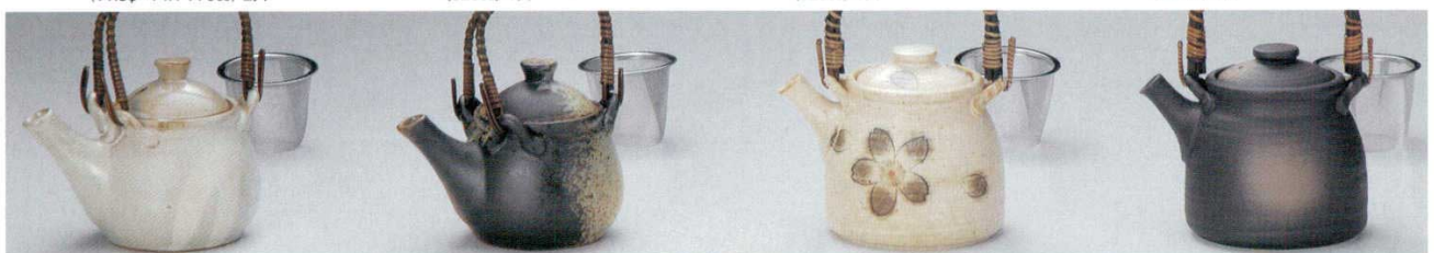
442-13-3Y3 2,700円 2038388004 萬古焼うのふツル付土瓶(カゴアミ付) (10φ×10H・400cc) 1入