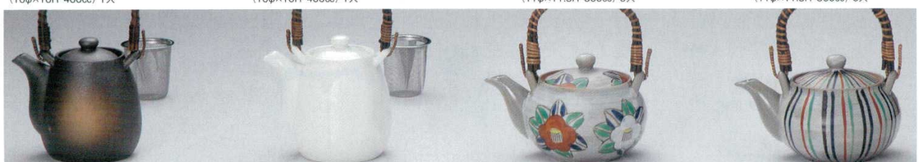
442-17-1B3 2,480円 2012379025 黒伊賀土瓶(アミ付) (480cc) 6入