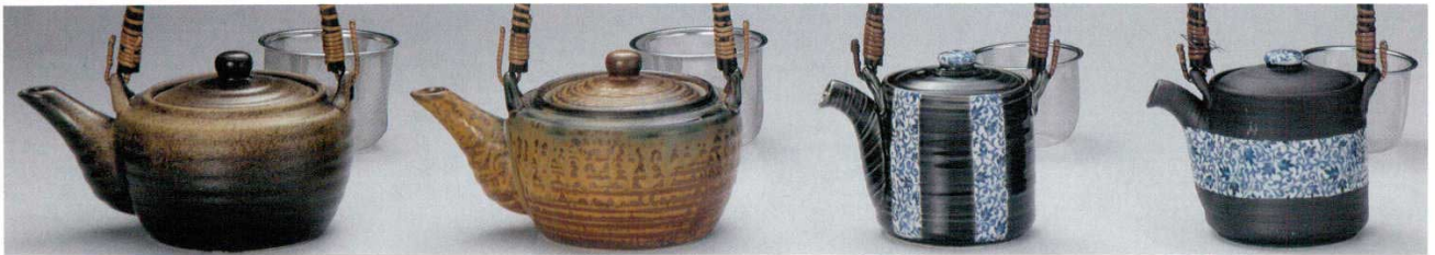
442-01-6C3 3,600円 2363442001 備前風8号土瓶(アミ付) (16φ×12H・1500cc) 1入

刺身・寿司・小鉢・盛鉢 味噌・和風・大皿・盛鉢 酒器・茶器 井・茶碗 急須・茶器 和陶・オーブン 耐熱・萬古焼 洋食器・碗皿 中華食器 カマエ・金属 茶道具 雑器 木・竹製品 神・仏具