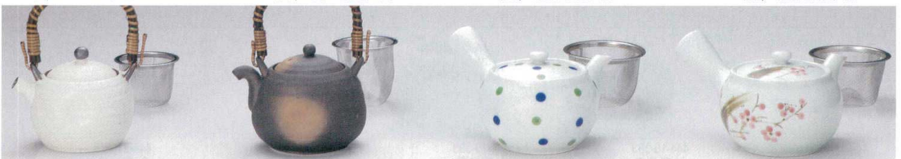
443-13-8F3 2,000円 2385443013 白伊賀玉土瓶 (9φ×9H・230cc) 5入