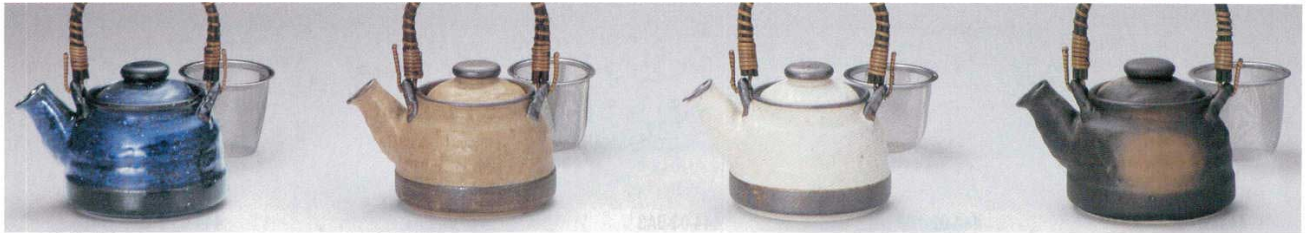
443-01-4E3 2,450円 1944395003 蔵出し土瓶(アイ)(茶こし付) (11.6×10.4・480cc) 6入