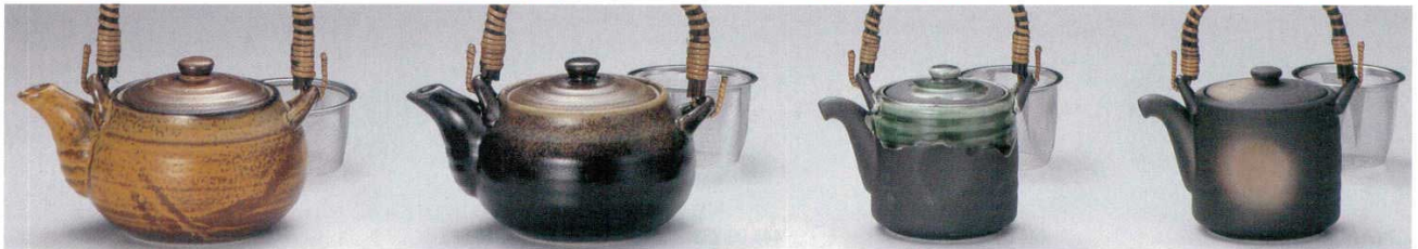
443-05-6C3 2,400円 2363443005 伊羅保4号土瓶(アミ付) (13.5φ×10H・700cc) 1入