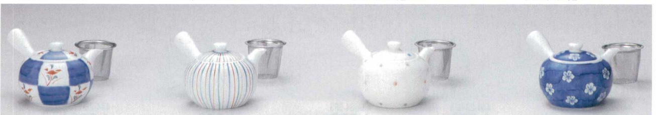
443-17-6F3 850円 2265459027 市松小花ミニ急須 (200cc) 1入 中国