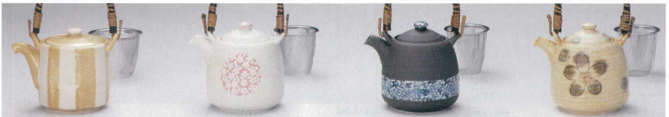
443-09-3B3 2,350円 2132434018 白伊賀十草筒土瓶(アミ付) (9φ×9.5H・290cc) 1入