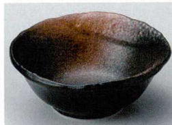
046-18-2C3 660円 2323046018 緋色小鉢 (13.5φ×5H)