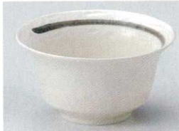
046-08-2C3 680円 2223046028 魂(墨)4.5ボール (13.5φ×7H)