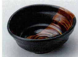
046-04-2B3 700円 2322046004 漆流し変形小鉢 (13.8×12.2×5.8H) 100入