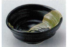
046-05-2B3 700円 2322046005 織部流し変形小鉢 (13.8×12.2×5.8H) 100入 046-06-2B3 400円 2322046006 織部流し変形小付 (8.7×7.5×3H) 200入