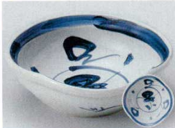
046-02-7C3 700円 1973053026 古染変形4.0小鉢 (12φ×4.5H)