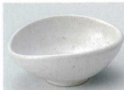
046-22-4E3 650円 2344046022 白釉たまご型4.0小鉢 (14.3×12×6H)