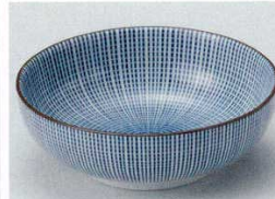
046-15-2B3 680円 2222049007 千段十草4.0ボール (13×4.5H)