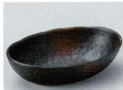
046-23-7E3 650円 2174039007 黒伊賀楕円ペーカ(小) (15.9×10.8×4.1H)