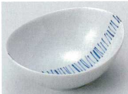
046-07-5E3 690円 2154054034 さんばし 楕円小鉢 (13×11×5.3H)