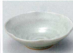
046-20-4A3 660円 2141053027 白雲平小鉢 (13.6φ×4.2H)