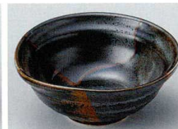
046-30-3H3 630円 1936039022 山がすみなぶり4.5小鉢 (14×13.5×5.5H)