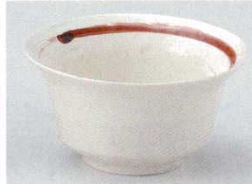
046-09-2C3 680円 2223046027 魂(紅)4.5ボール (13.5φ×7H)