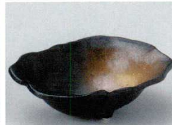
046-19-8F3 660円 2385046019 黒備前三足長小鉢 (15×11×5H)