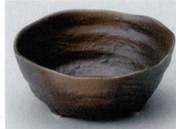
046-10-1B3 680円 2012048018 黒備前小鉢 (12.4φ×5.3H)