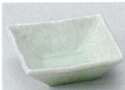
046-12-5E3 680円 2154072037 もえぎ正角浅小鉢 (11.3×11.3×4H)