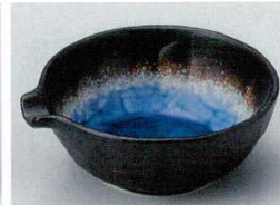
046-25-7F3 650円 1975055018 深海片口小鉢 (13.3×12×4.8H)