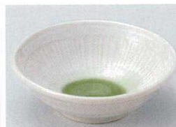
046-28-5E3 640円 2254049002 うのふグリーン小鉢 (12.5φ×4.2H)