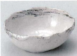
046-01-2C3 700円 2123053005 京化粧小鉢 (15×13×5.5H)