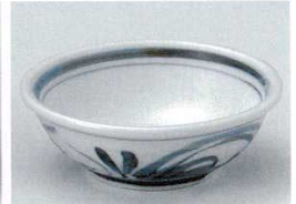
046-26-6A3 640円 2261049027 太唐草 4.0玉潤玉割 (12.5φ×4.5H)