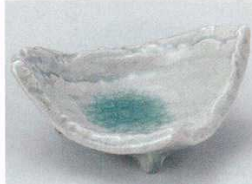
046-03-7F3 700円 2275047021 灰糞入14cm三角鉢 (14.5×12×5.8H)