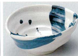
046-29-8F3 630円 2385046029 呉須刷毛たわみ小鉢 (13.8×12×6H)