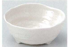
046-16-1B3 680円 2012048019 粉引クリーム小鉢 (12.4φ×5.3H)