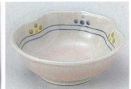
046-31-3H3 480円 1936039023 山がすみなぶり3.8小鉢 (12×11.5×4.8H)