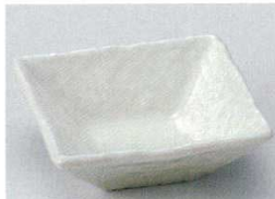
046-13-5E3 680円 2154072038 黄磁正角浅小鉢 (11.3×11.3×4H)