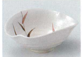
046-11-3H3 680円 1936053024 芦絵押し上げ小鉢 (13.4×10.5×5.4H)