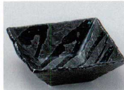
046-14-5E3 680円 2154072036 黒織部流正角浅小鉢 (11.3×11.3×4H)