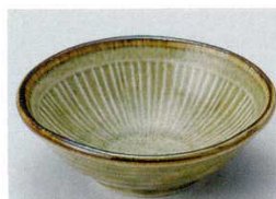
046-27-5E3 640円 2254049003 測鏝灰釉小鉢 (12.5φ×4.2H)