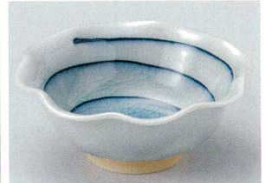
046-21-2A3 650円 1921054008 うず潮4.0花型小鉢 (12.3φ×5H)