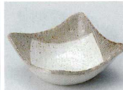
046-24-4E3 650円 2144055005 白唐津マス入4.2角鉢 (12.8×12.8×5H)