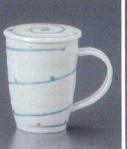
460-21-5E3 1,500円 2354460021 色彩水玉蓋付マグ (8φ×10.8H) 10入