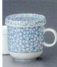
460-26-1E3 1,000円 2114450023 京桜やすらぎカップ(陶製茶コン付) (7.7φ×9H) 10入