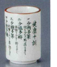
460-39-4E3 530円 2344460039 健康十訓寿司湯呑 (7φ×10.3H) 10入