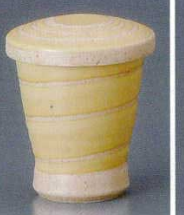
460-14-1B3 960円 2312460014 黄色うず蓋付湯呑 (7.4φ×10H)