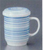
460-28-1E3 1,000円 2014407031 コス巻白樺ウーロン茶 (7φ×10H) 10入