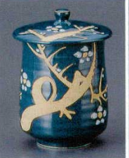
460-03-1E3 1,270円 1914414006 青天目梅木蓋付寿司 (9φ×12H) 10入