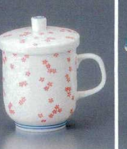
460-23-1E3 1,000円 2214464023 ウス桜蓋付マグ(ピンク) (6.5φ×9.5H・180cc) 10入