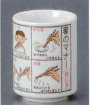
460-35-5E3 500円 2254463029 箸のmana-寿司湯呑 (7.3φ×9.5H) 10入