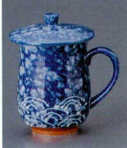
460-19-1E3 1,250円 2014407012 紺青海波ウーロン茶 (7.5φ×12H) 10入