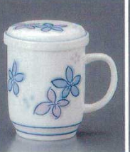
460-29-1E3 1,000円 1914536034 おし花ウーロン茶 (7φ×10H) 10入