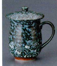
460-18-1E3 1,250円 2014407013 黒青海波ウーロン茶 (7.5φ×12H) 10入