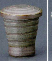
460-15-1B3 960円 2312460015 グレーうず蓋付湯呑 (7.4φ×10H)