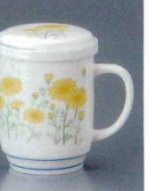
460-32-1E3 1,000円 2114450035 カモミールウーロン茶 (7φ×10H) 10入