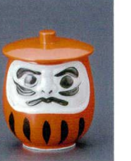
460-08-4E3 1,150円 2344460008 赤ダルマ蓋付湯呑(小) (8φ×10H) 8入