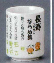
460-37-5E3 500円 2254463030 長寿のためならぬ寿司湯呑 (7.3φ×9.5H) 10入