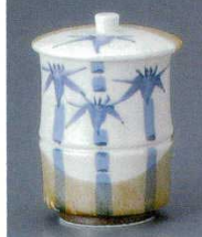
460-10-1E3 1,200円 2314460010 ヌリ分唐津竹笠蓋付寿司 (7.2φ×10.8H) 10入