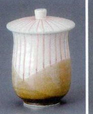
460-05-1E3 1,200円 2314460005 ヌリ分唐津十草フタ付寿司(赤) (7.5φ×12H) 10入