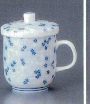
460-22-1E3 1,000円 2214464022 ウス桜蓋付マグ(ブルー) (6.5φ×9.5H・180cc) 10入