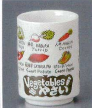
460-34-5E3 550円 2254463023 野菜英語切立中寿司 (7.2φ×10.2H) 10入