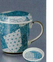
460-24-2C3 1,050円 2123703031 古紋蓋付マグ (9φ×10H・220cc) 10入