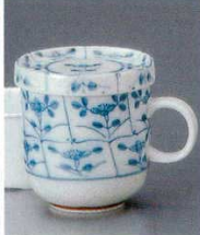
460-27-1E3 1,000円 2114450024 なすなやすらぎカップ(陶製茶コン付) (7.7φ×9H) 10入