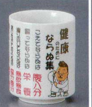
460-36-5E3 500円 2254463028 健康のためならぬ寿司湯呑 (7.3φ×9.5H) 10入