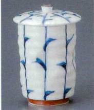
460-11-1E3 1,150円 2314460011 立花二・三蓋付寿司 (6.7φ×11.5H) 10入