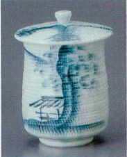
460-02-1E3 1,270円 1914414005 トチリ山水蓋付寿司 (9φ×12H) 10入