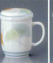
460-31-1E3 1,000円 1914536036 イチヨウウーロン茶 (7φ×10H) 10入