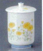
460-12-1E3 1,050円 2114450013 カモミール蓋付寿司 (7φ×11.2H) 10入