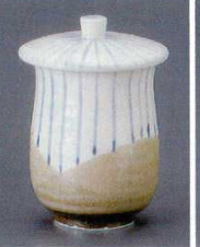
460-04-1E3 1,200円 2314460004 ヌリ分唐津十草フタ付寿司(青) (7.5φ×12H) 10入