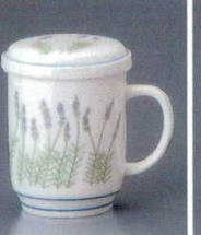
460-30-1E3 1,000円 1914536035 ラベンダーウーロン茶 (7φ×10H) 10入