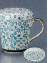
460-16-2C3 1,050円 2123703031 京唐草蓋付マグ (9φ×10H・220cc)