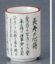
460-38-4E3 530円 2344460038 長寿の心得寿司湯呑 (7φ×10.3H) 10入