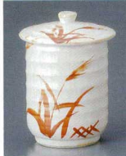
460-01-6E3 1,580円 2264464003 志野芦蓋付寿司湯呑 (8φ×12.8H) 8入

和食・洋食・小鉢・お茶碗 和食・和風・和風・和風 酒樽・酒樽・酒樽 急須・茶器 和陶・陶器 耐熱・菓子焼 洋食器・碗皿 中華食器 ガラス・金属 茶道具 雑器 木竹製品 神・仏具