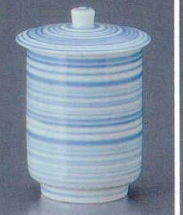
460-13-1E3 1,050円 2114450009 コス巻白樺蓋付寿司 (7φ×11.2H) 10入