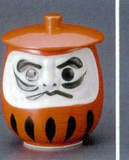
460-06-4E3 1,230円 2344460006 赤ダルマ蓋付湯呑(大) (9φ×11.5H) 8入