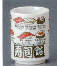
460-33-5E3 550円 2254463025 寿司ネタ英語切立中寿司 (7.2φ×10.2H) 10入