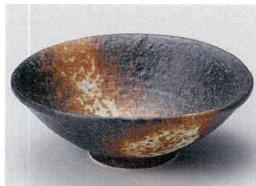
047-06-6A3 620円 2161056025 いぶし備前平小鉢 (13φ×4.5H)