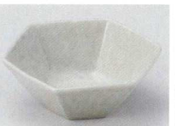
047-20-8F3 560円 2385047020 費入六角4.5鉢 (14.7×13.2×5.2H)