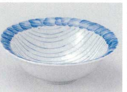
047-25-2C3 540円 2323047025 モダンライン4.5鉢 (14.5φ×5H)