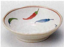
047-03-2B3 630円 1922237016 粉引とうがらし4.0浅鉢 (13.5φ×3.8H)