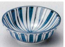
047-19-6A3 570円 2361047019 親子十草4.0玉割玉割 (12.5φ×4.5H)