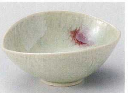
047-24-8F3 550円 2385047024 青磁費入布目楕円小鉢 (13×11×5.5H)