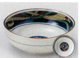
047-10-1H3 600円 2216049001 風の舞4.0ボール (13.8φ×5H)