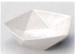
047-08-2B3 600円 2122056010 白萩ダイヤ型小鉢 (13×13×3.7H)