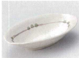
047-01-3B3 630円 2032049002 粉引ハスイ舟型小鉢 (15.5×8.8×3.5H)