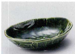
047-11-6H3 600円 2266048012 織部手織小鉢 (15×11.5×4.3H)