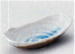
047-26-8F3 600円 2185039002 岩清水舟形長鉢 (19.5×9.2×5H)