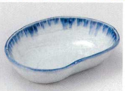
047-05-2F3 620円 1925055017 呉須刷毛まゆ型鉢 (14.3×10.5×3H)