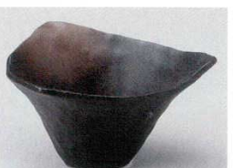
047-15-6E3 580円 2264048029 黒備前三角デザート (13×12.5×6.8H)