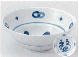
047-22-3C3 550円 2333047022 藍見込福鉢 (14φ×5.5H)