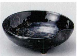
047-13-4E3 600円 2344047013 黒天目一ツ押し小鉢 (12×11.5×4.5H)