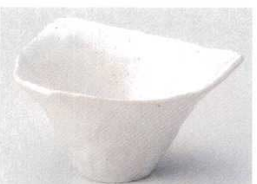
047-14-6E3 580円 2264048030 白マット三角デザート (13×12.5×6.8H)