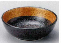
047-32-4A3 580円 2141191002 金彩結晶4.0ボール (13.2φ×4.5H)