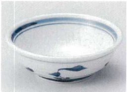
047-21-6A3 550円 2261049028 玉割花絵 4.0玉割 (12.5φ×4.5H)