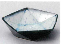
047-09-2B3 600円 1922055029 清流水天目ダイヤ型小鉢 (13×13×3.8H)