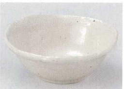
047-18-6A3 580円 2361047018 白唐津石目型小鉢 (13.5φ×5H)