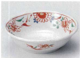
047-16-1K3 580円 1917039007 華万葉4.5小鉢 (13.9φ×4.2H)