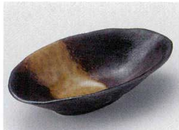
047-02-3B3 630円 2032049001 焼しめ舟型小鉢 (15.5×8.8×3.5H)