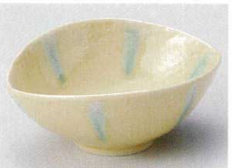
047-23-8F3 550円 2385047023 黄緑点布目楕円小鉢 (13×11×5.5H)