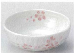
047-12-3B3 600円 2332047012 しだれ桜たわみ4.0鉢 (12φ×4.8H)