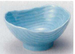
047-30-6B3 600円 1962055014 トルコ木目4.0小鉢 (12×11×5.7H)