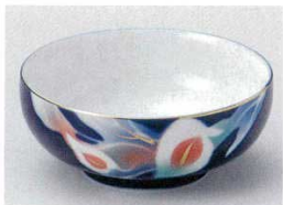
047-07-1H3 600円 2316047007 花青蘭小鉢 (12.2φ×5H)