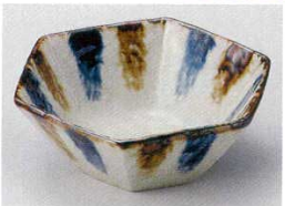
047-04-8F3 620円 2385047004 2色流し六角4.5鉢 (14.7×13.2×5.2H)