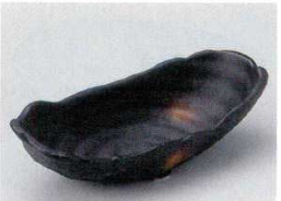
047-28-8F3 600円 2185039008 美濃備前舟形長鉢 (19.5×9.2×5H)